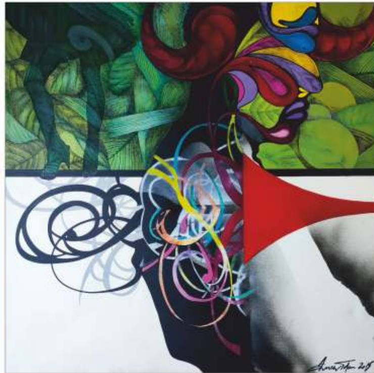
Faun Anca TOFAN