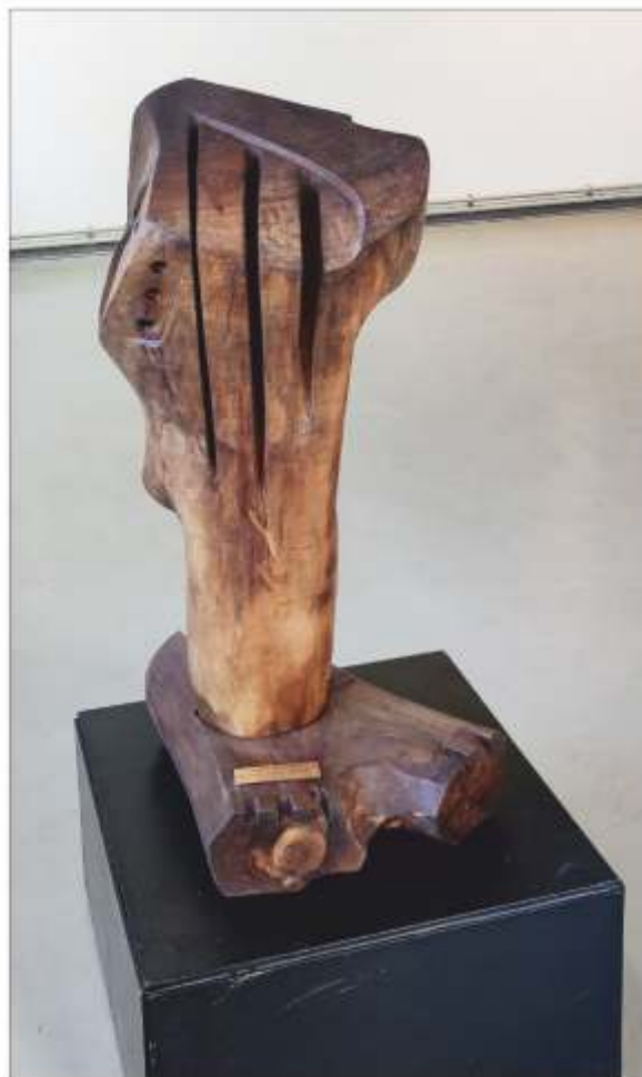
Sunet - formă - vehicul Bogdan MURARIU