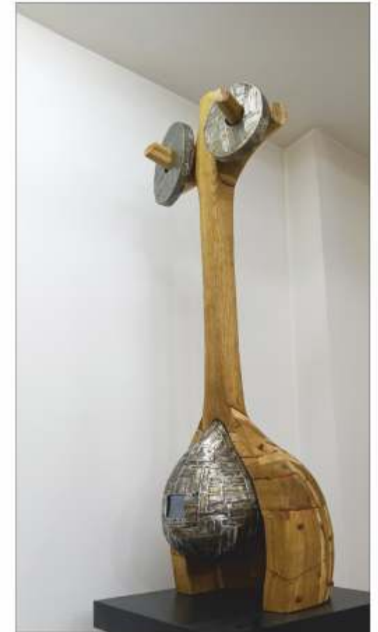
Omul alternativ Eduard COSTANDACHE