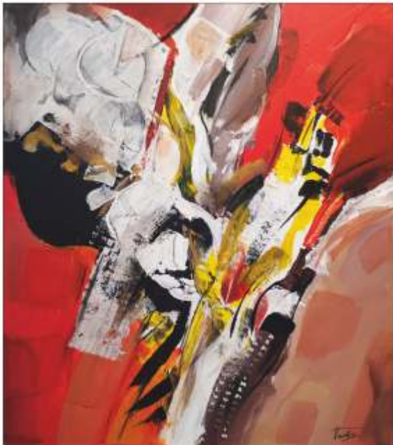
Compoziție Tudor IOAN