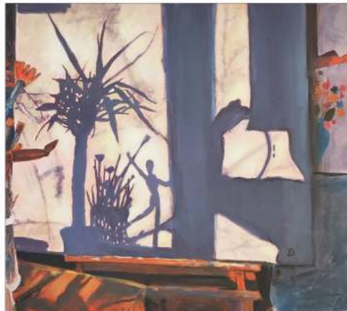
Umbre în atelier Xenia BOTEA