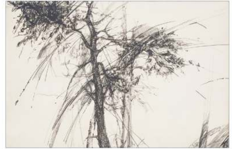
Peisaj Laurențiu BURLACU