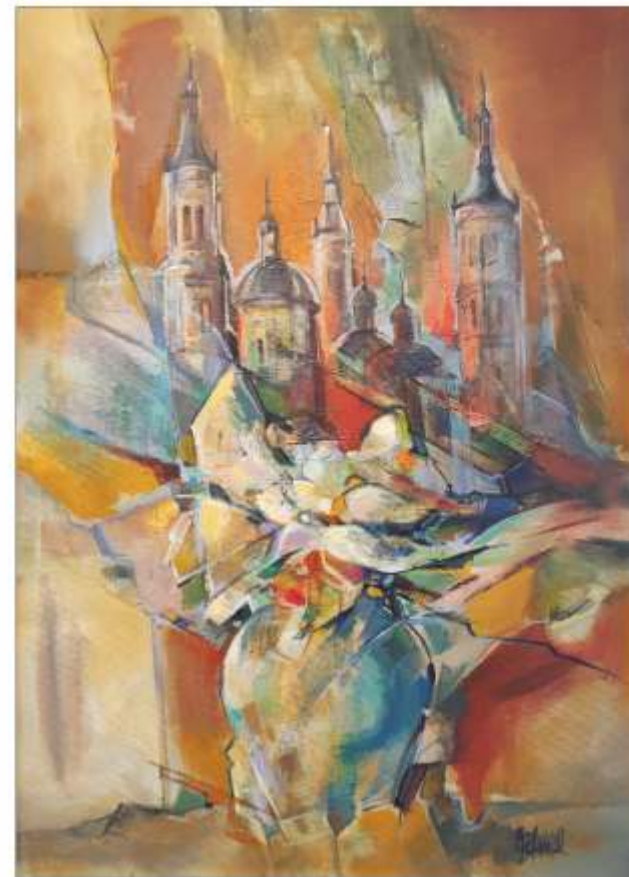
Regăsiri spirituale Olimpia ȘTEFAN