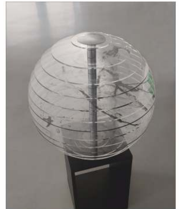
Orașul perfect Horia SUCEVEANU