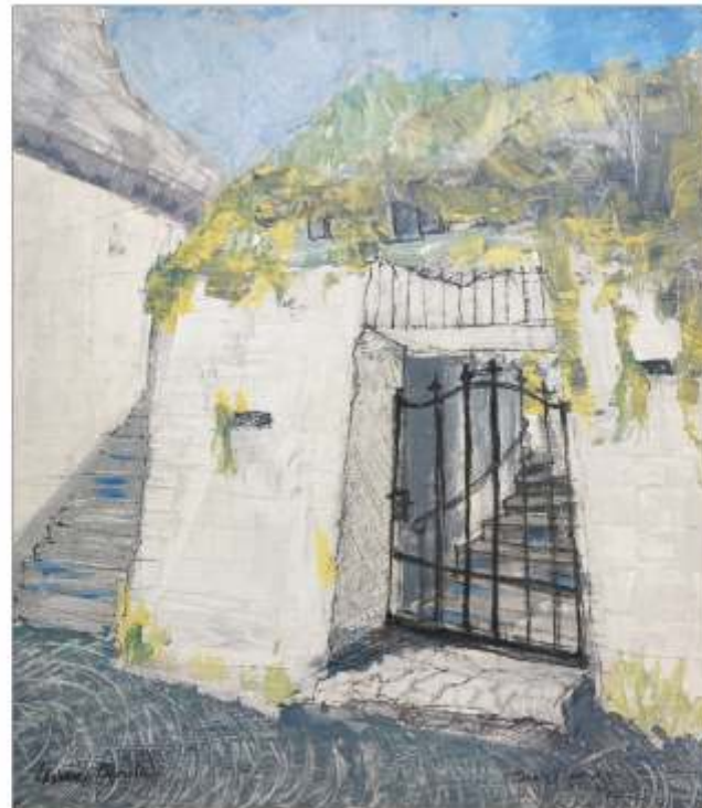
Secret garden Lavinia COȘOVLIU