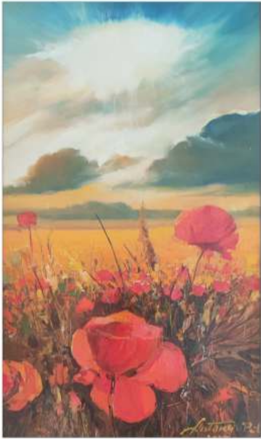
Apus de soare Antonio PĂLIE