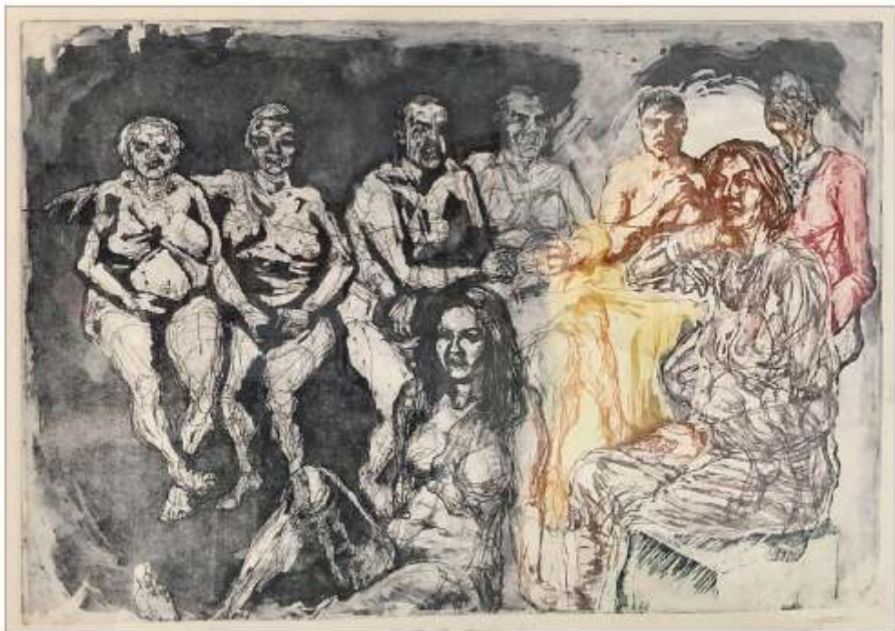
Secrete de familie III Tudor ȘERBAN