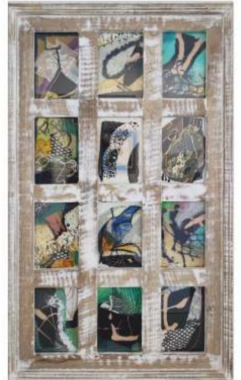
Miniatură textilă Simona PASCALE