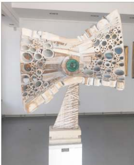
Fluture zburând Denis BRÎNZEI