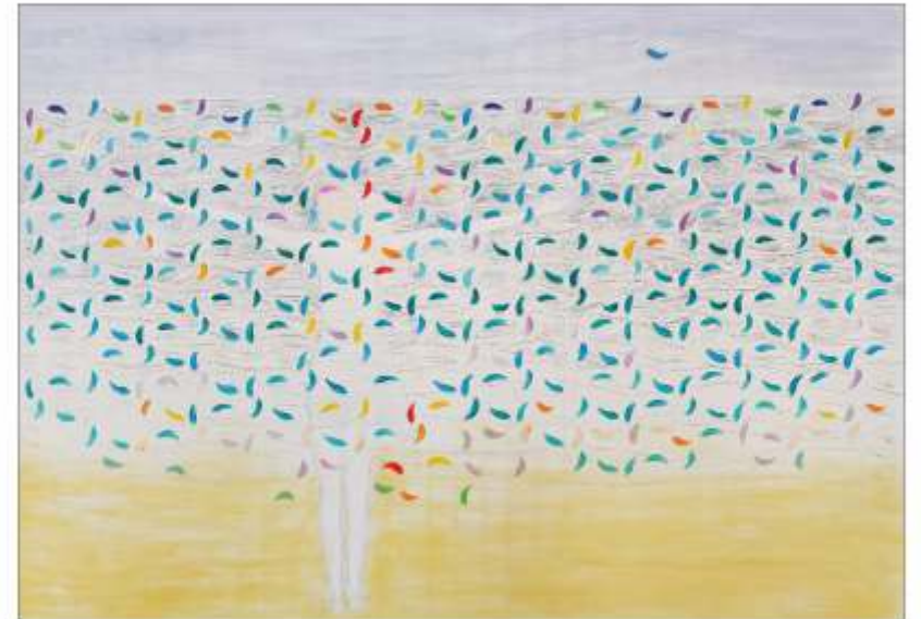
Îmbrățișând marea Ștefan AXENTE