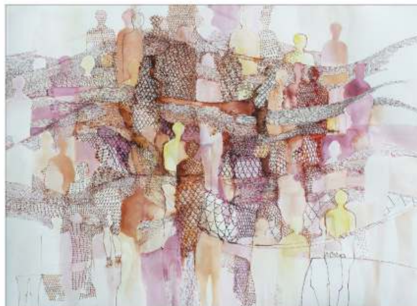
Fire Mihaela BRUMAR