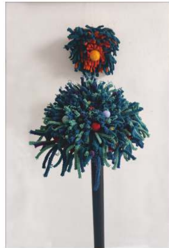
Cuibul dimineții Sorina VĂDEANU