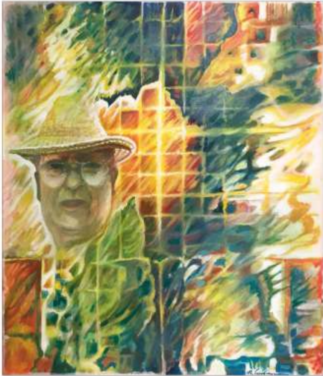
Fugit irreparabile tempus! Nicolae CĂRBUNARU