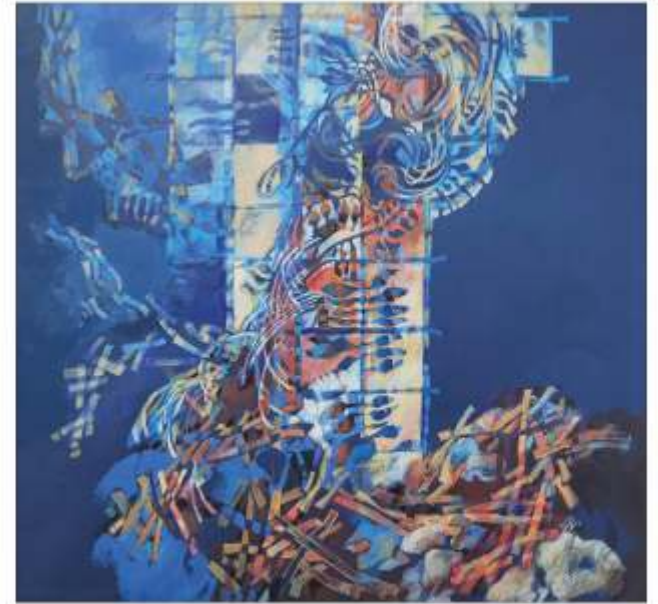
Ritm ascensional Liliana NEGOESCU