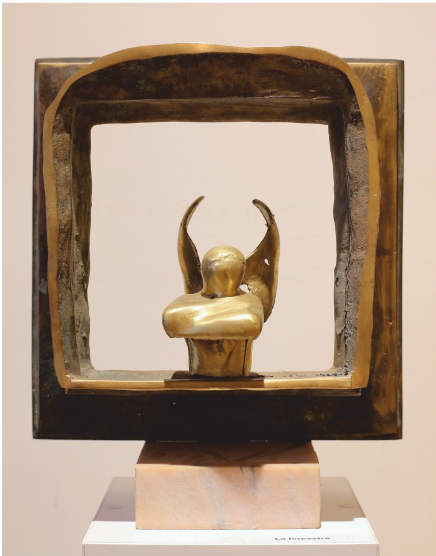
La fereastră - bronz patinat, colecție personală, 1989