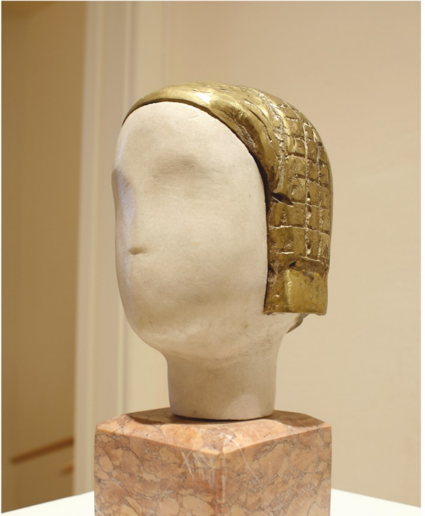
Portret - marmură, bronz, colecție personală, 1991