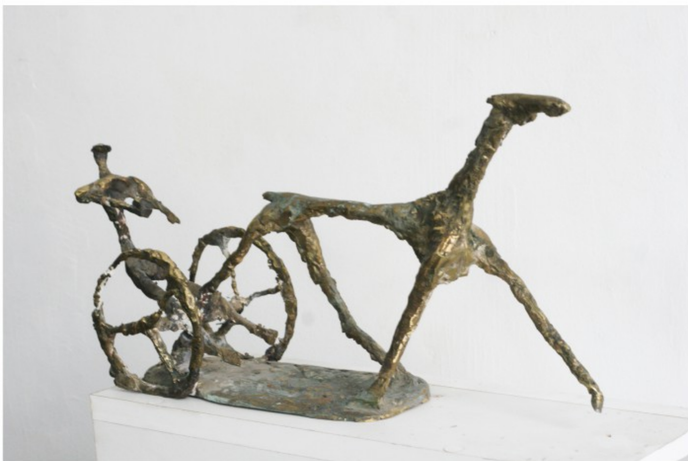
Hipcă - bronz patinat, colecție personală, 1993