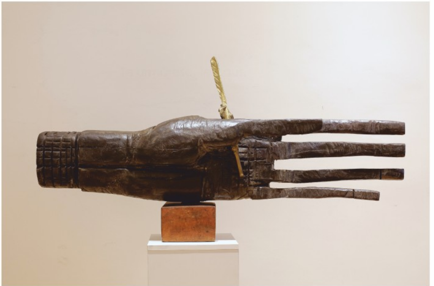
Stare poetică - lemn și alamă, colecție personală, 1992