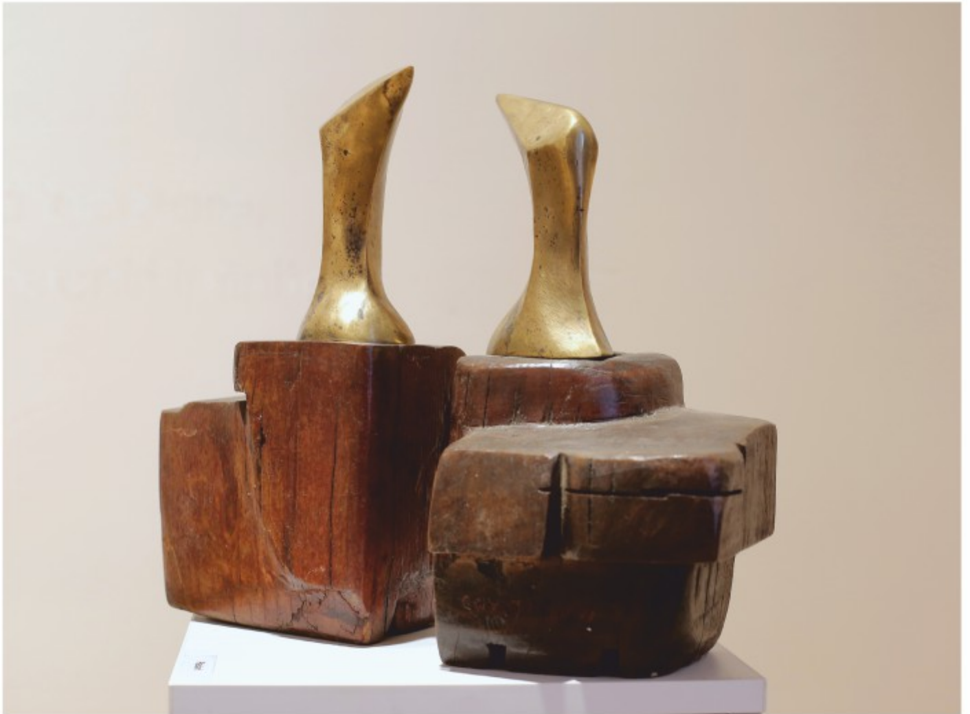
Păsări - lemn și bronz, colecție personală, 1987