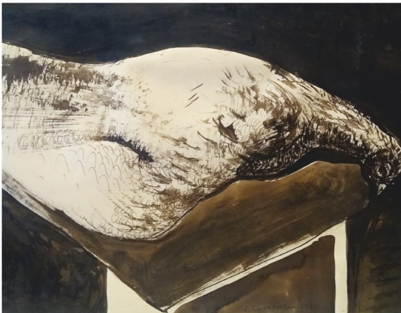
Fazan - laviuri cu baît, colecție personală