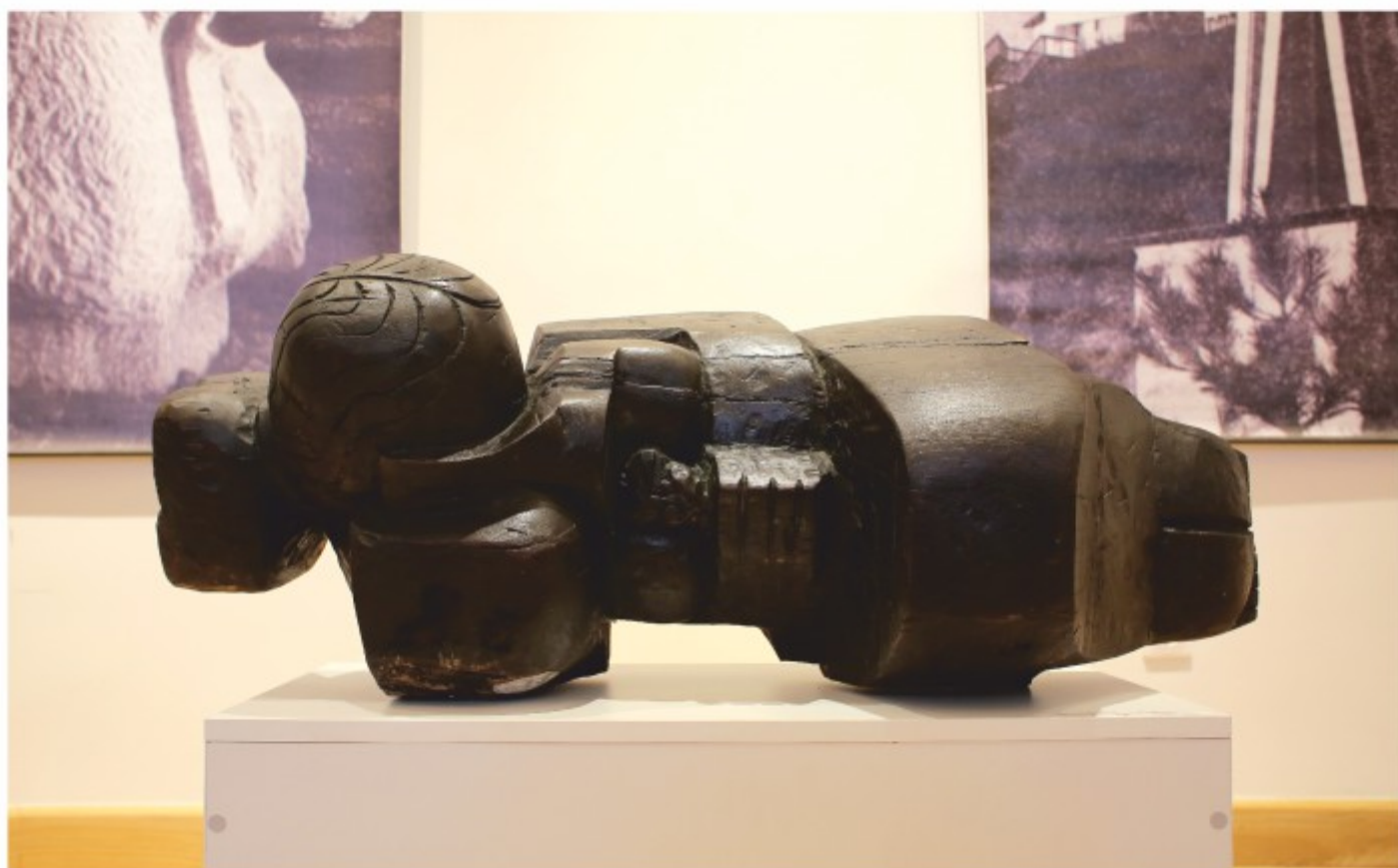
Figură culcată - lemn, colecție personală, 1988