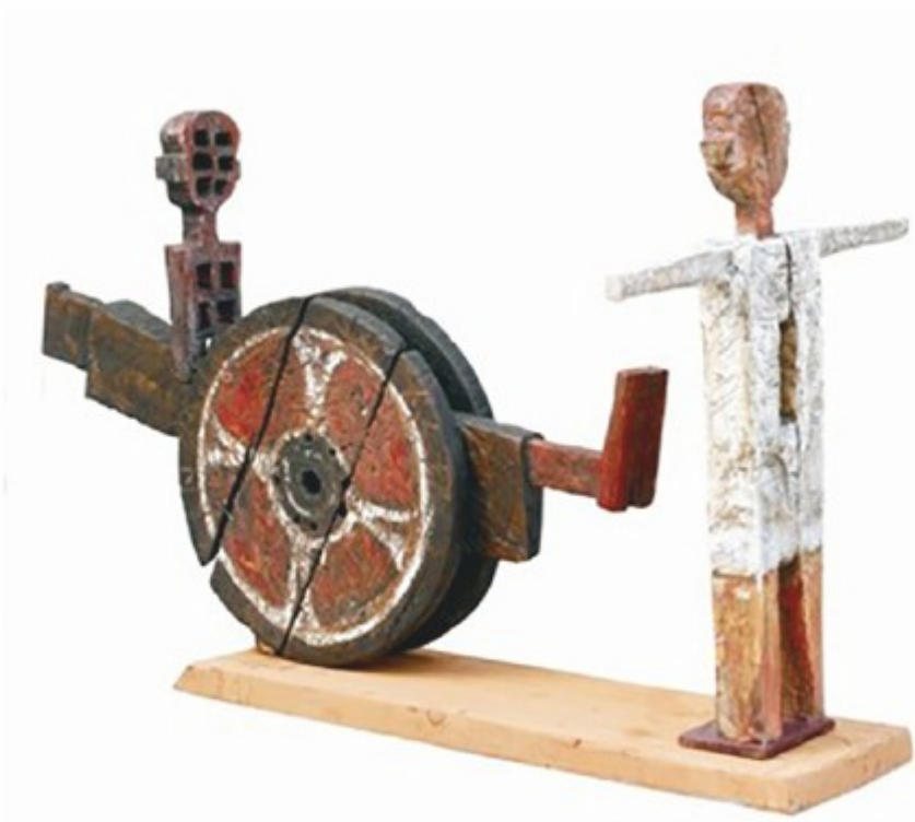
Cotigari - lemn patinat, colecție personală, 2020