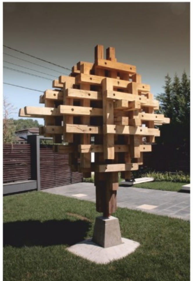
Arbore - lemn , colecție particulară, București, 2012