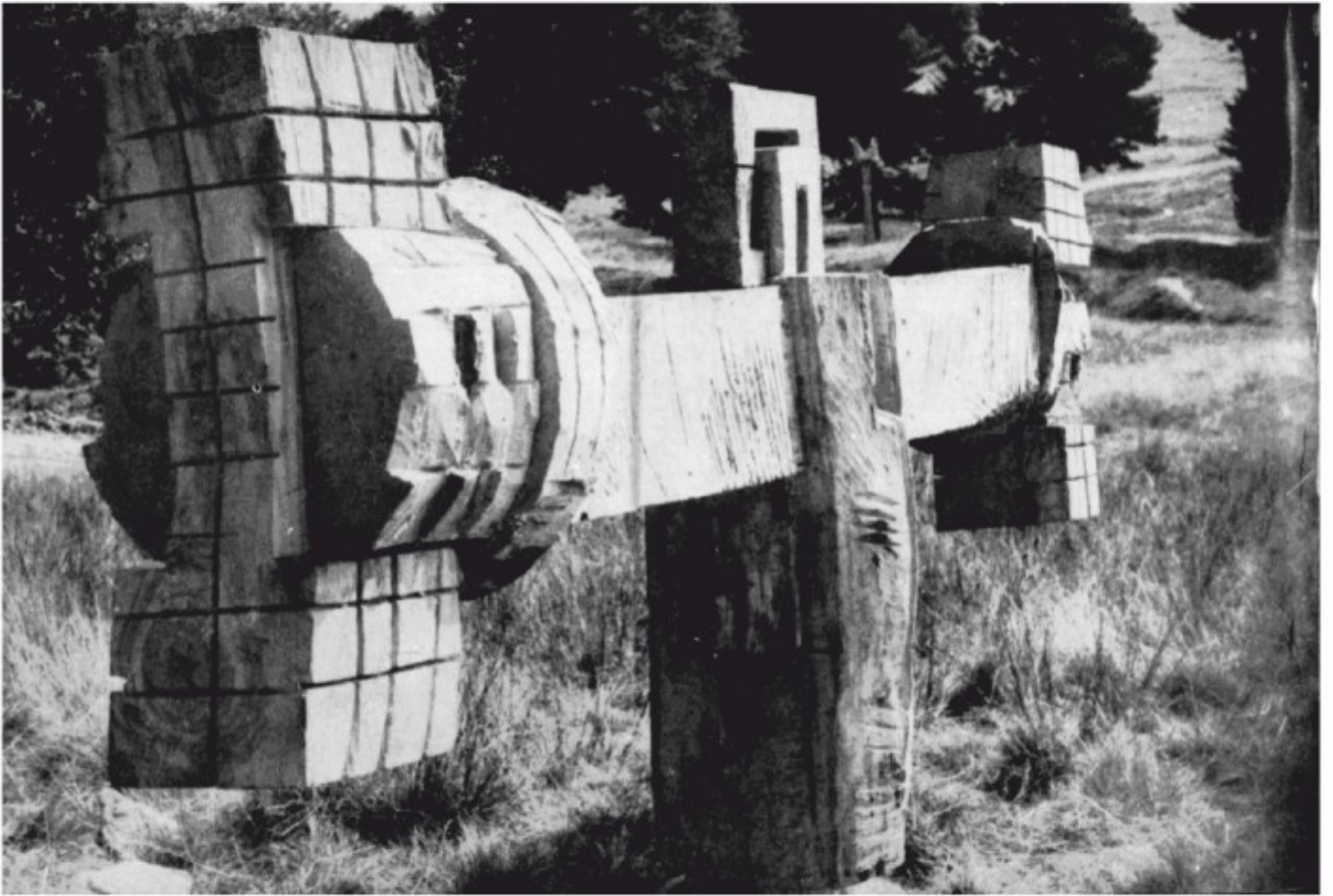
Zbor - Săliște, Sibiu, lemn, 1979