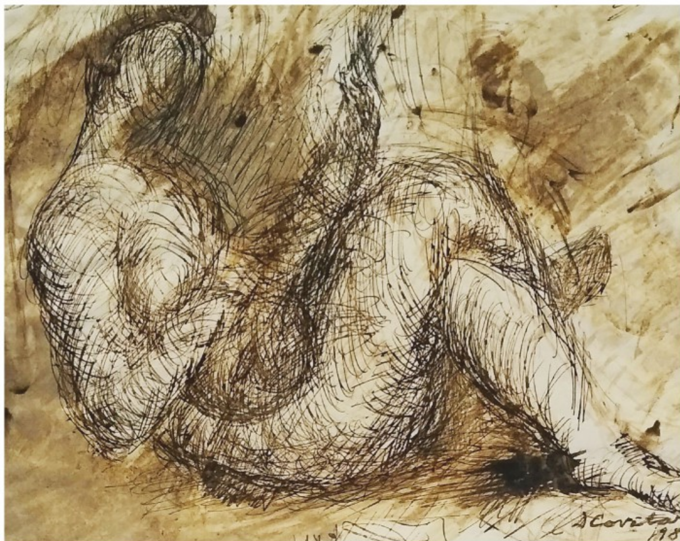
Elegie - laviuri cu baiț, colecție personală