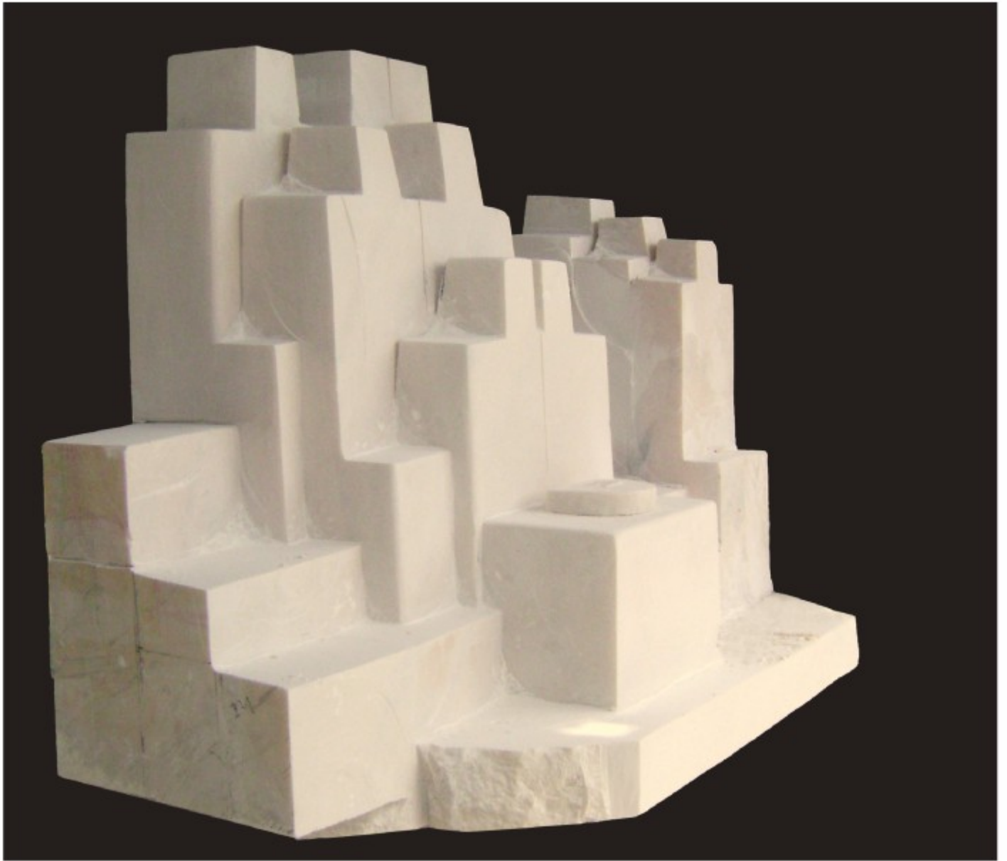
Amfiteatru - marmură, Drăgășani, Vâlcea, 2004