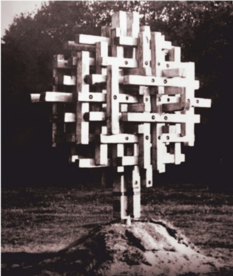
Arbore - lemn , Simpozionul de la Reci, Covasna, 1983, reamplasată după 1990 la Arcuș, Covasna