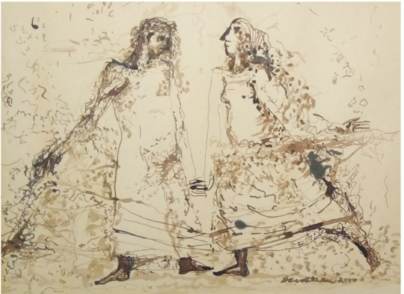
Dantesca - laviuri cu baiț, colecție personală