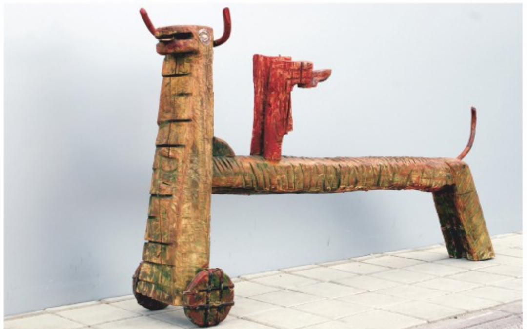
Himeră - lemn patinat, colecție personală, 1995