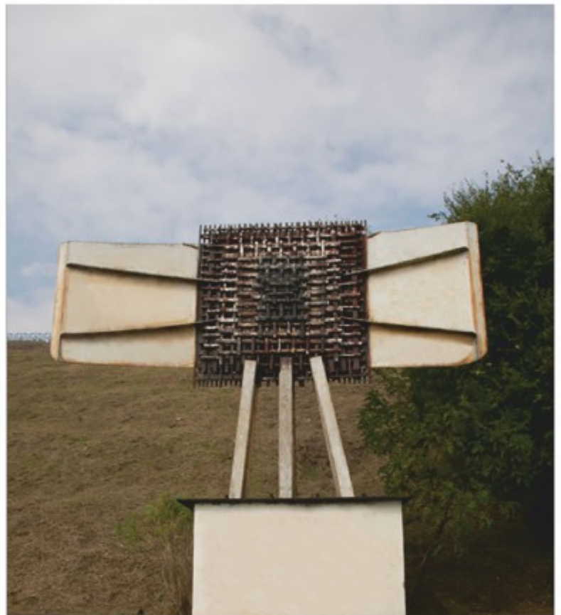
Receptor - metal, faleza Dunării, Galați, 2020