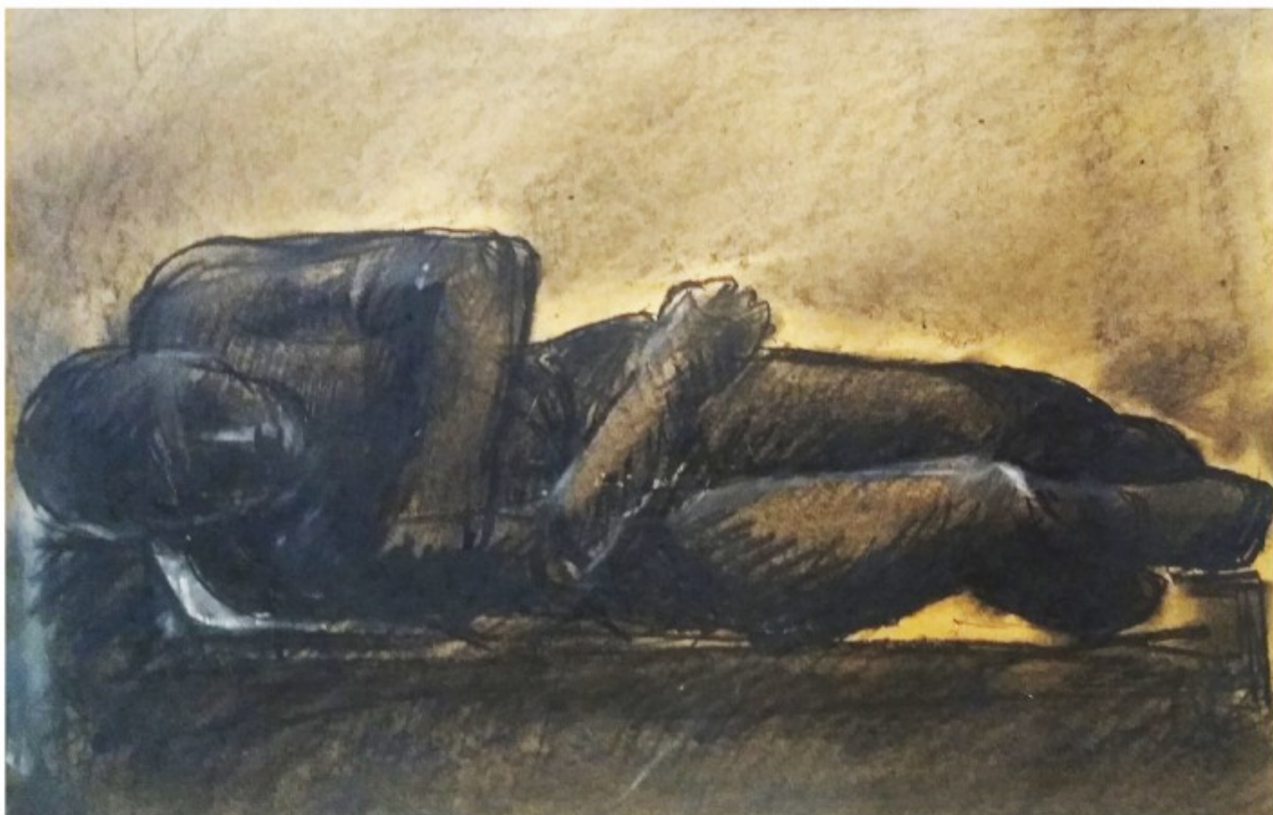
Somnul - cărbune, colecție personală