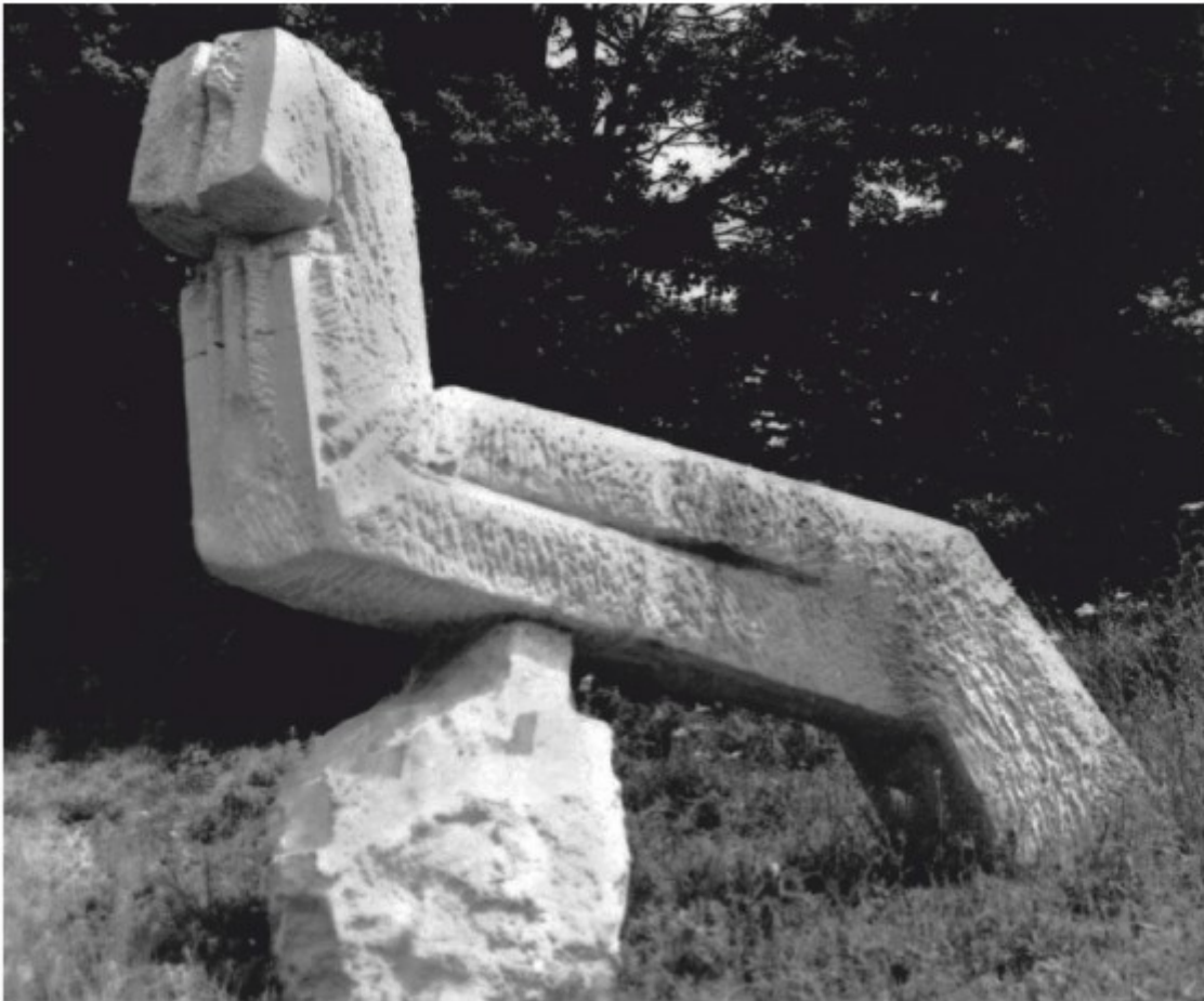
Himeră - piatră, Măgura, Buzău, 1978