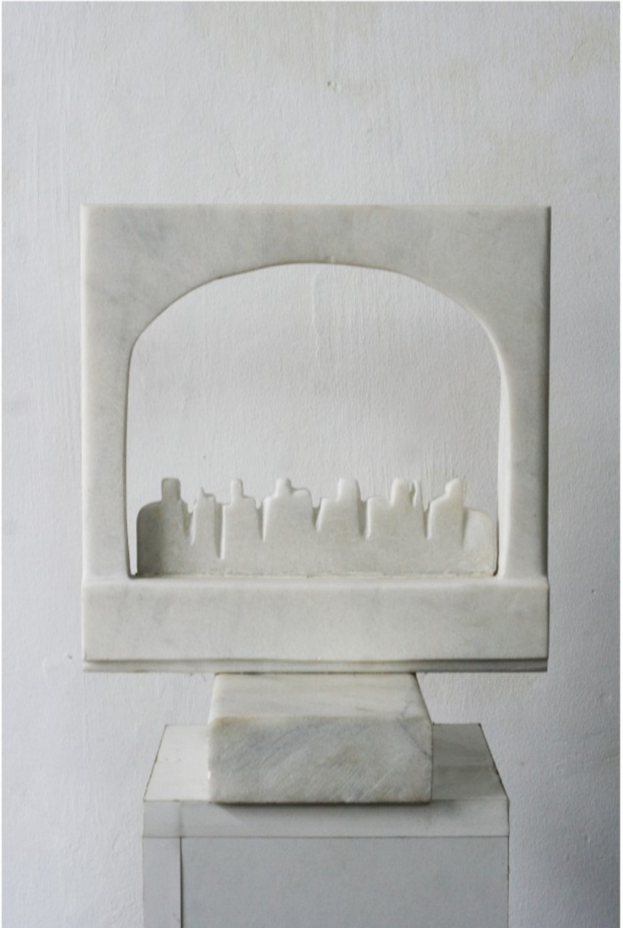
Loja - marmură, colecție personală, 1988