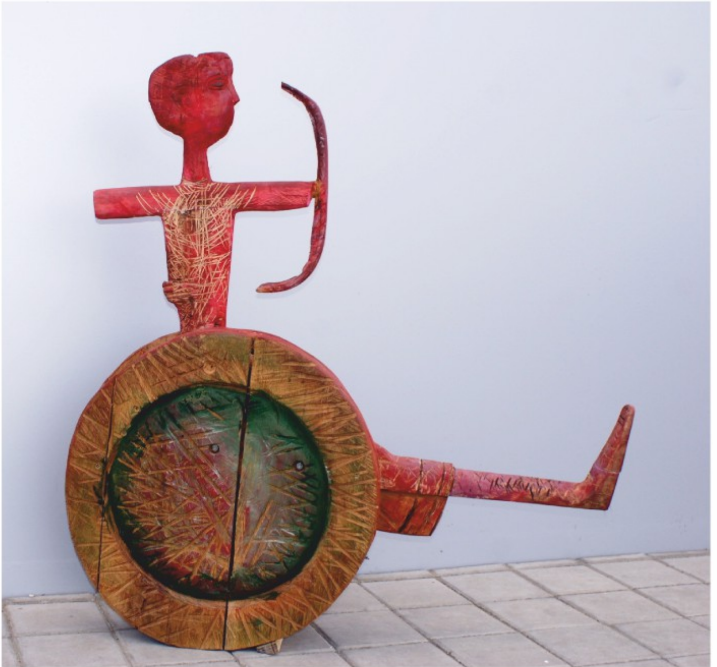
Arcaș - lemn patinat, colecție personală, 2003