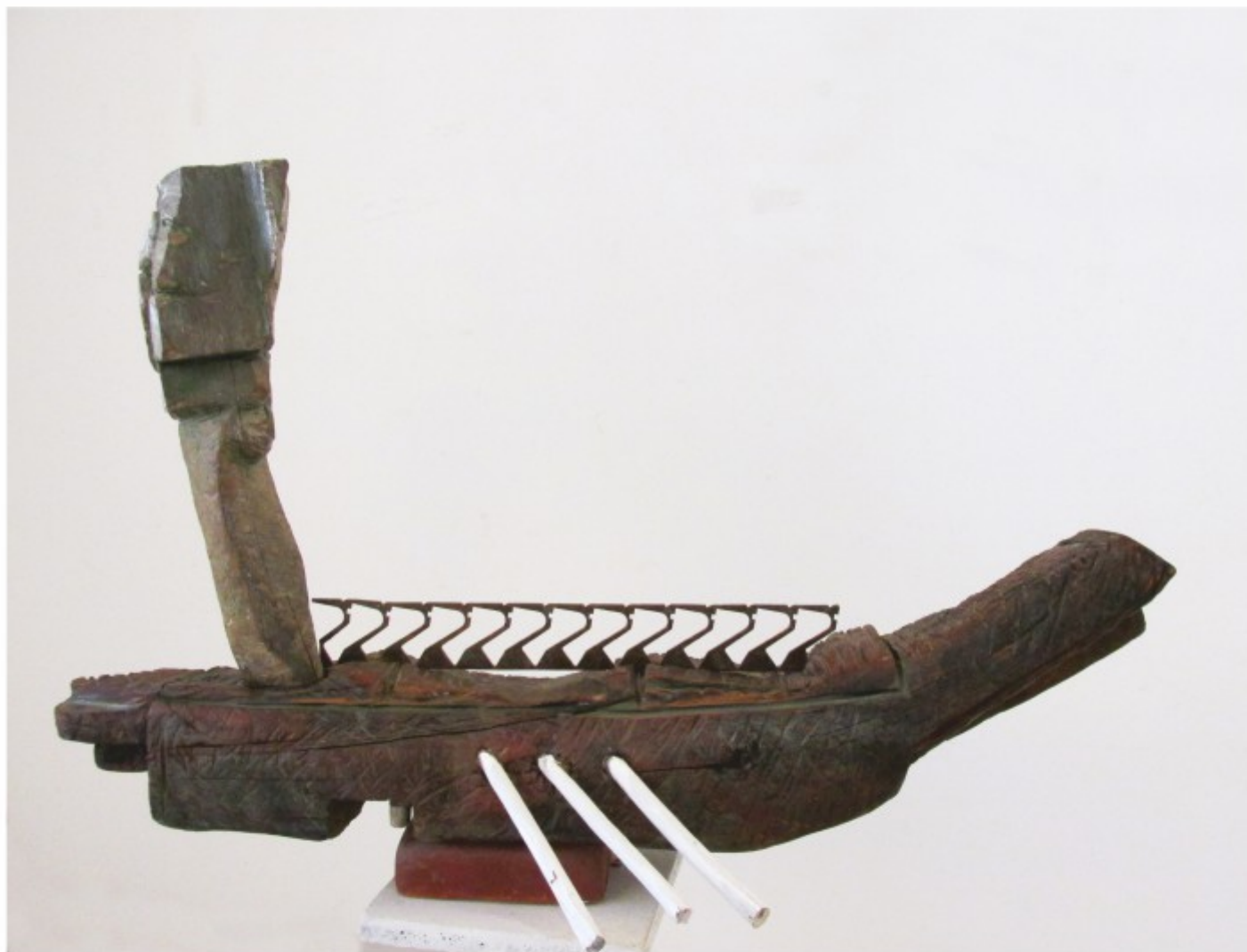
Argonauți - lemn, metal, colecție personală, 1992