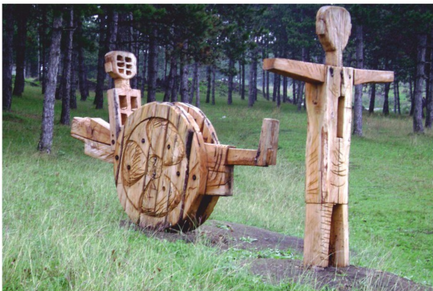
Cotigari - lemn, Dorohoi, 2004