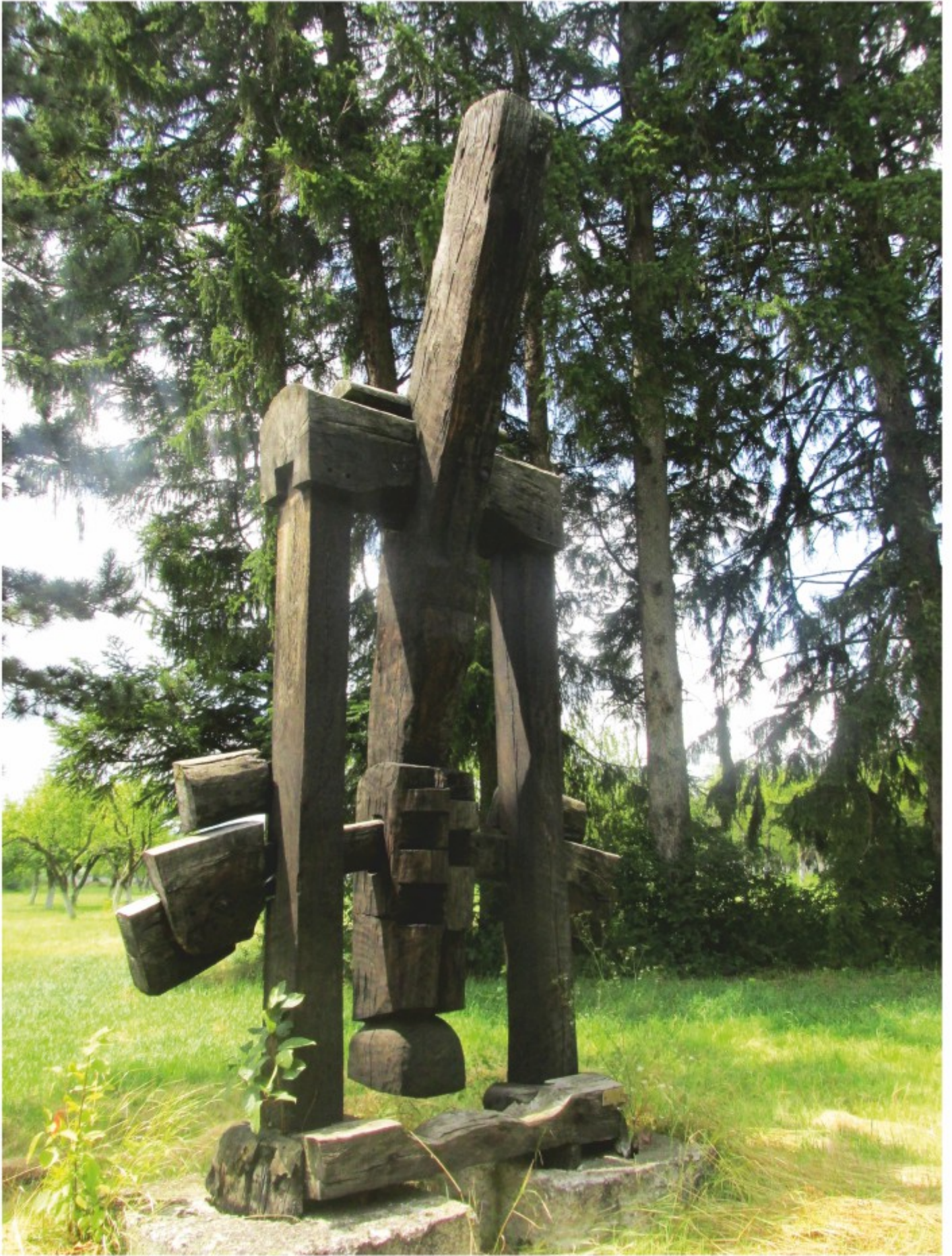
Icar - lemn, Arcuș, Covasna, 1974