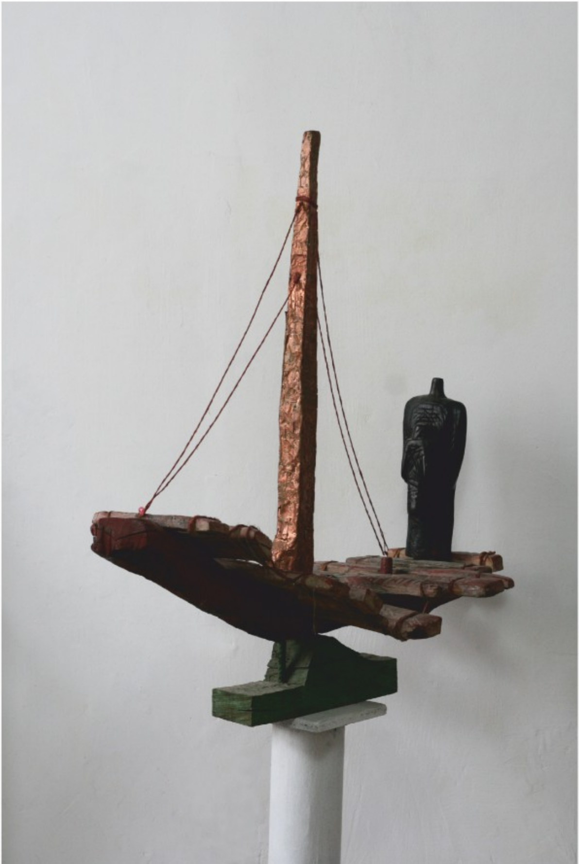
Luntrea lui Caron - tehnică mixtă, colecție personală, 1990