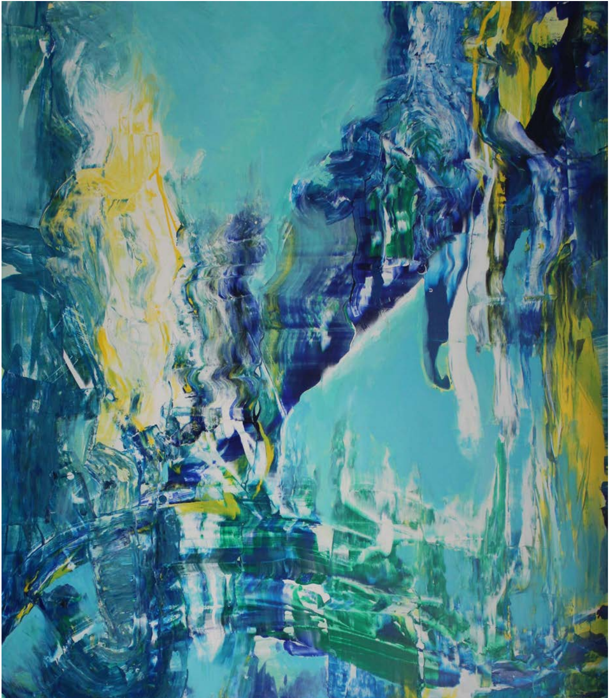
RIVER AS EXPERIENCE, 2019