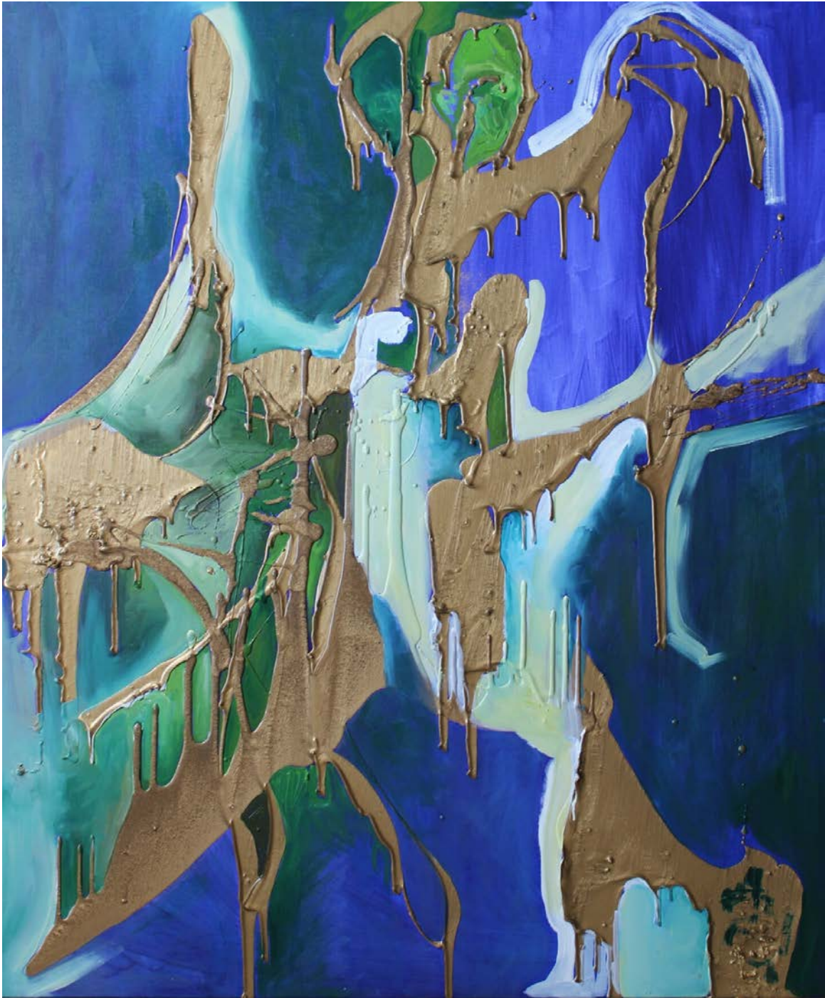
MNEMONICS -STORIES OF ADA KALEH, 2019