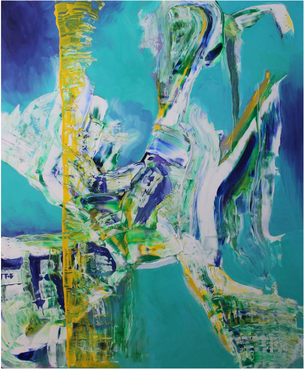
BORDER AS AN INVITATION, 2019