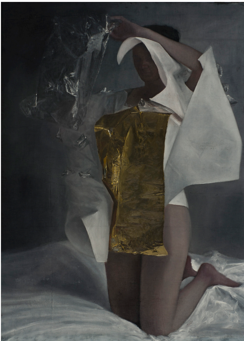
Aripi Albe, 2014, ulei pe pânză, 190x135 cm

2017 New Horizons of European Painting, Frissiras Musuem, Athens, GR; The Figure in Contemporary Art, Rosenfeld Porcini Gallery, London, UK 2016 4 Points, Galleria Doris Ghetta, Ortisei, IT; Lifting the Veil, Rosenfeld Porcini, London, UK; Extension.ro, Triumph Gallery, Moscow, RU; The Divided Woman, Nunc Contemporary, Antwerp, BE 2015 Nauz, Performance Transart, Galleria Doris Ghetta, Ortisei, IT 2014 Defaced, Boulder Museum of Contemporary Art, Boulder, USA