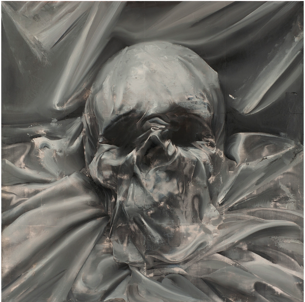
Cortina de fier, 2015, ulei, acrilic și monoprint pe pânză de in, 80x80 cm