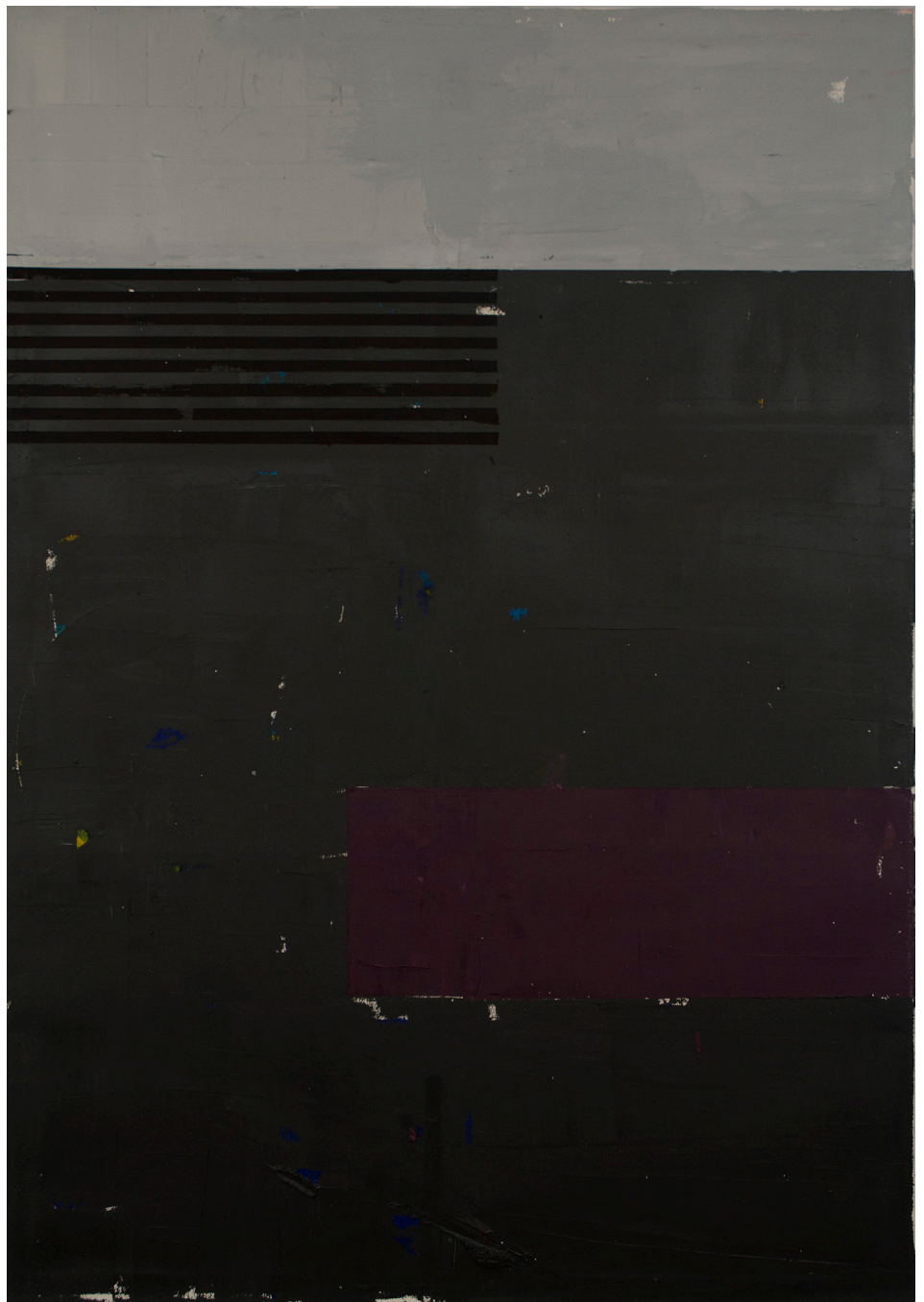
Fără titlu, 2015, ulei pe pânză, 140x120 cm

2016 Layers, Nicodim Gallery, Bucharest, RO 2015 Art Encounters 1st edition: Appearance & Essence, National Museum of Art, Timisoara, RO 2014 The Go Between, curated by Eugenio Viola, Museo Capodimonte, Napoli, IT; A Few Grams Of Red, Yellow, Blue. New Romanian Art, Centre for Contemporary Art Ujazdowski Castle, Warschau, PL 2013 Pushing Jesus, Larm Gallery, Copenhagen, DE 2012 Strabag Art Award, Strabag Kunstforum, Vienna, AT 2011 Gemalter Raum, Periscope:project:space, Salzburg, AT; Dry and wet paintings, Crown Gallery, Brussels, BE