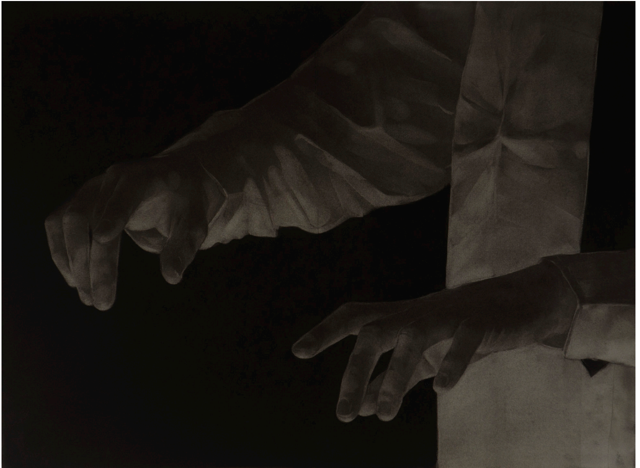
Trădătorul I, 2015, cărbune si monoprint pe panză de in, 40,5x57 cm