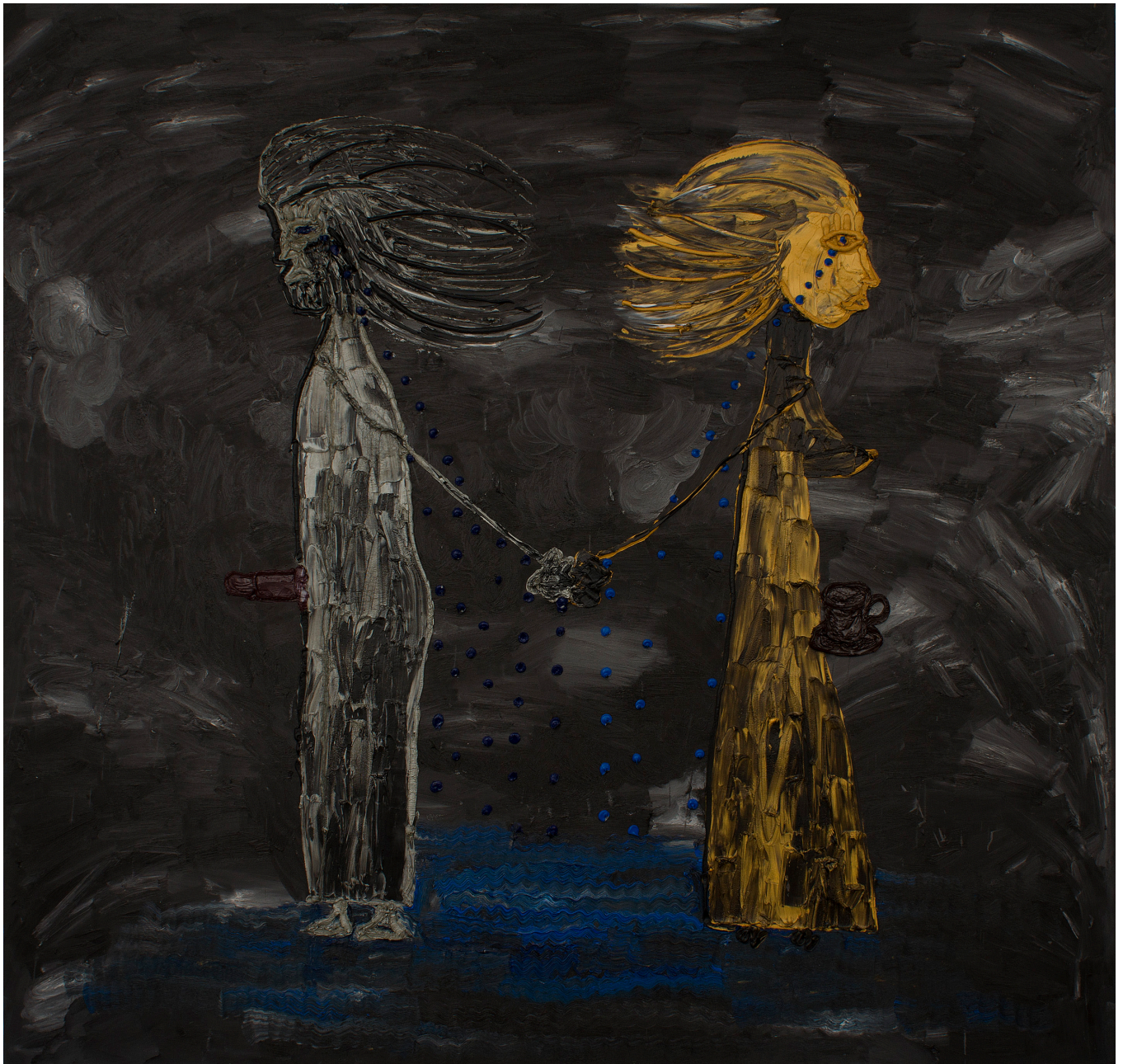
Fără titlu, 2016, ulei pe pânză, 190x200 cm

2015 Prize winners' exhibition, Simeza Gallery, Fine Artists Association, Bucharest, RO 2012 Smooth Tough, factor92 Gallery, Bucharest, RO 2011 Funeraria, The National Museum of Contemporary Art, Bucharest, RO; Badly Happy: Pain, Pleasure and Panic in Recent Romanian Art, The Performance Art Institute, San Francisco, USA 2010 Zoomania, The National Museum of Contemporary Art, Bucharest, RO