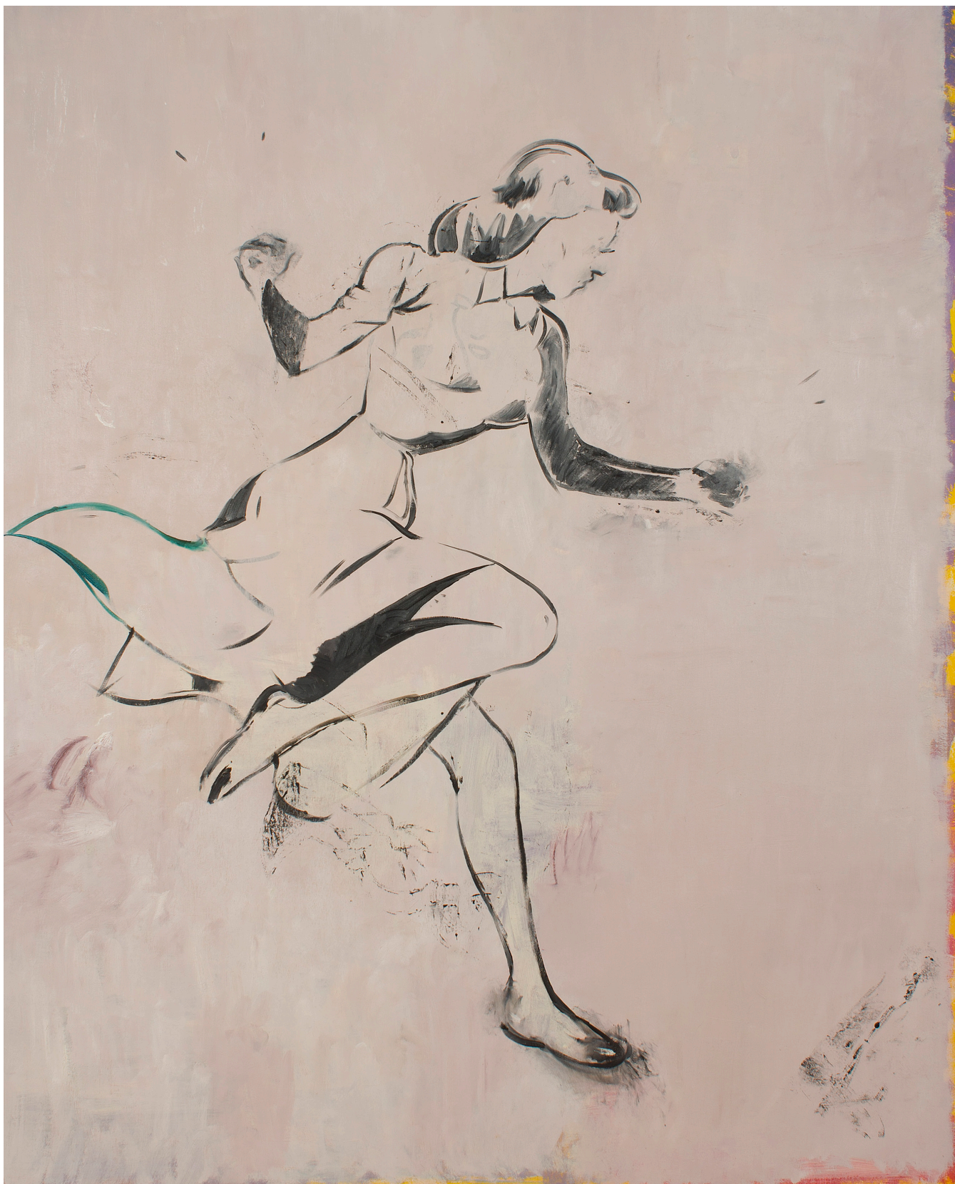
Un moment mai târziu, 2013, ulei si acrilic pe pânză, 193x155 cm