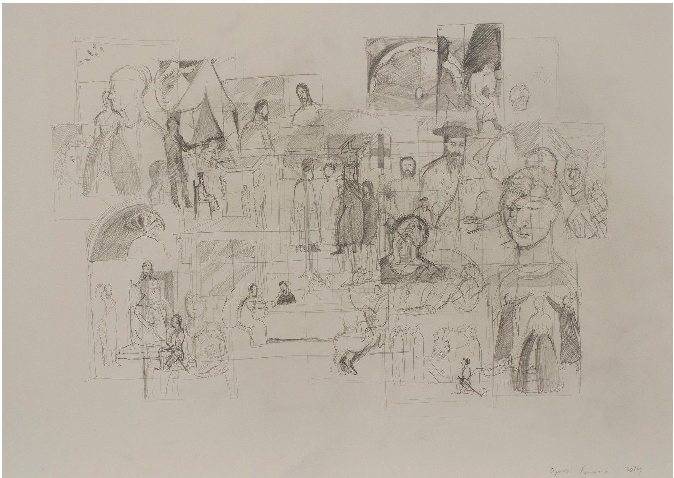
Toate imaginile dintr-o carte, Pierro della Francesca 2014, creion pe hârtie, 55,5x75,5 cm

2017 Watch The Line While Crossing, Prometeogallery, Milan, IT; Double Coding – MUDAM, Musée d'Art Moderne Grand-Duc Jean, Luxembourg, LU; The Basilisk, Nicodim Gallery, Los Angeles, USA; A Moveable Feast I, Eric Hussenot, Paris, FR 2016 Silke Schatz – Choose Love, Wilkinson Gallery, London, UK; George Grosz: Politics and his Influence, David Nolan Gallery, New York, USA; Track Changes, Mendes Wood DM, São Paulo, BR 2015 Berlin Show #4: Inventory, Galeria Plan B, Berlin, DE; Vienna Biennale 2015 – Ideas for Change, Austrian Museum of Applied Arts, Vienna, AT