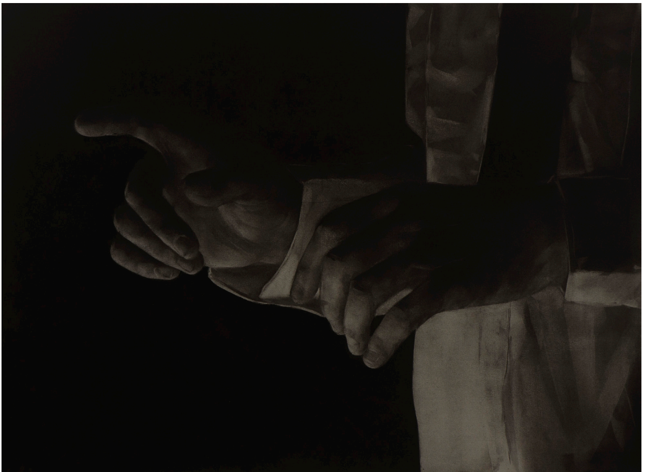
Trădătorul II, 2015, cărbune si monoprint pe panză de in, 40,5x57 cm