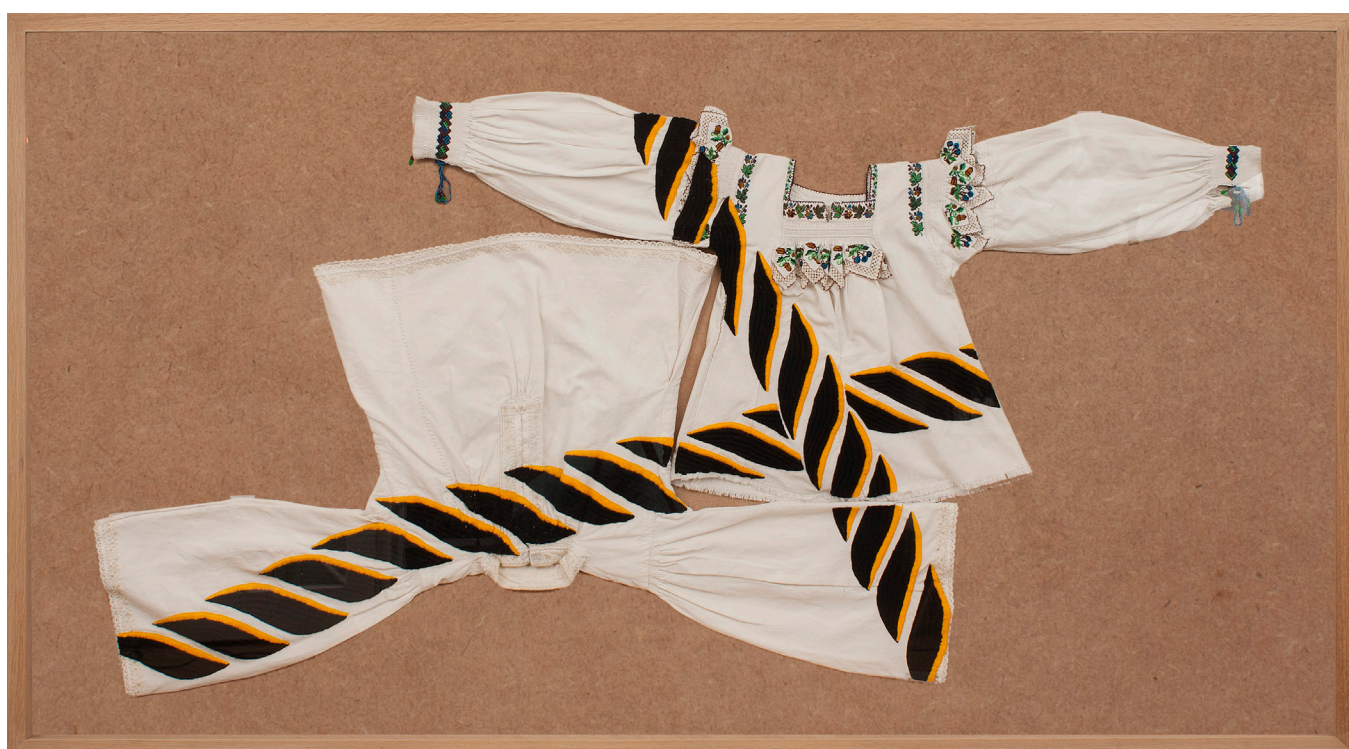
Antroposinaptic-Cuplul, 2015, broderie pe cămași tradiționale românești, 100x185 cm