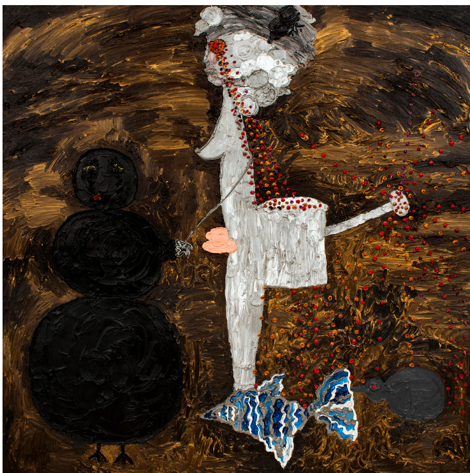
Fără titlu, 2016, ulei pe pânză, 200x200 cm