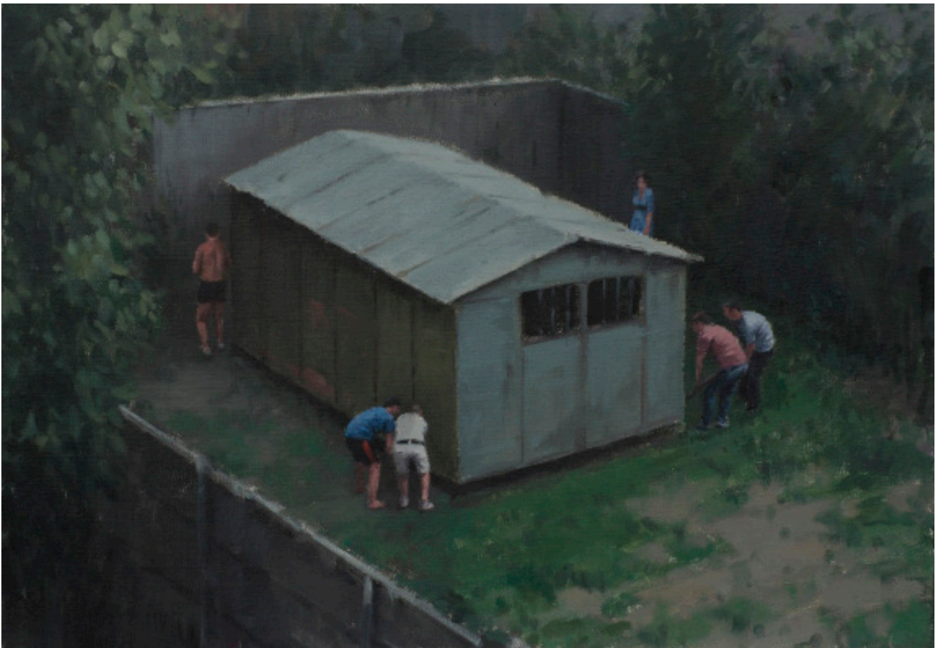
Garaj, 2010, ulei pe pânză, 35x50 cm

2017 The Hierophant, Nicodim Gallery, Bucharest, RO 2016 ...hounded by external events..., MAUREEN PALEY, London, UK; Domino, Galeria Plan B, Cluj, RO; George Grosz: Politics and his Influence, David Nolan Gallery, New York, USA; Track Changes, Mendes Wood DM, São Paulo, BR; Layers, Nicodim Gallery, Bucharest, RO 2015 Tracing Shadows, PLATEAU, Samsung Museum of Art, Seoul, SKR, Art Encounters 1st edition: Appearance & Essence, Art Encounters, Timisoara, RO