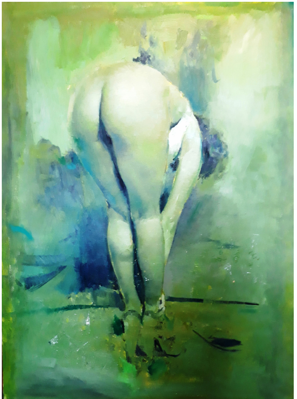
Nud, 2014, ulei pe pânză, 160x110 cm

2017 Adele, Galerie Zink, Waldkirchen in der Oberpfalz, DE 2016 #Paintingsssss, Hunted Projects, Edinburgh, Scotland, UK 2015 WORKS ON PAPER / HUNTED PROJECTS, Tilburg, NL; Megatron, Rumänisches Kulturinstitut Wien, Vienna, AT; Tower, Ibid.London, UK; Megatron, RKI – Rumänisches Kulturinstitut, Vienna, AT; What Is a Bird? We Simply Don't Know, Nicodim Gallery, Bucharest, RO 2014 Defaced, Boulder Museum of Contemporary Art, Boulder, USA 2013 Classification Bouillabaisse, Ana Cristea Gallery, New York, USA 2011 Portraits of Ambiguity, Ana Cristea Gallery, New York, USA