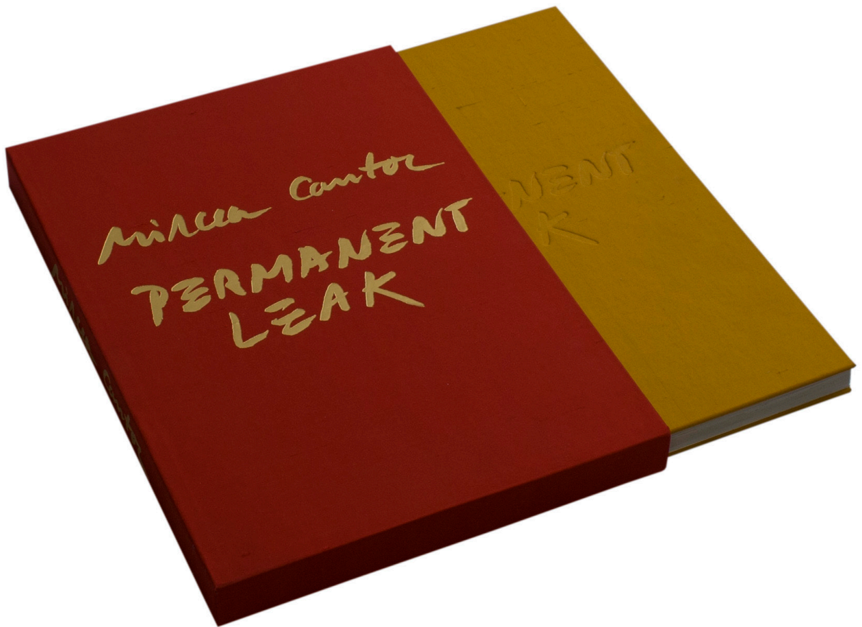
Permanent Leak, 2016. carte de artist (fotogravură), 36x25 cm