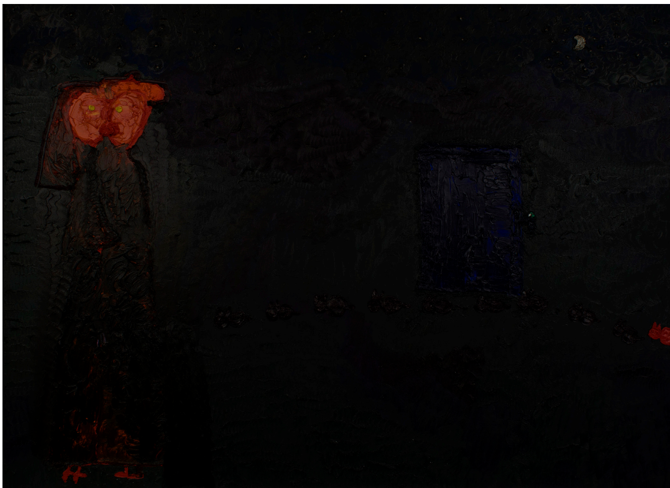
Sărutul cu ușa albastră, 2015, ulei pe pânză, 140x190 cm