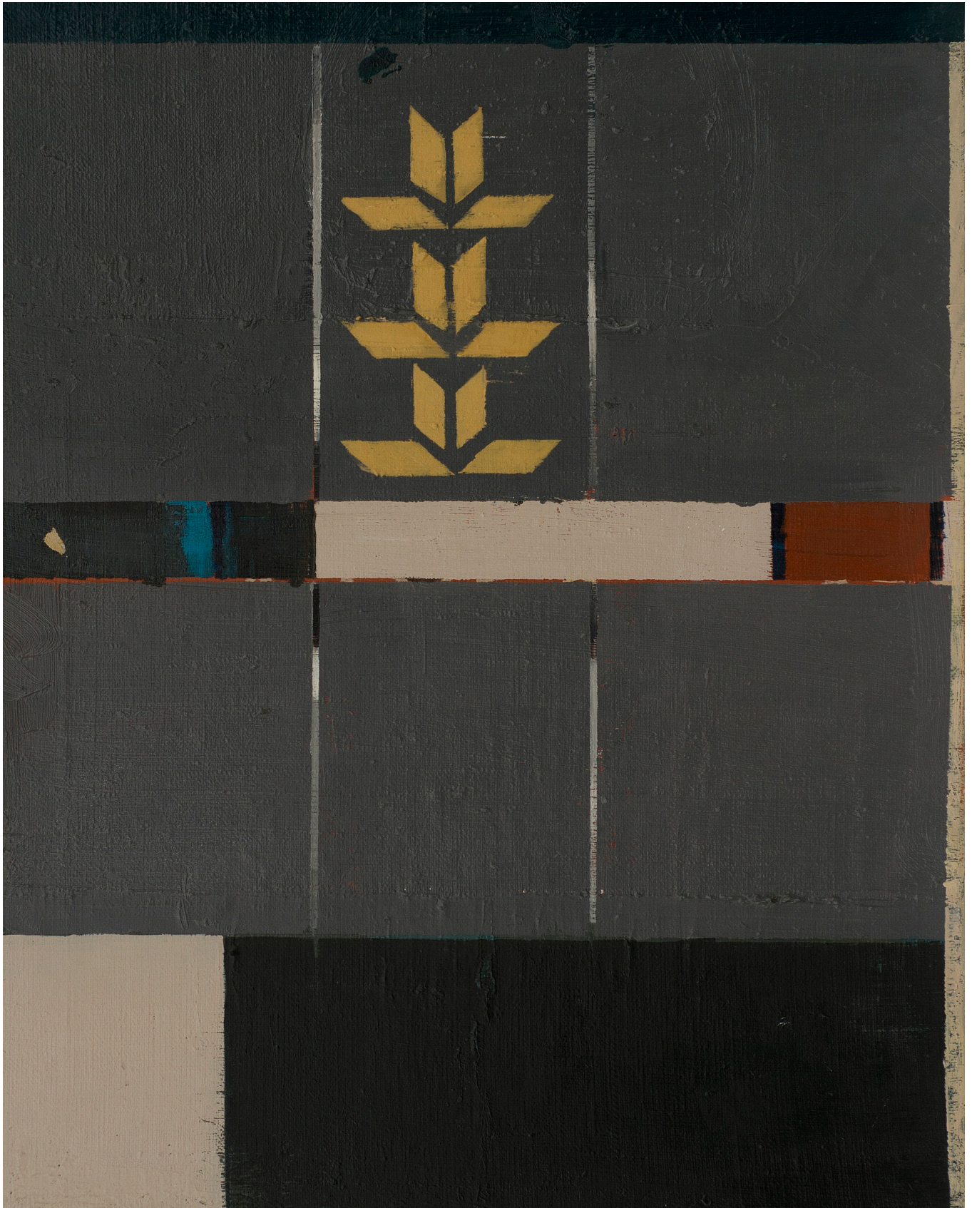
Fără titlu, 2013, ulei pe pânză, 50x40 cm