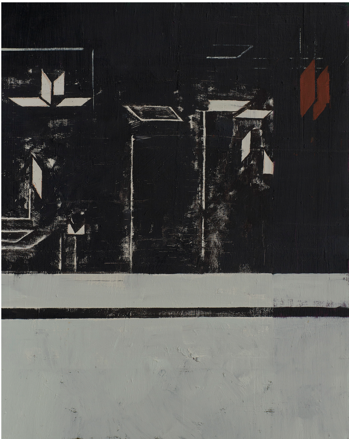
Fără titlu, 2014, ulei pe pânză, 50x40 cm