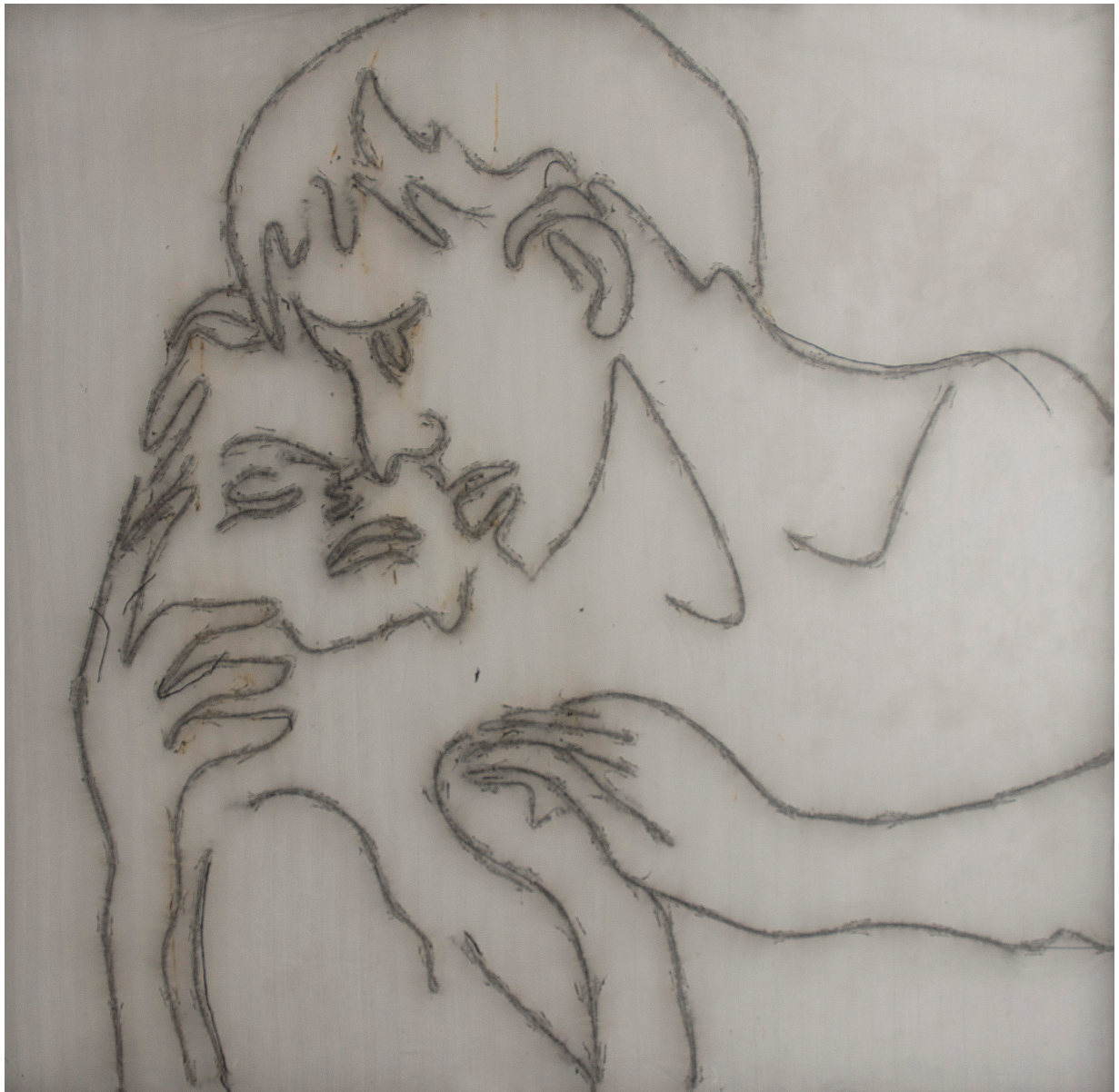
Sărutul, 2016, dinamită pe sticlă, 108x108 cm

2017 Violenti/Confini, Pinacoteca Comunale di città di Castello, Castello, IT; Pallaksh Pallaksh (I don't know just where I'm going), Dvir Gallery, Tel Aviv, IL 2016 Paravent, Dvir Gallery, Brussels, BE; Dans un monde Magnifique et Furieux, Dvir Gallery, Brussels, BE; CHOICES, Palais de Tokyo, Paris, FR; DO DISTURB, Palais de Tokyo, Paris, FR 2015 VITA VITALE, 56th Venice Biennale, Venice, IT; Fire and Forget. On Violence, Kunst Werke, Berlin, BE; Zero Tolerance, MoMA PSI, New York, USA