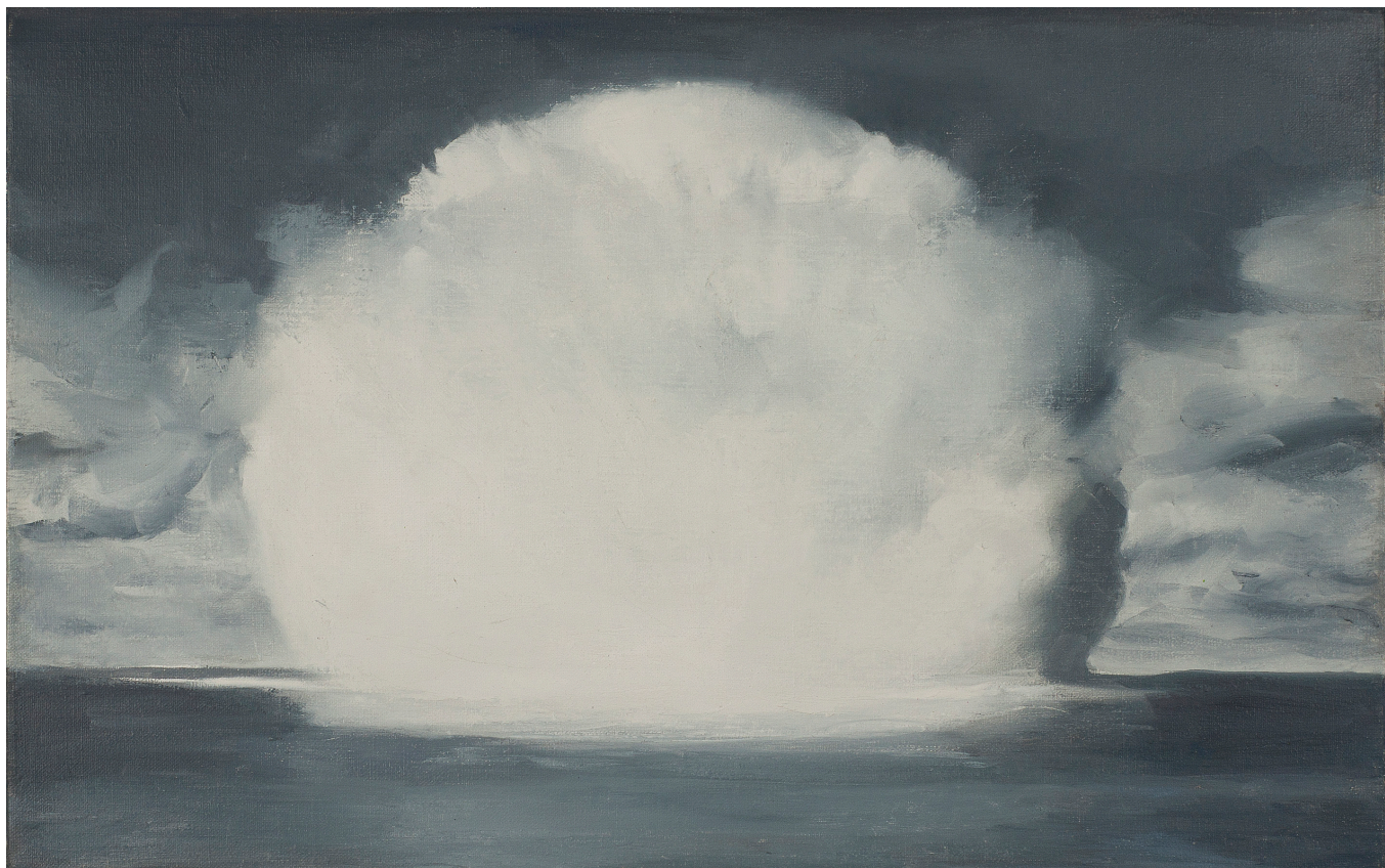
Bomba, 2008, ulei pe pânză, 43x65 cm

2017 Déjeuner sur l'herbe, Galerie Thaddaeus Ropac, Paris, FR; The Hierophant, Nicodim Gallery, Bucharest, RO; Luther und die Avantgarde, Stiftung für Kunst und Kultur e.V., Lutherstadt Wittenberg, DE; House Work, Victoria Miro Mayfair, London, UK 2016 George Grosz: Politics and his Influence, David Nolan Gallery, New York, USA; Track Changes, Mendes Wood DM, São Paulo, BR; Cher(e)s Ami(e)s: Hommage aux donateurs des collections contemporaines, Centre Pompidou - Musée National d'Art Moderne, Paris, FR 2015 Berlin Show #4: Inventory, Galeria Plan B, Berlin, DE; Art Encounters 1st edition: Appearance & Essence, ArtEncounters, Timișoara, RO