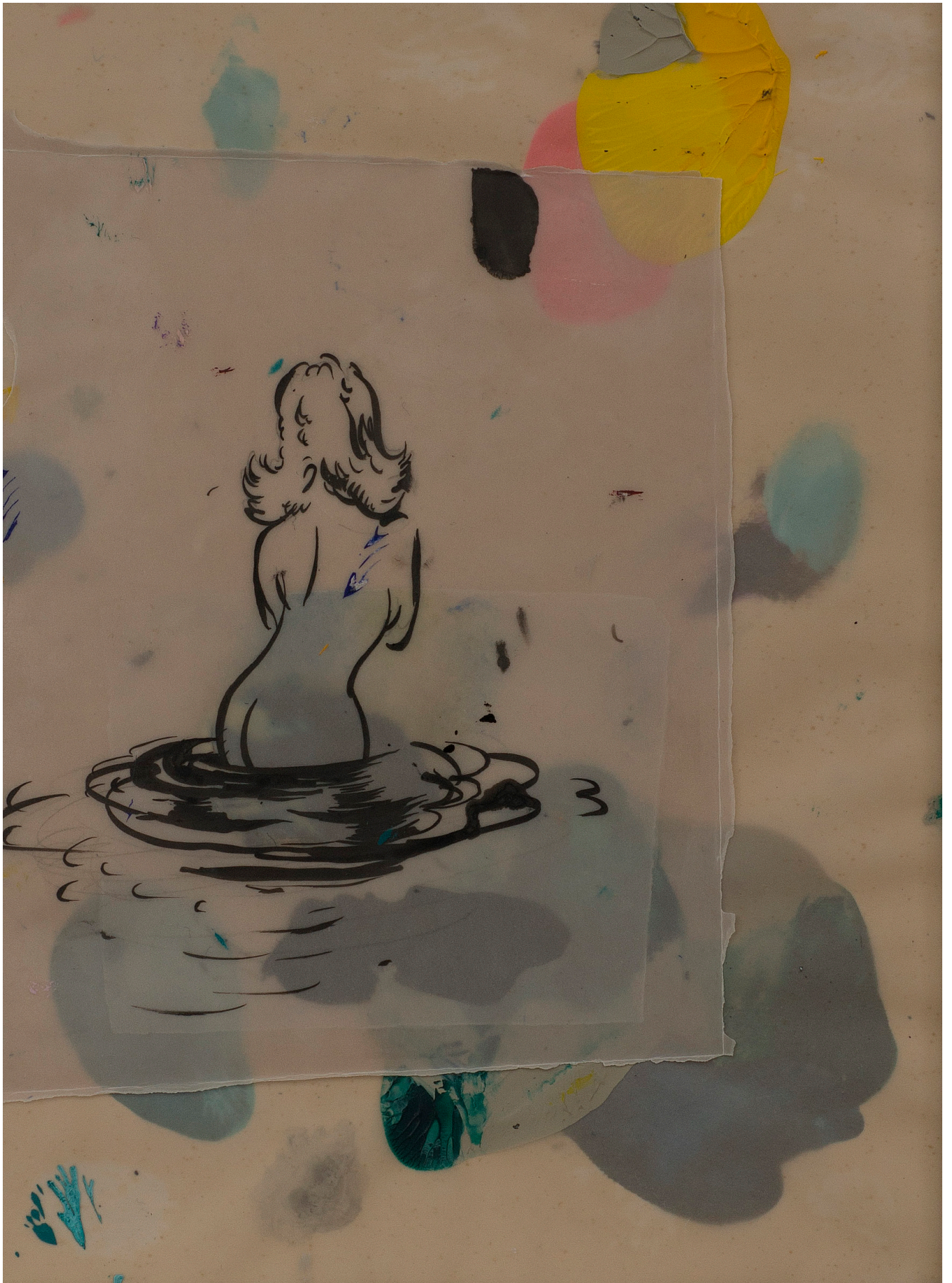
Cascada, 2015, ulei pe hârtie, 43x32 cm