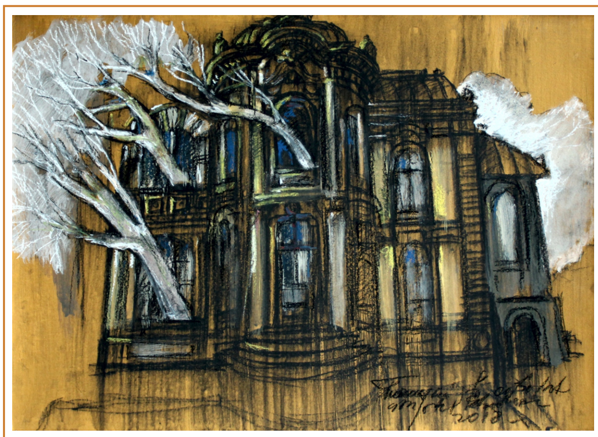
Case din cartierul de vest, 2018 tehnică mixtă pe carton, 50/70 cm