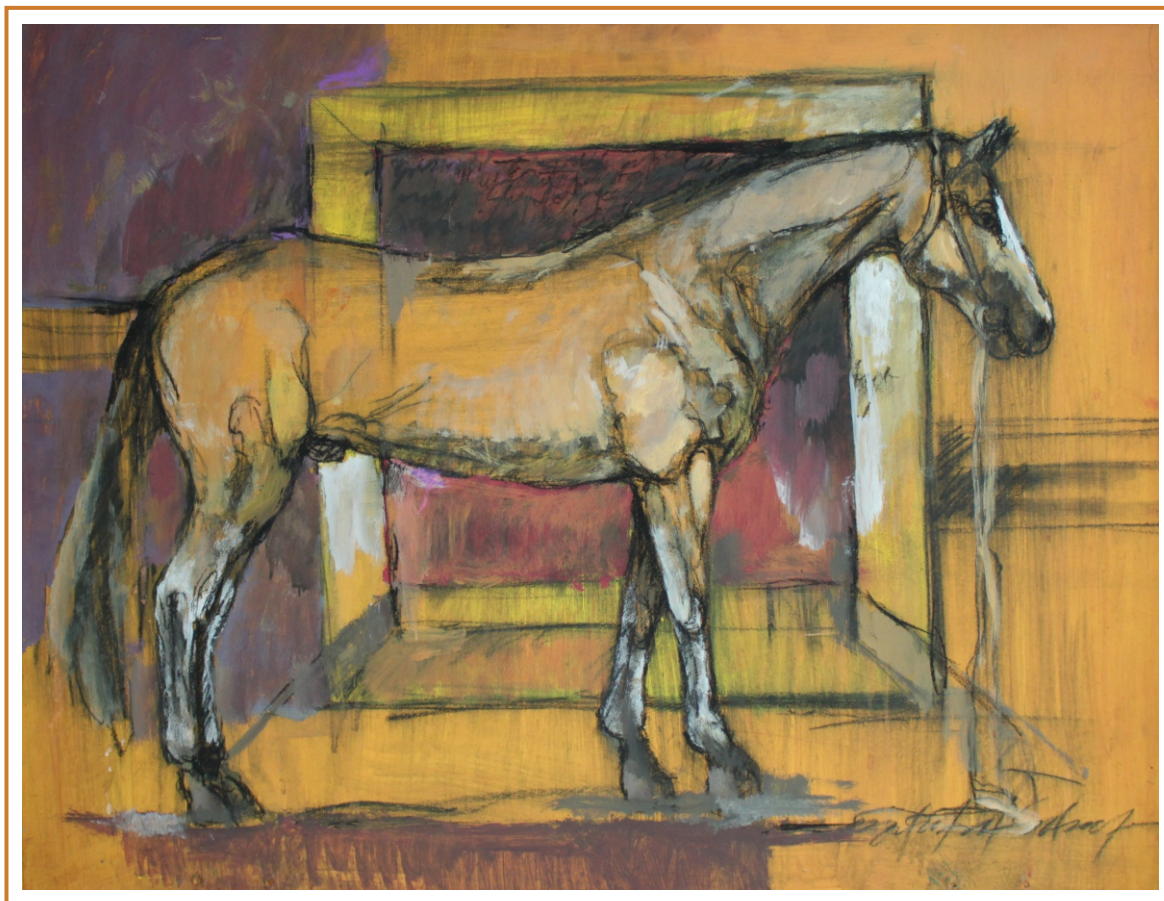
Odihnă tehnică mixtă pe carton, 65/83 cm