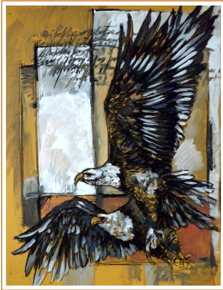
Lecții de zbor II, 2018 tehnică mixtă pe carton, 75/60 cm