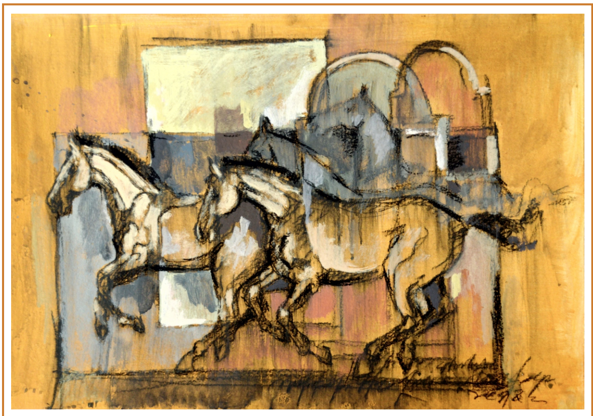
Vis cu cai, 2018 tehnică mixtă pe carton, 50/70 cm