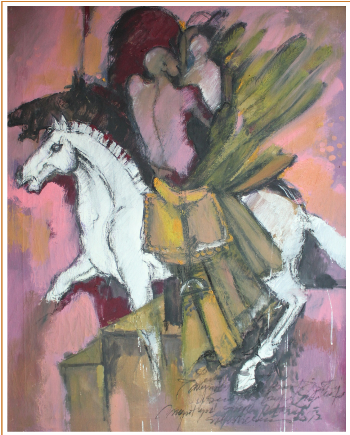
Pretext cromatic, 2017 ulei pe pânză, 102/82 cm