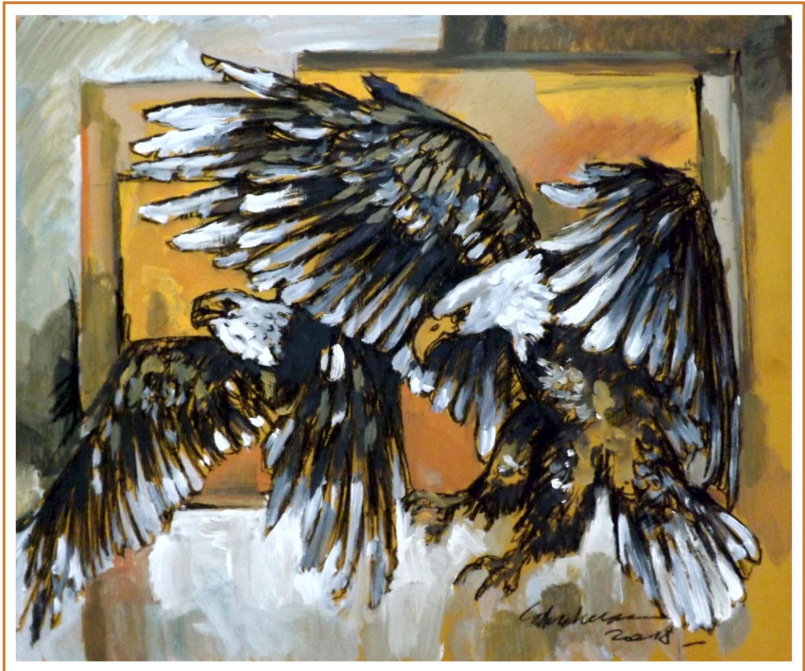
Lecții de zbor I, 2018 tehnică mixtă pe carton, 80/60 cm