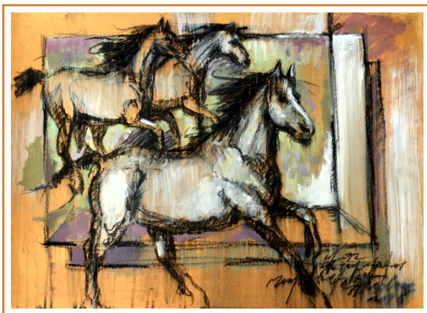
Compoziție cu cai, 2018 tehnică mixtă pe carton, 50/70 cm