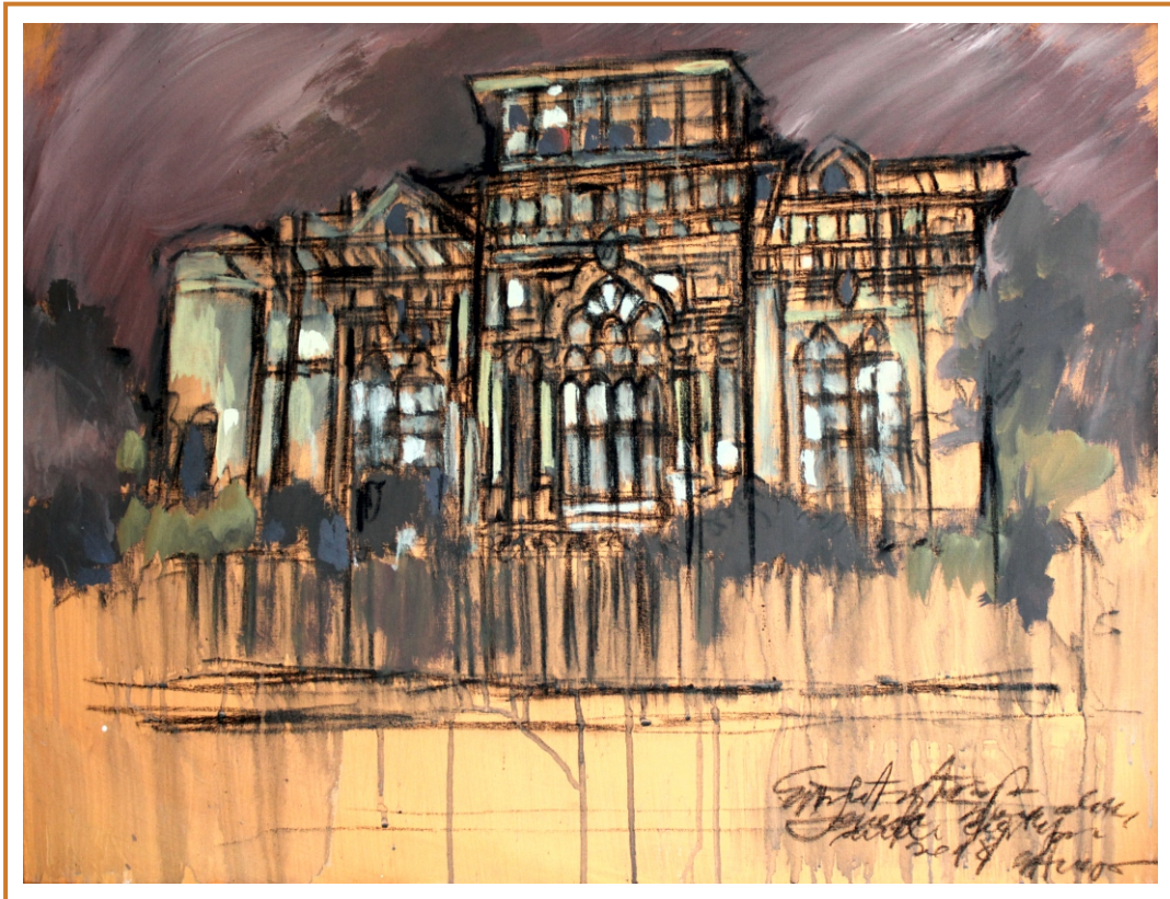
Udriște nr. 11, 2018 tehnică mixtă pe carton, 65/83 cm