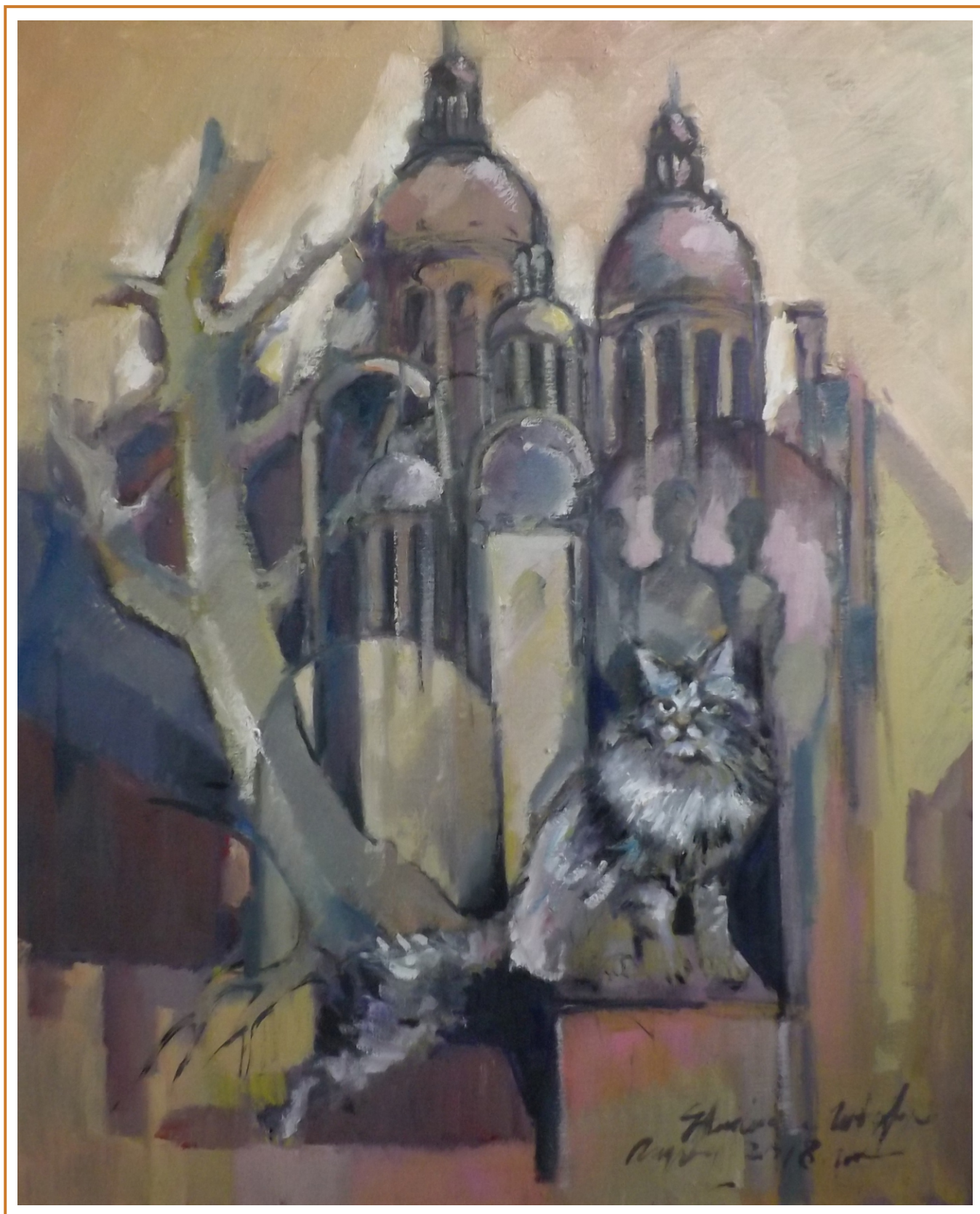
Amintiri, 2018 ulei pe pânză, 108/98 cm