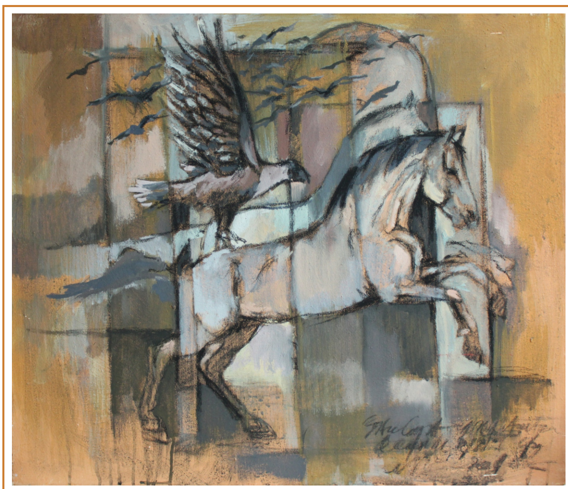
Lecția de zbor II, 2018 tehnică mixtă pe pânză, 65/80 cm