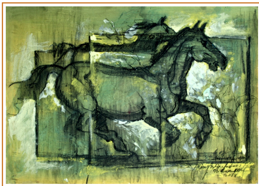
Caii verzi, 2018 tehnică mixtă pe carton, 50/70 cm