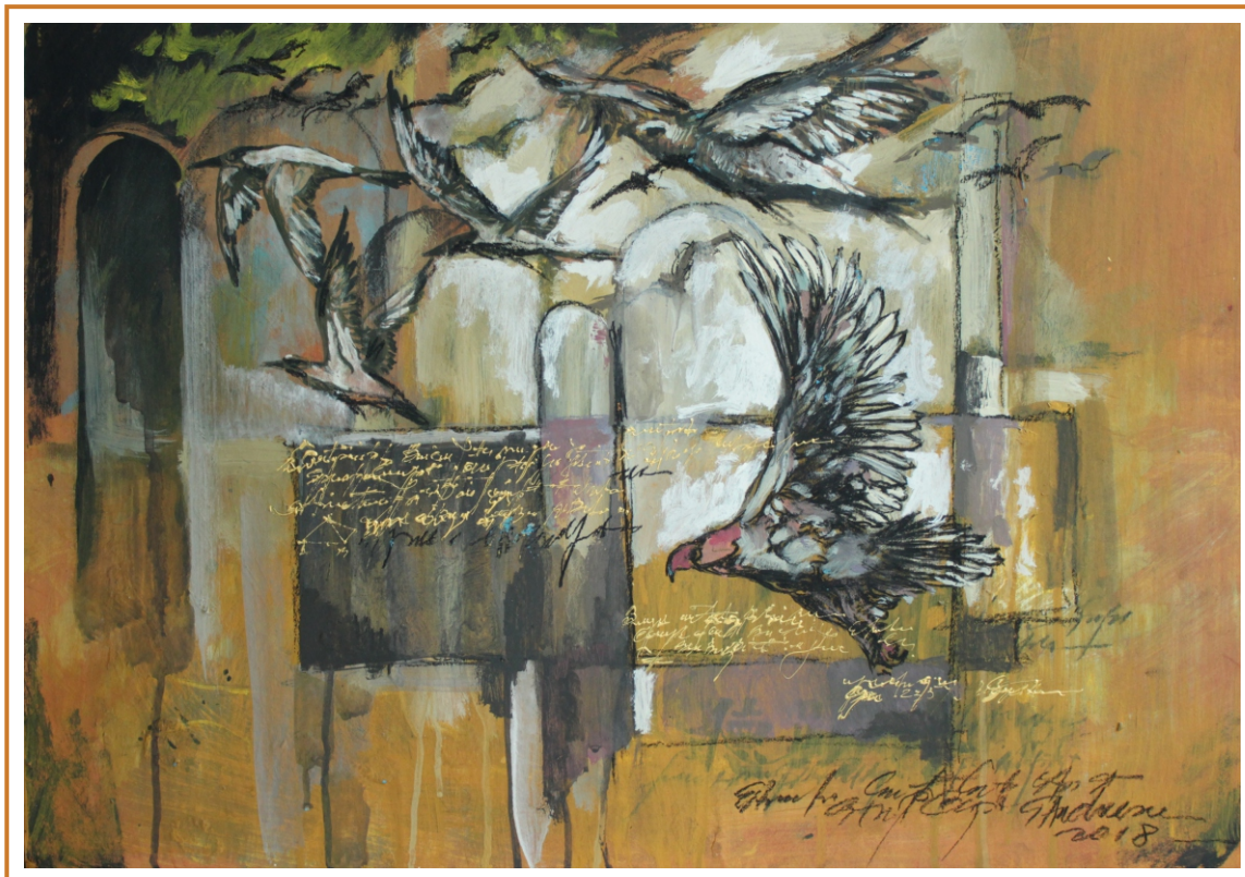
Lecția de zbor, 2018 tehnică mixtă pe carton, 50/70 cm