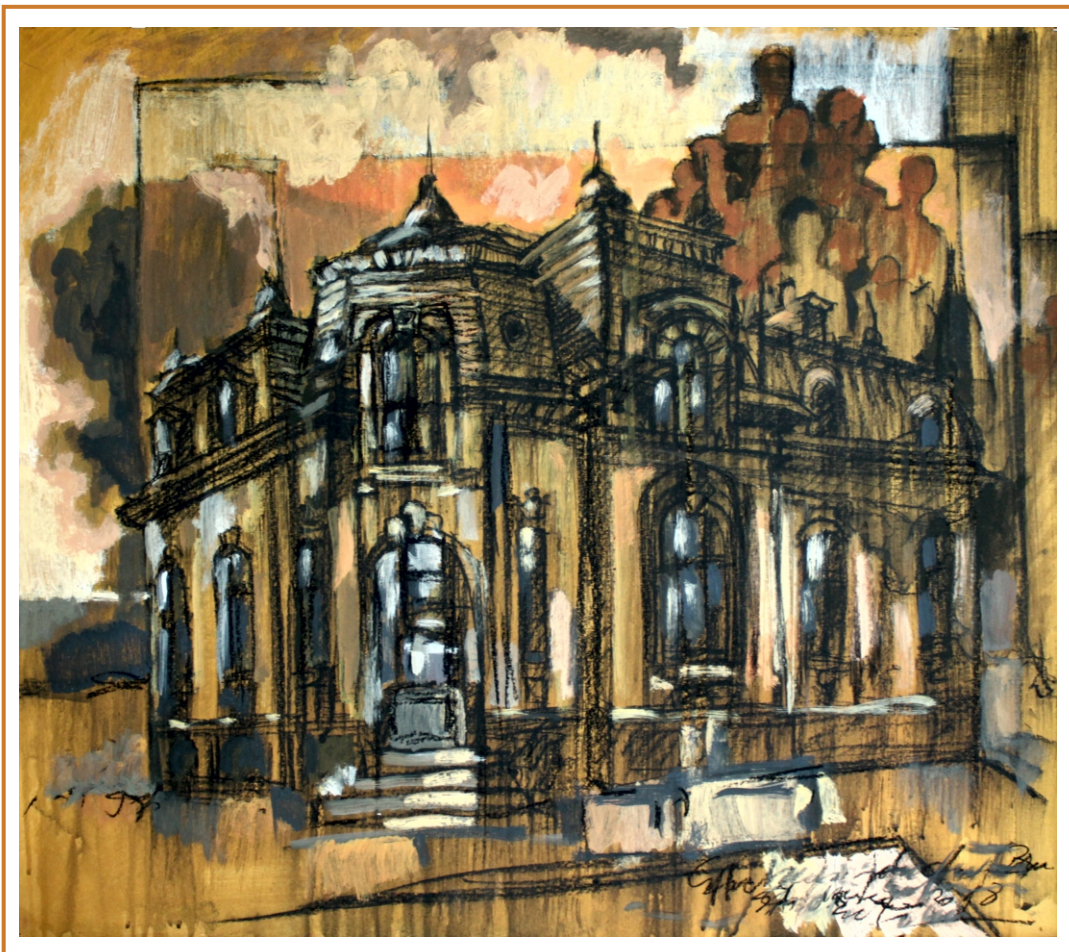
Amintiri din cartierul de vest, 2018 tehnică mixtă pe carton cu pânză, 80/85 cm