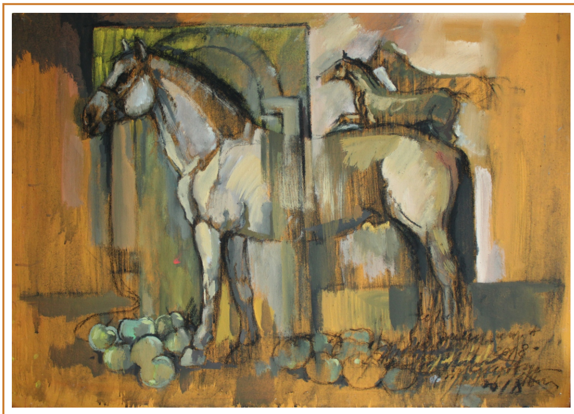
Mere verzi, 2018 tehnică mixtă pe carton, 70/100 cm