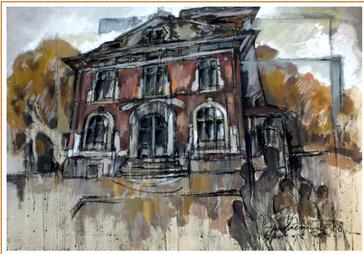
Case din cartierul de vest II, 2018 tehnică mixtă pe pânză, 75/110 cm