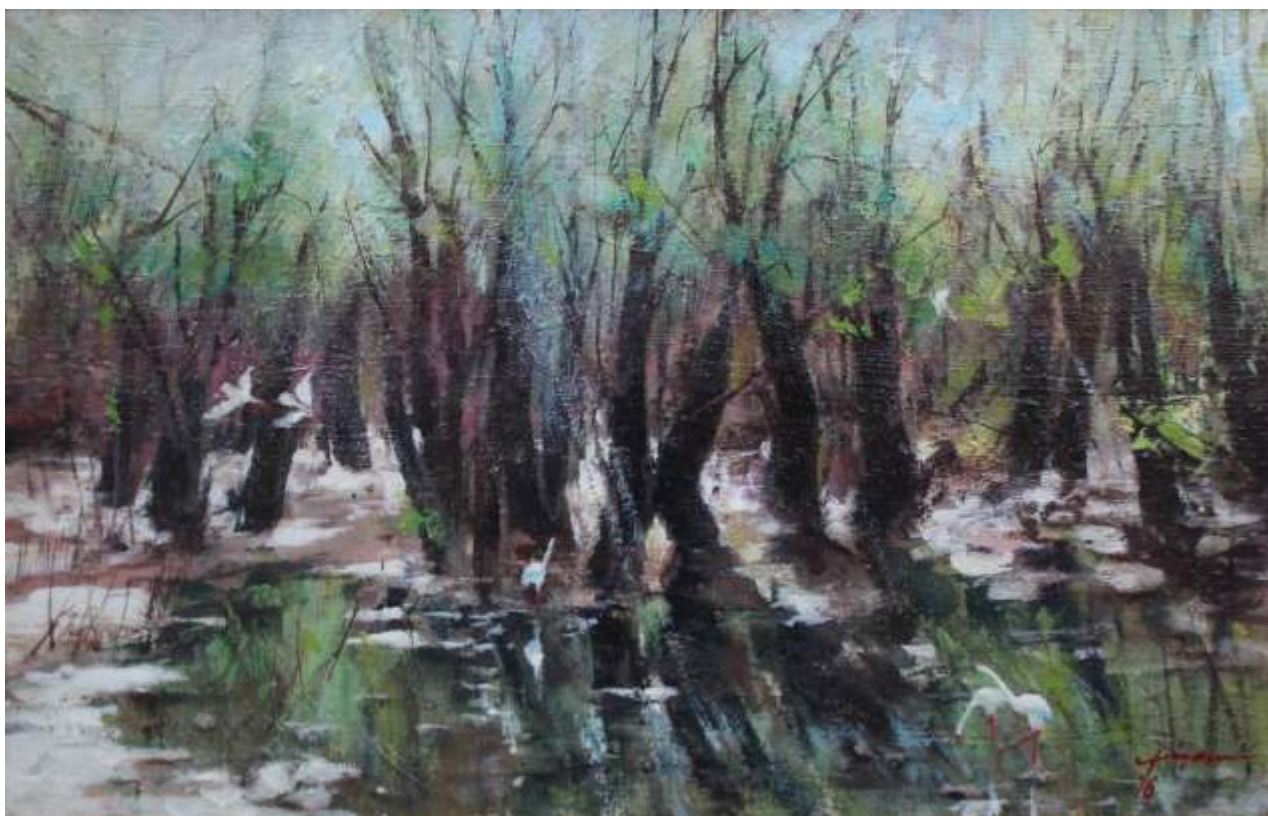
Peisaj lacustru, 2016 ulei pe pânză, 45/70 cm