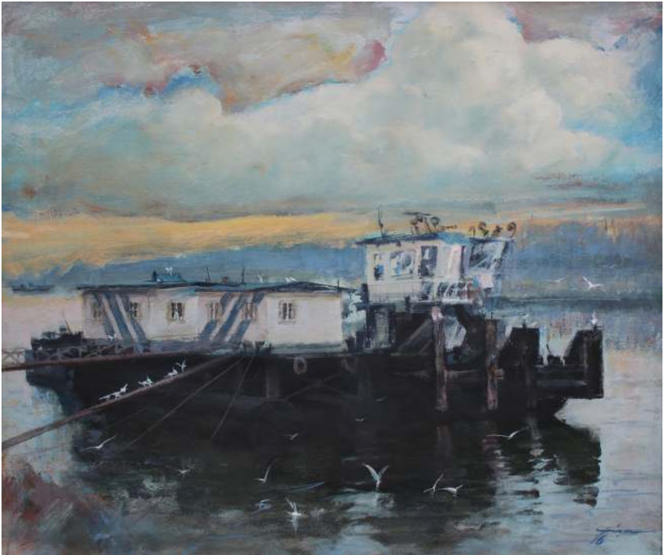
Împingătoare și pontoane, 2016 acrilic pe pânză, 60/70 cm