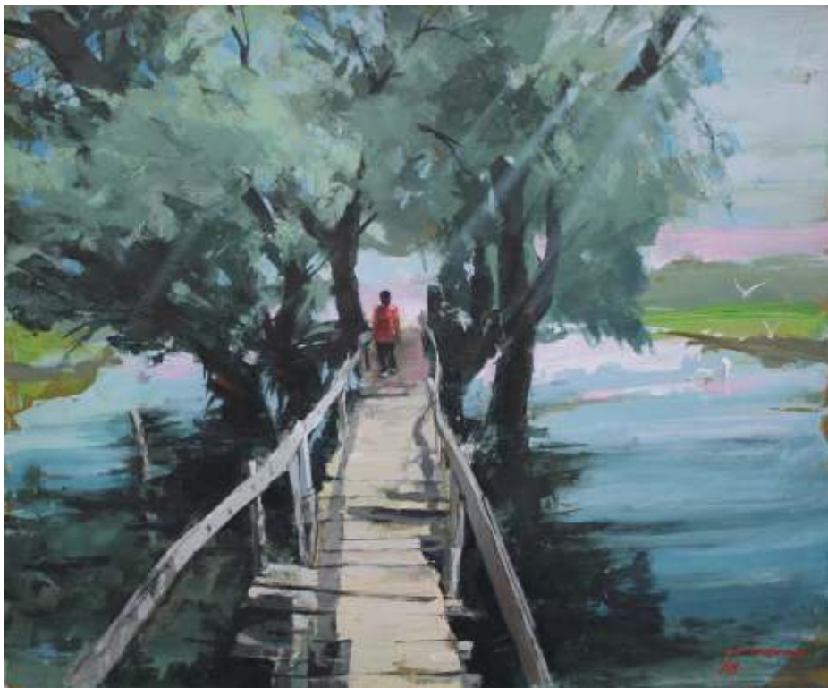
Peisaj în Deltă, 2016 acrilic pe pânză, 50/60 cm