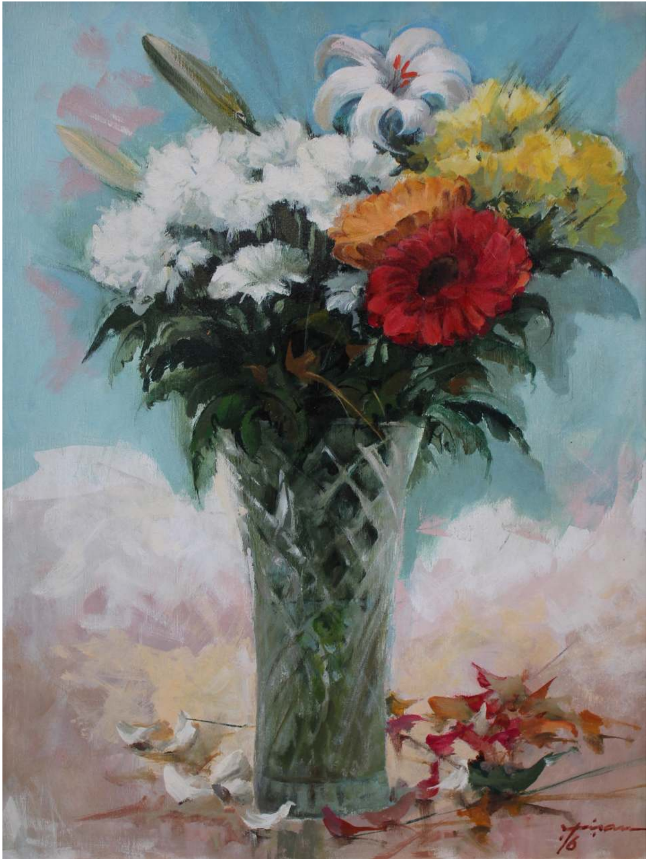
Buchetul de primăvară, 2016 acrilic pe pânză, 70/50 cm