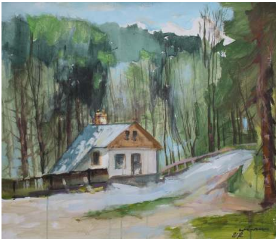
Peisaj la cota 1000 Sinaia, 2014 acrilic pe pânză, 60/70 cm