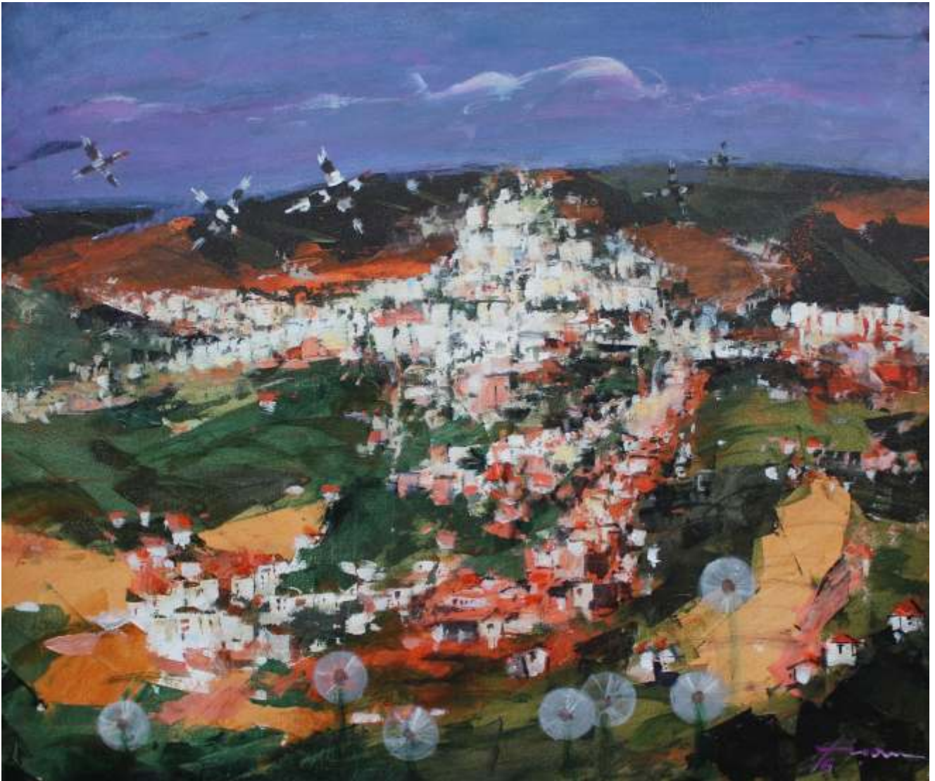
Panorama Iaşului, 2016 acrilic pe pânză, 60/70 cm