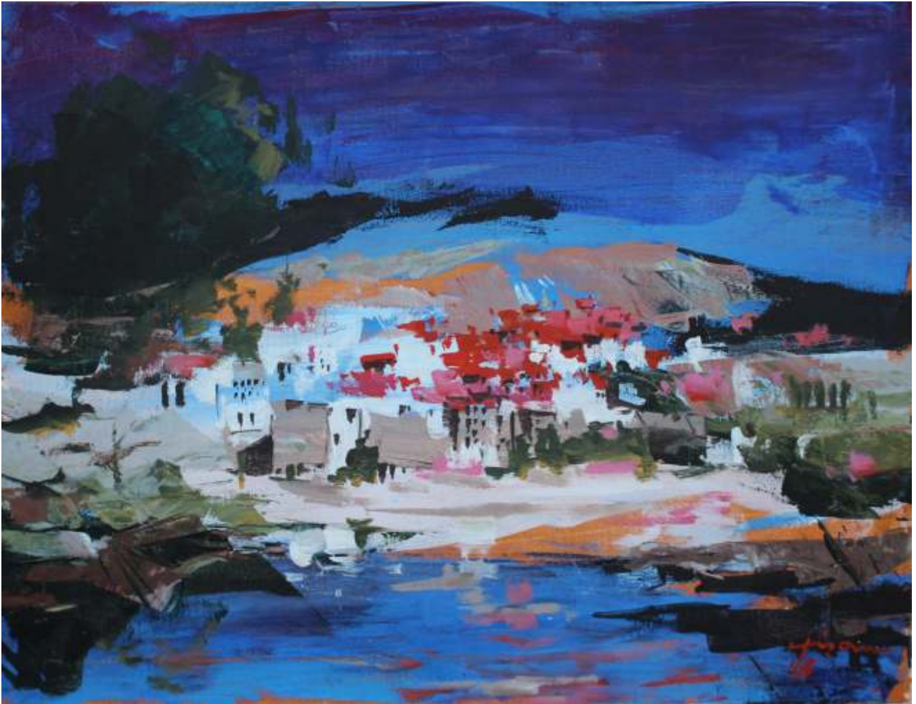
Golful de argint, 2016 acrilic pe pânză, 50/60 cm