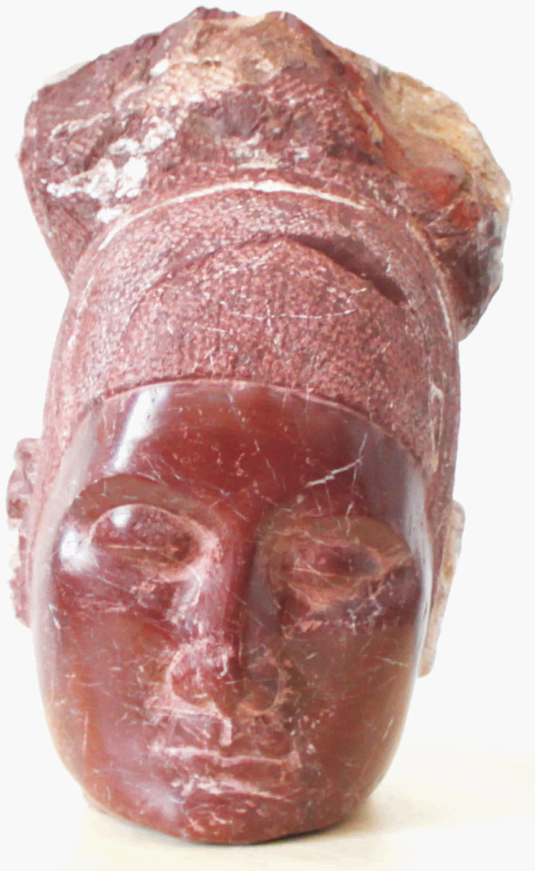
DUMITRU JURAVLE "Domnița Ralu" marmură 280 x 180 x 160 mm