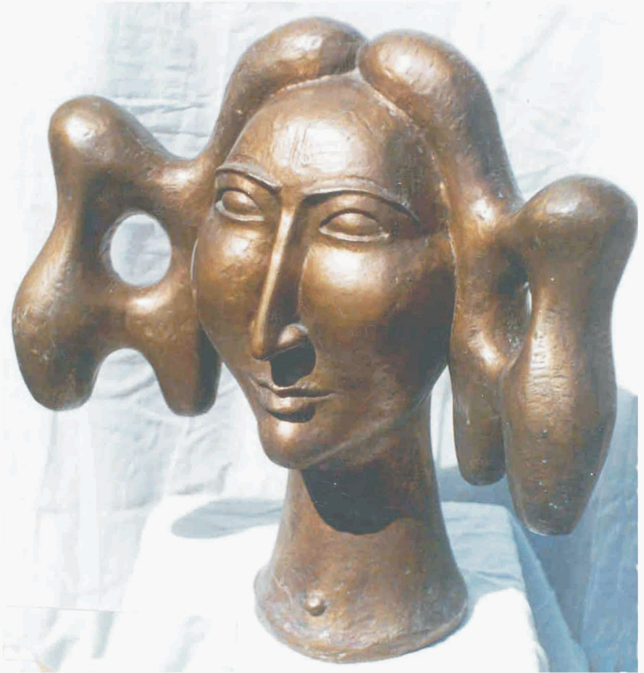
ION IRIMESCU, "Aranda", bronz, 530 x 530 x 280 mm