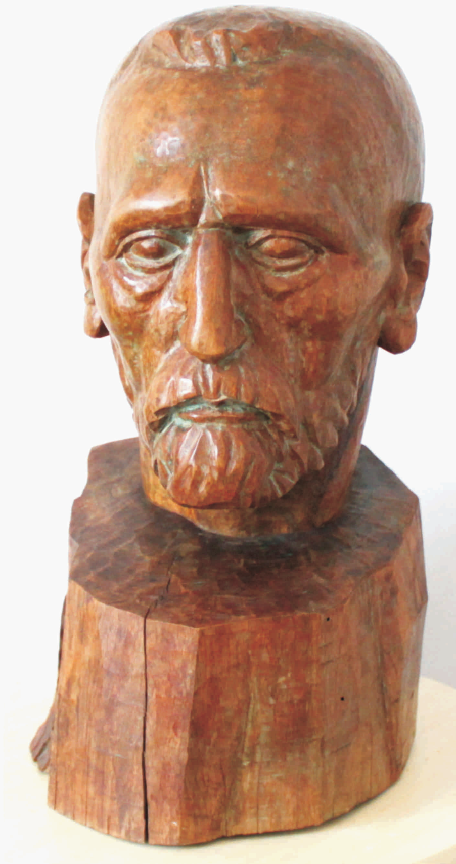
RADU AFTENIE "Van Gogh" lemn 450 x 220 x 270 mm