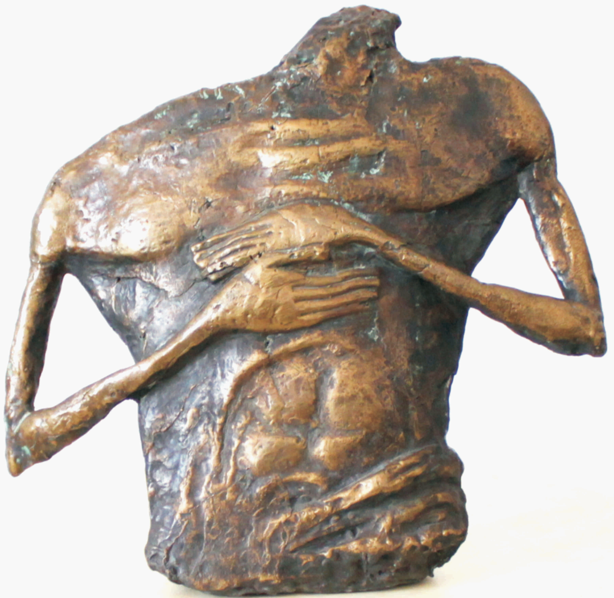
ALEXANDRU NANCU "Sacrificiu" bronz 265 x300 x 90 mm