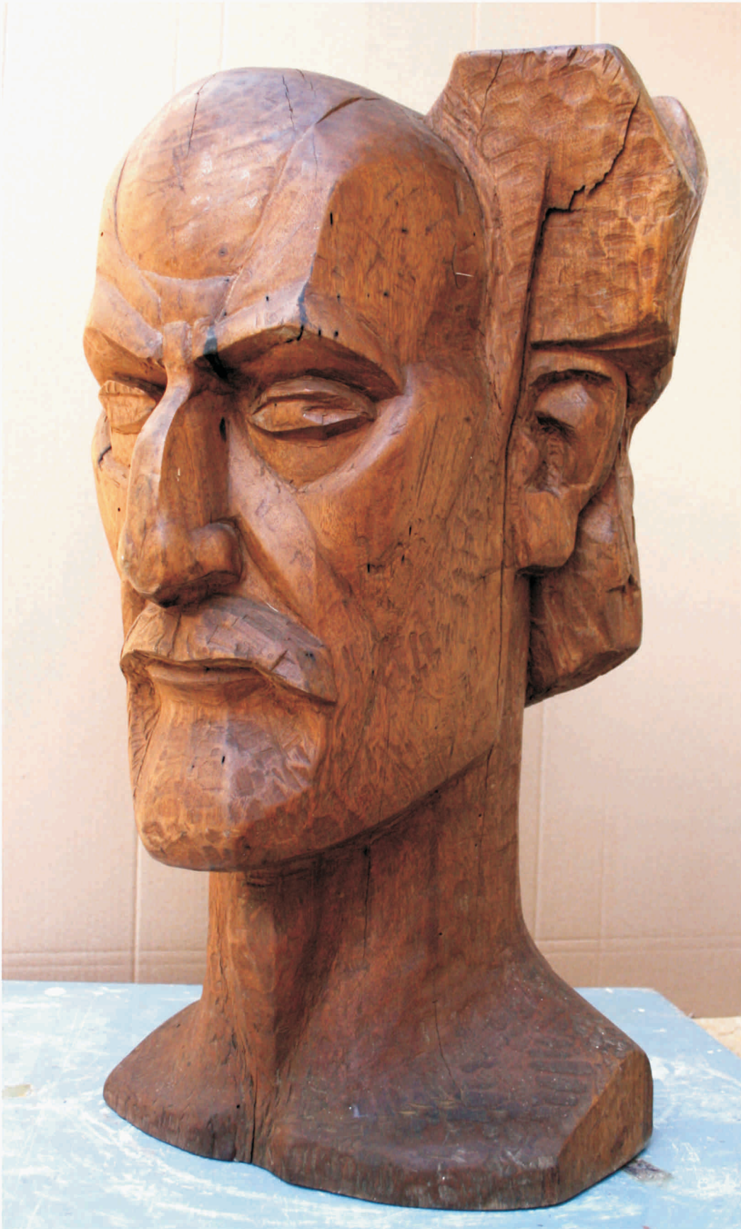
GHEORGHE TURCU "Theodor Pallady" lemn 730 x 550 x 400 mm