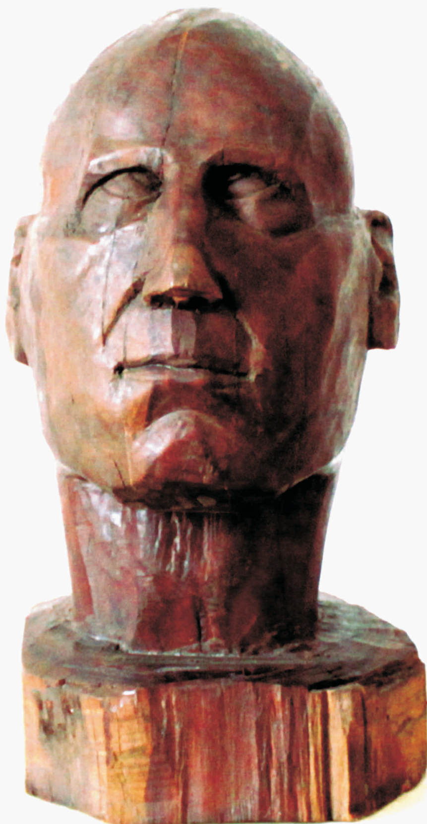
ADRIAN POPOVICI "Portret" lemn 320 x 200 x 200 mm