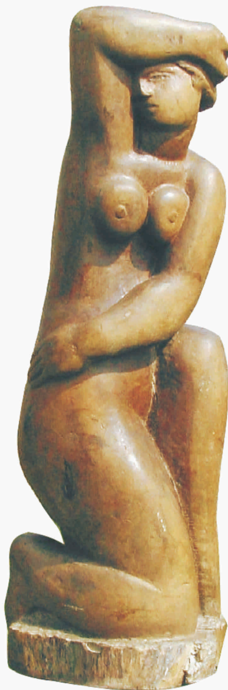
GEORGE APOSTU "Nud" lemn 1250 x 400 x 400 mm