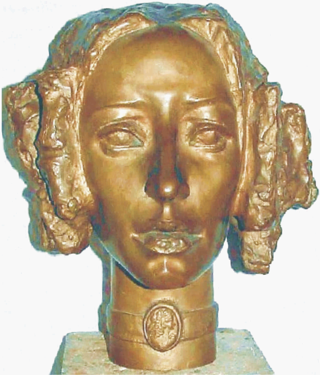
IULIA ONIȚĂ "Ana Ipătescu" bronz 280 x 290 x 310 mm