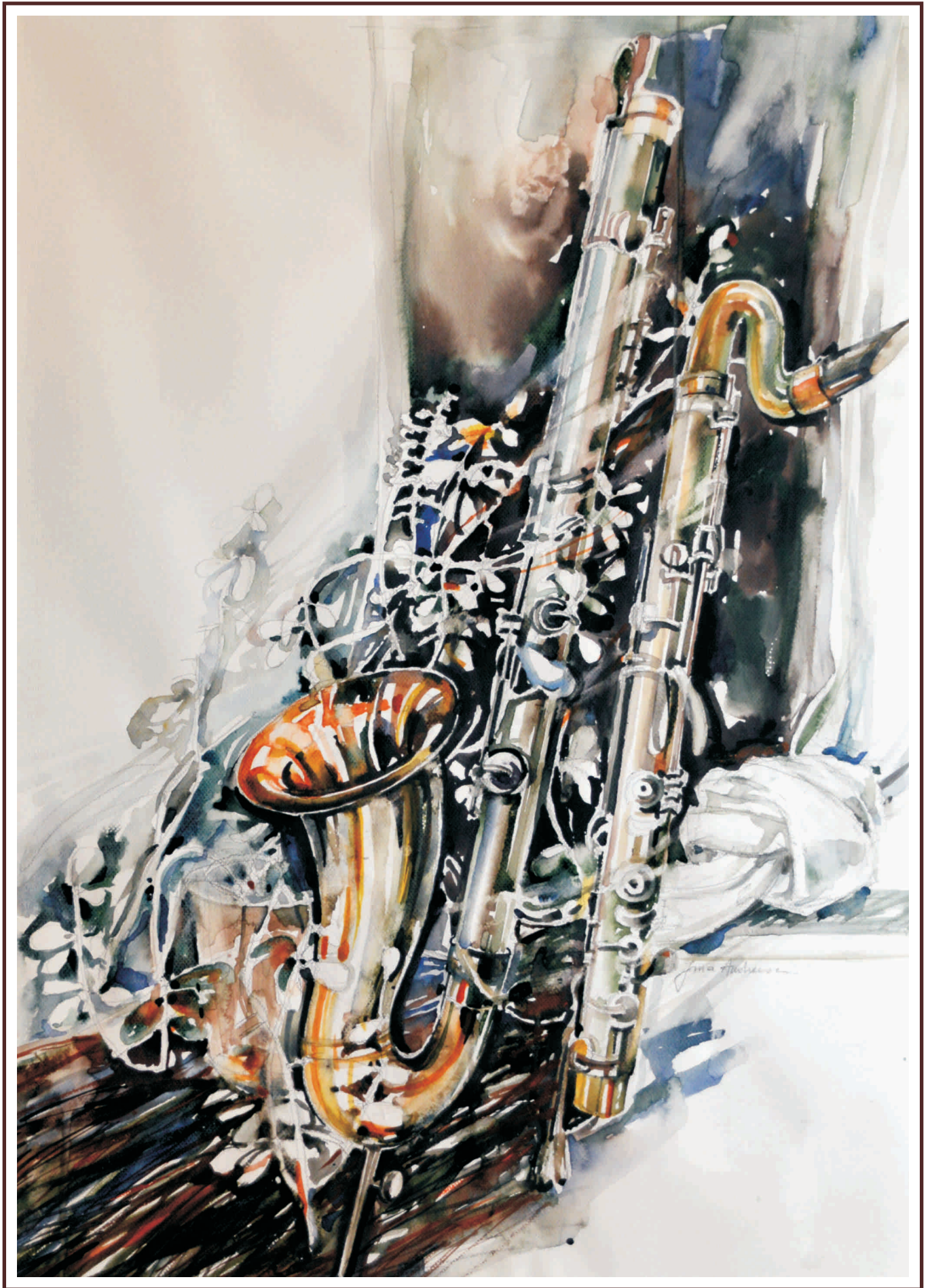
Jazz II, acuarelă, 70/50 cm