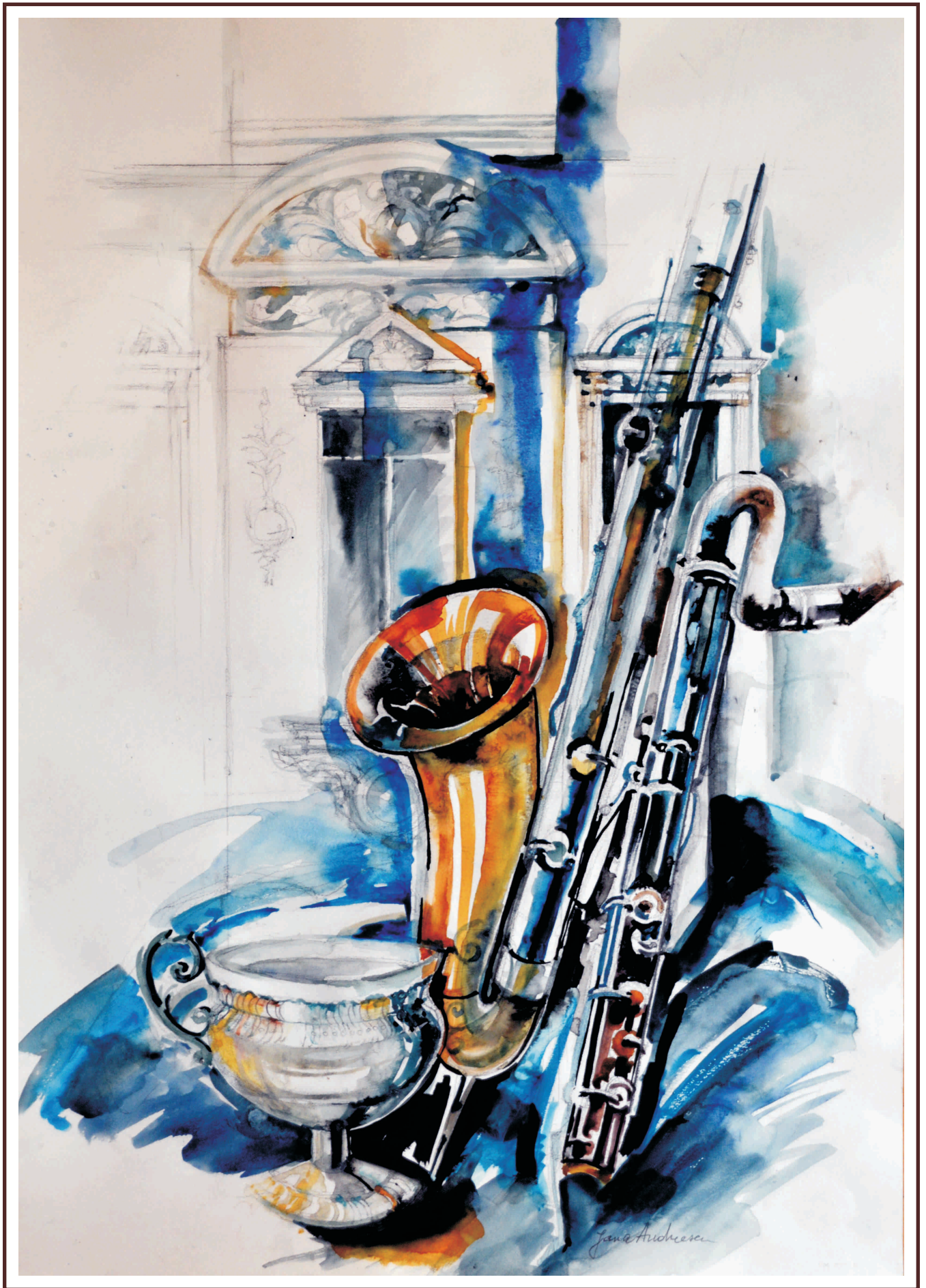
Jazz, acuarelă, 70/50 cm