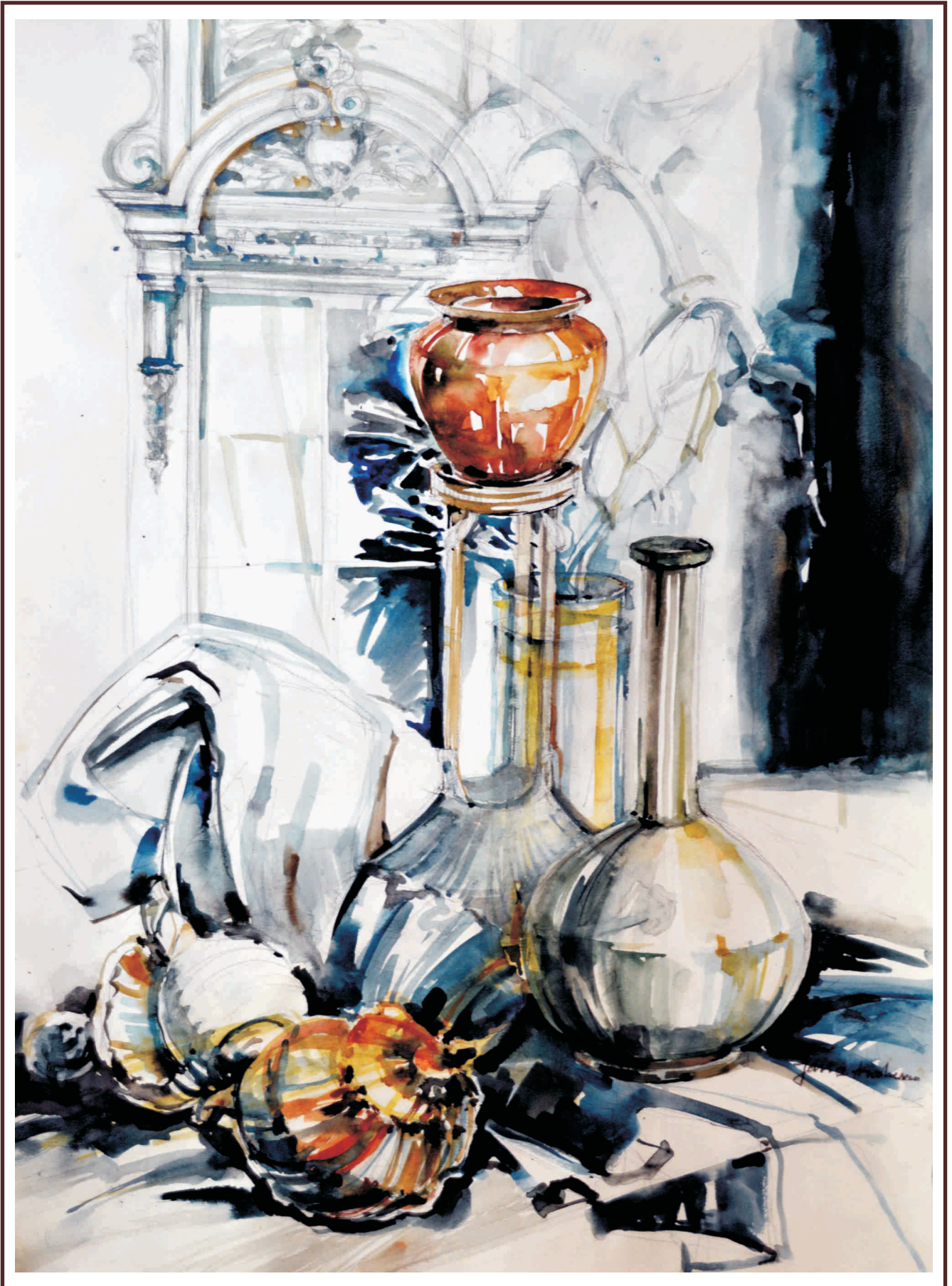
Interferențe IV, acuarelă, 70/50 cm