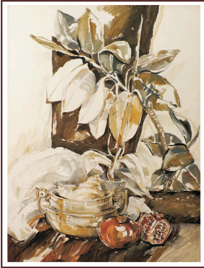
Timp, ulei pe pânză , 80/60 cm