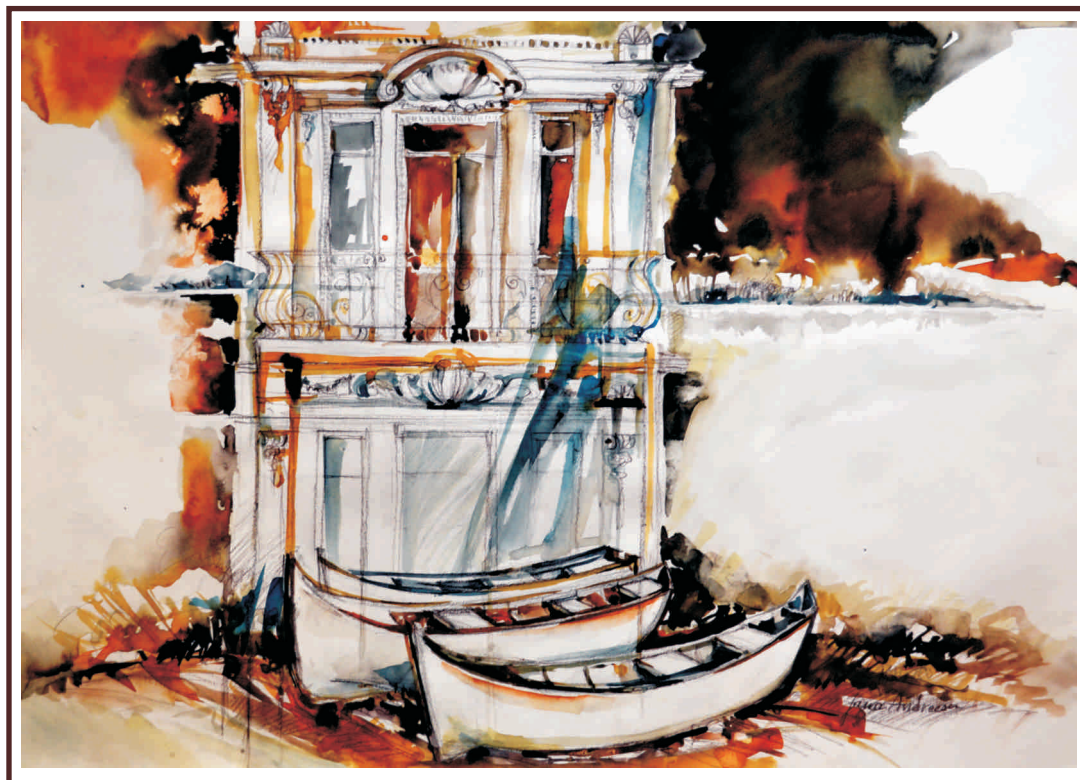
Danubiană II - acuarelă, 50/70 cm