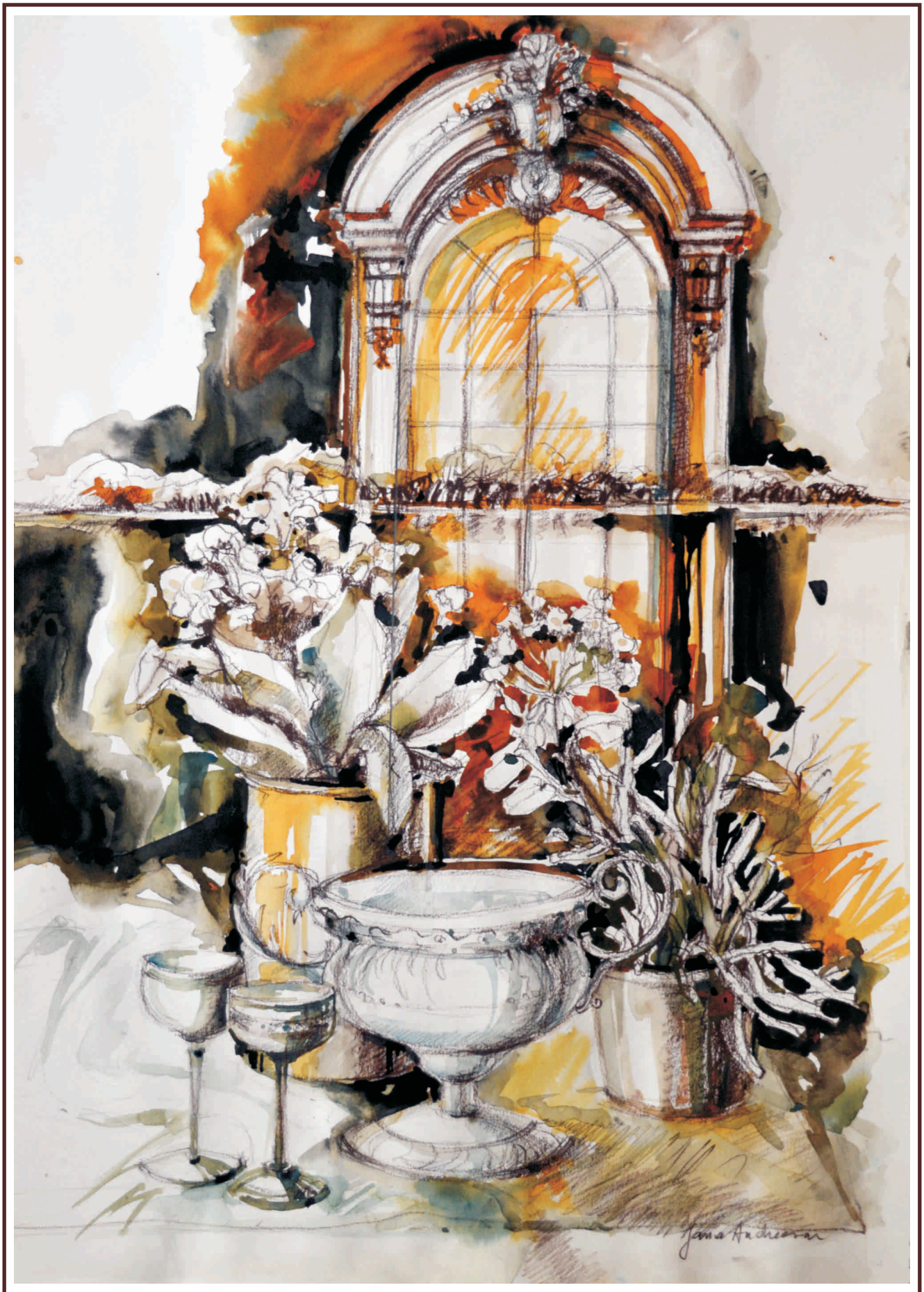
Danubiana III, acuarela, 70/50