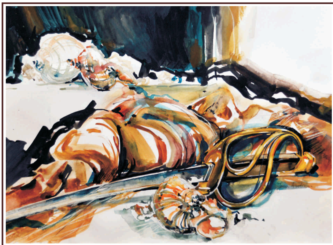
Marină I , acuarelă, 35/50 cm