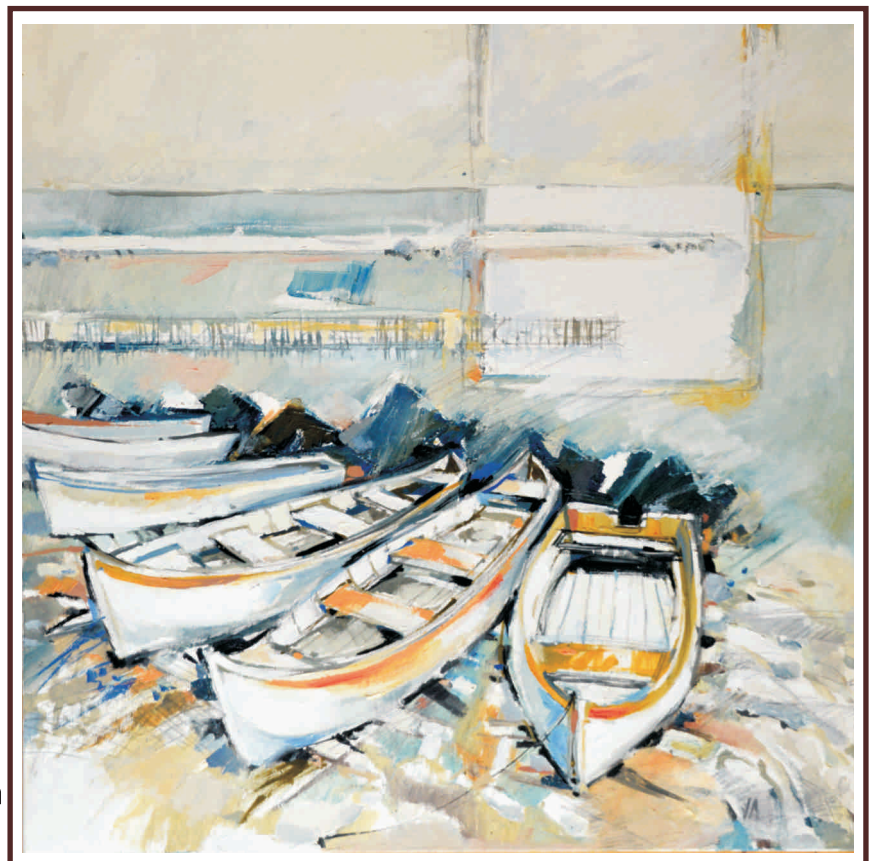
Marină II , ulei pe pânză 50/70 cm