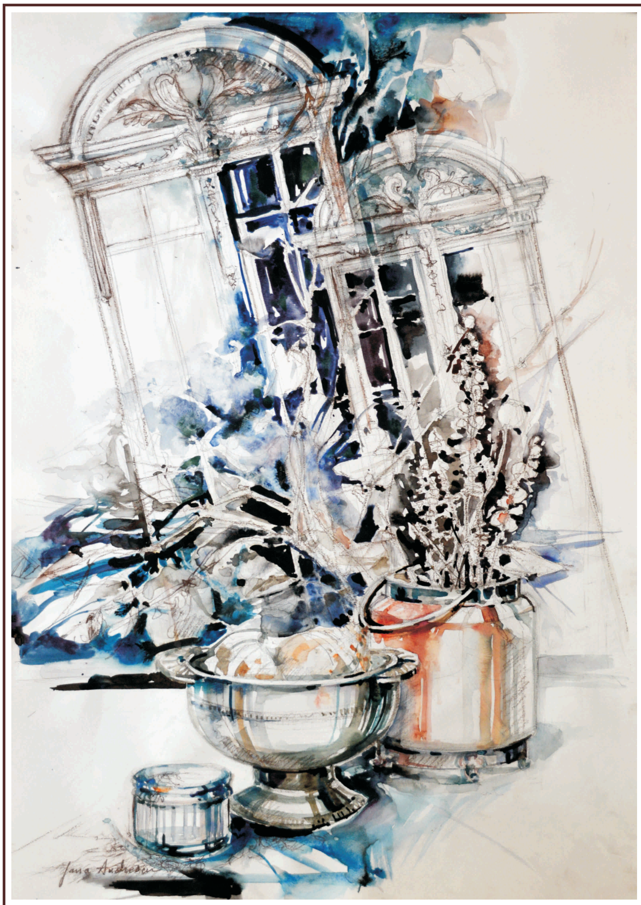
Interferențe II, acuarelă, 70/50 cm