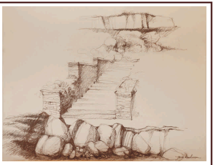
Desene, sepia, 50/70 cm