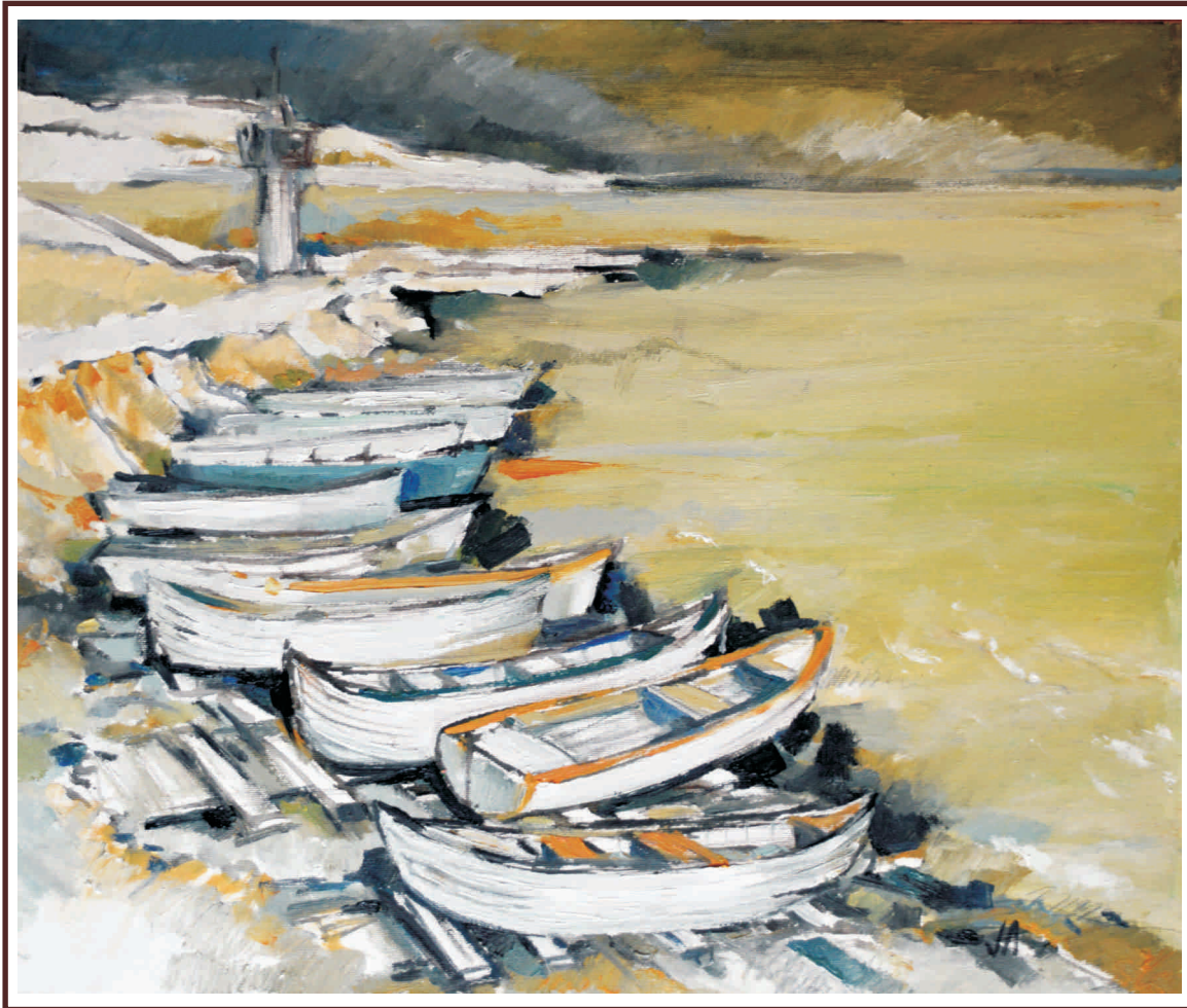
Marină I , ulei pe pânză, 70/50 cm