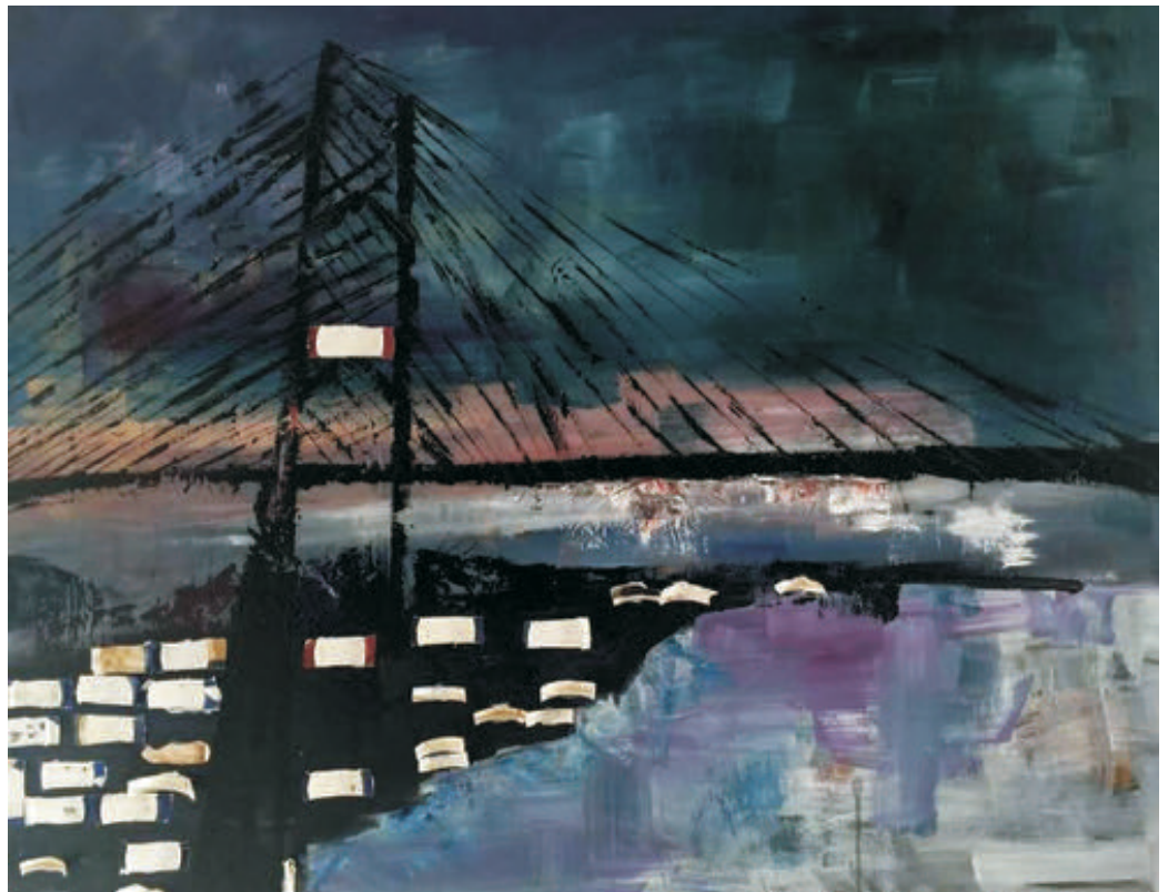
Crepuscul, 100/90 cm., tehnică mixtă/pânză, 2016 Twilight, 100/90 cm., mixed technique/canvas, 2016