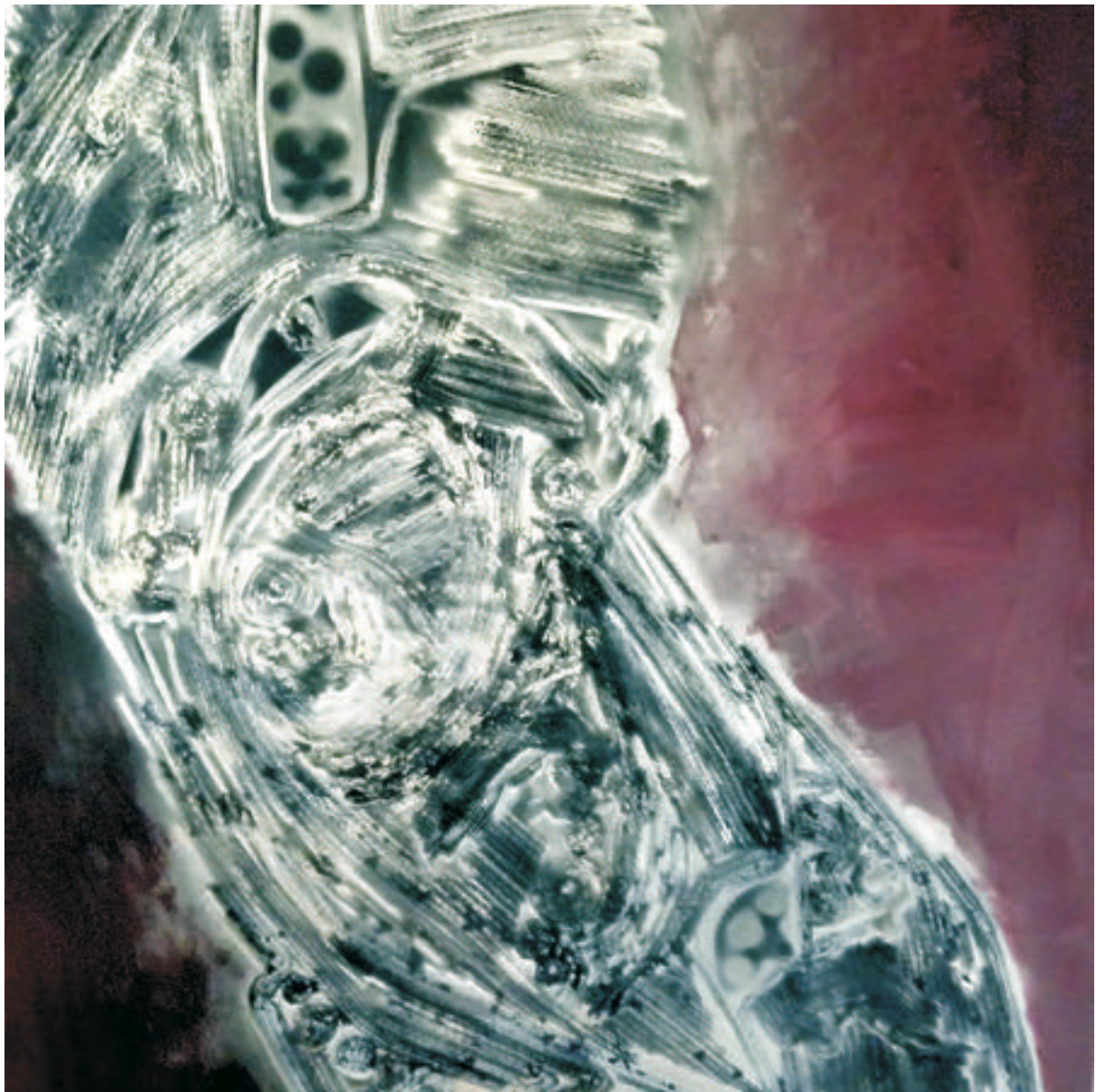
Tors, 90/110 cm., ulei/pânză, 2016 Torso, 90/110 cm., oil/canvas, 2016