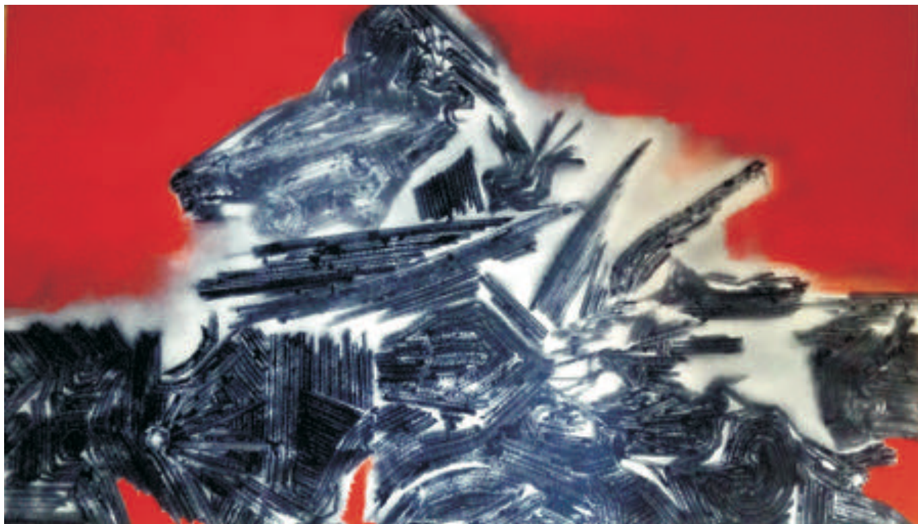
Apus, 120/70 cm, ulei /pânză, 2016 Sunset, 120/70 cm, oil/canvas, 2016