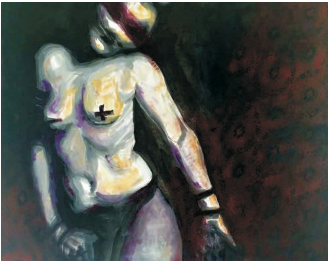
Autoportret, 100/90cm., tehnică mixtă/pânză, 2016 Self - portrait, 100/90cm., mixed technique/canvas, 2016