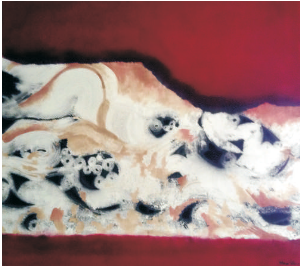
Bachanale, 100/90 cm., ulei/pânză, 2014 Bachanalia, 100/90 cm., oil/canvas, 2014