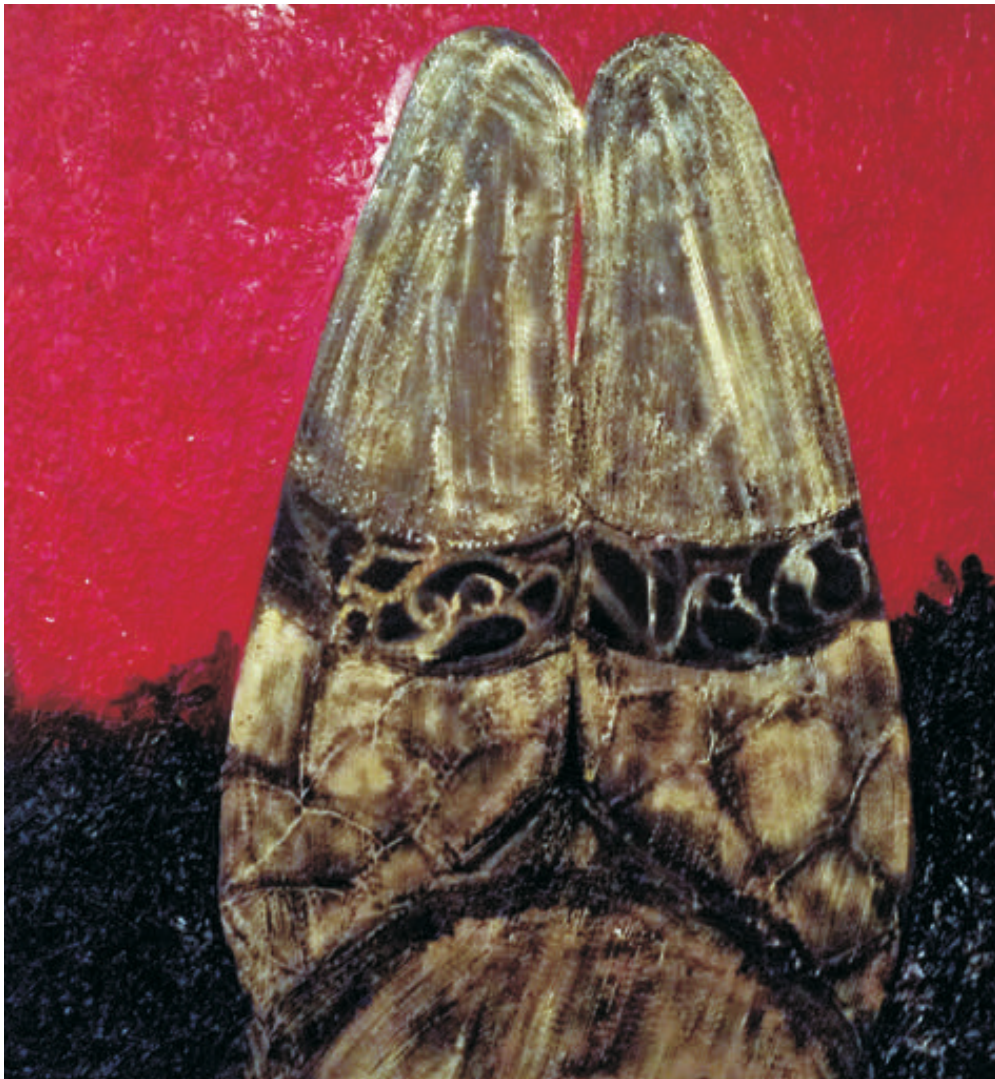
Ispită, 90/100 cm., tehnică mixtă/pânză, 2014 Temptation, 90/100 cm., mixed technique/canvas, 2014