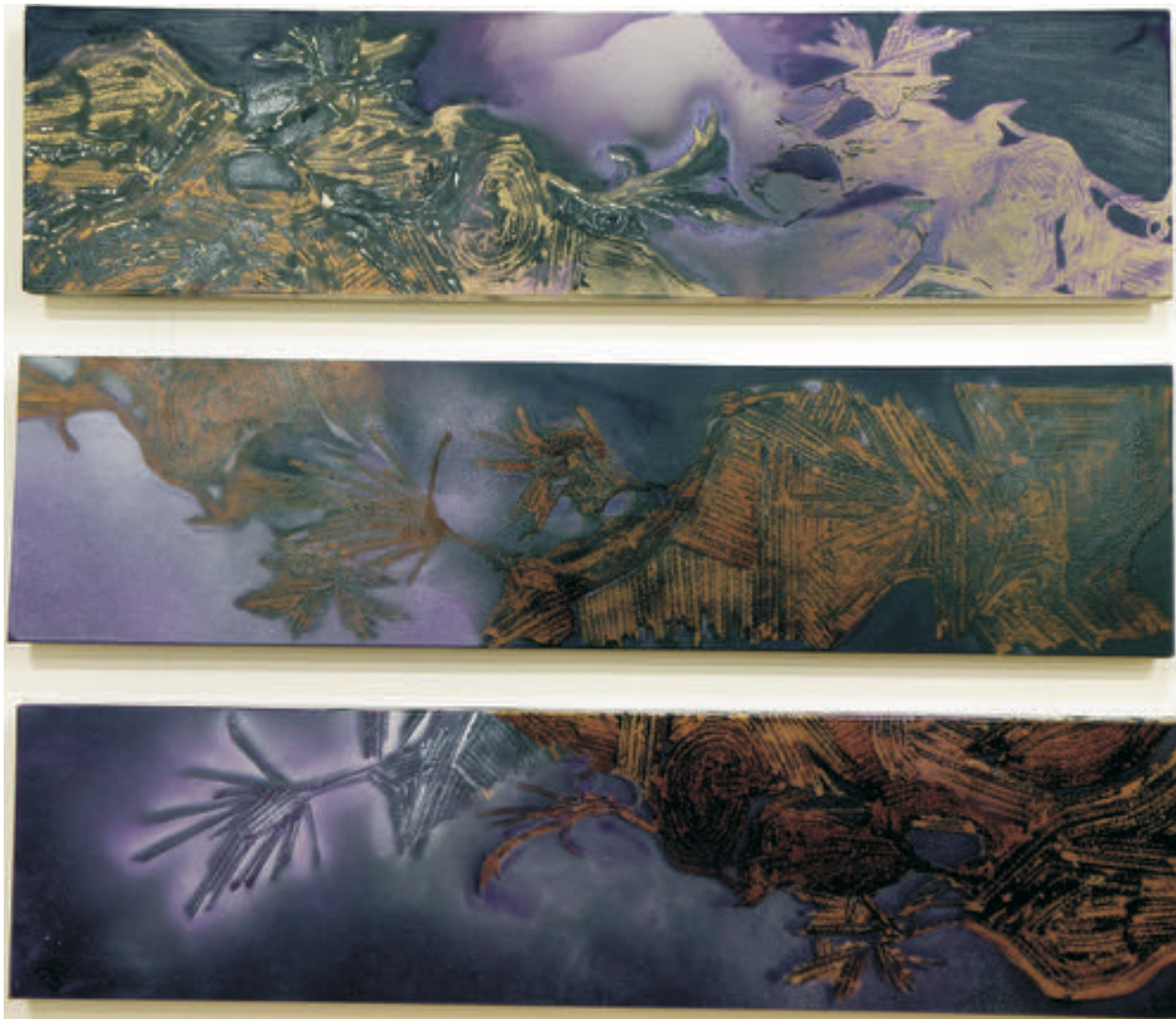
Noapte violet, 120/90 cm., ulei/pânză, 2016 Purple night, 120/90 cm., oil/canvas, 2016