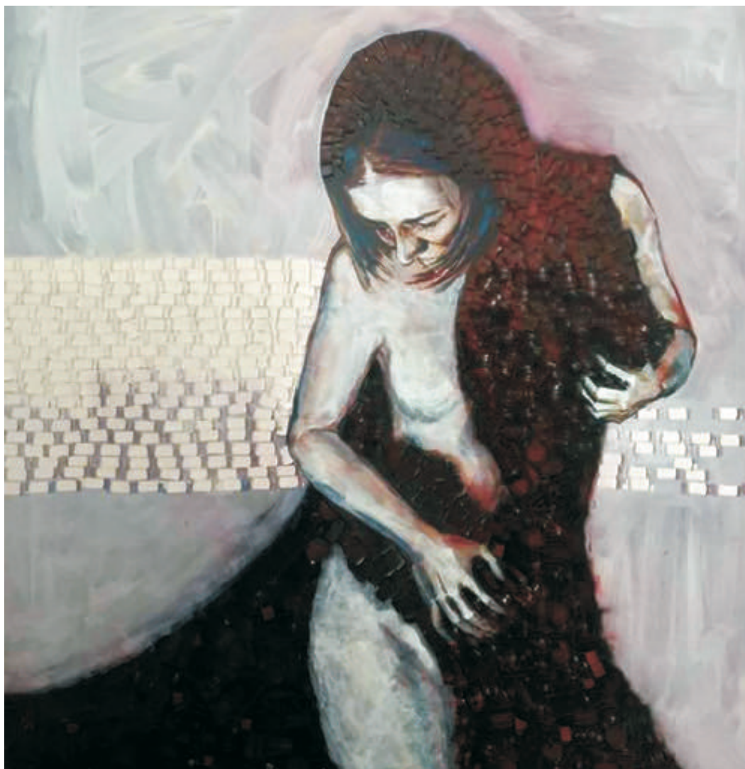
Autoportret, 170/180 cm., tehnică mixtă/PFL, 2016 Self - portrait, 170/180 cm., mixed technique/canvas, 2016