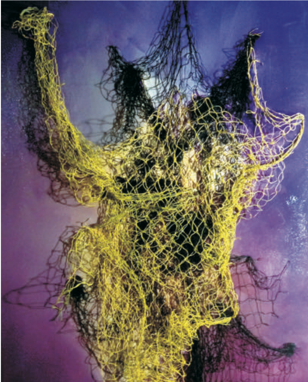
Dansul umbrelor, 90/140 cm., tehnică mixtă/pânză, 2016 Dance of shadows, 90/140 cm., mixt tehnică/canvas, 2016