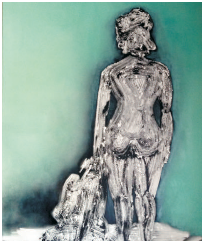
Așteptare, 80/100 cm., ulei/pânză, 2016