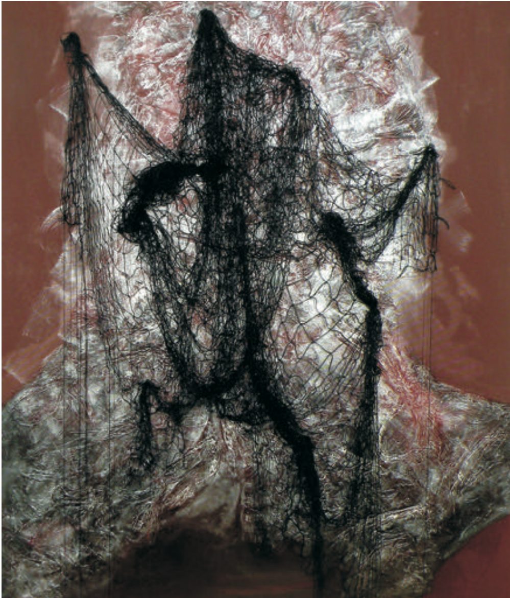
Melancolie, 100/120 cm., tehnică mixtă/pânză, 2016 Melancholy, 100/120 cm., mixt tehnică/canvas, 2016