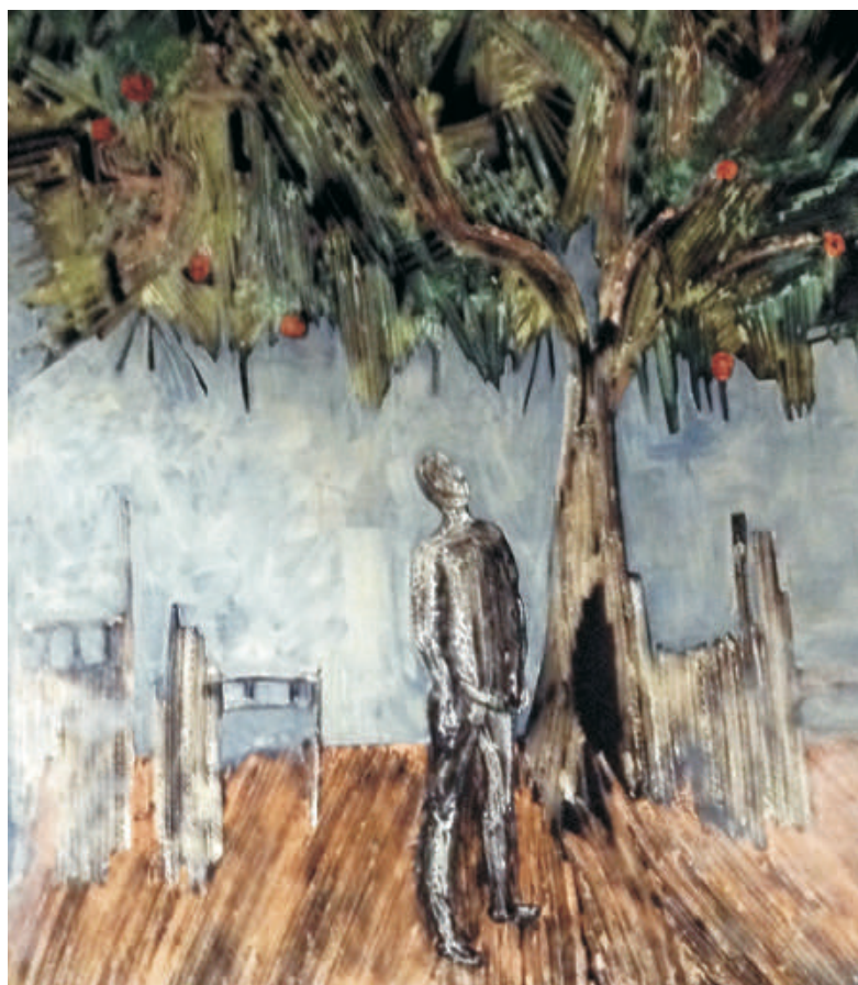
Tree nr.1, 80/110 cm., oil/canvas, 2016