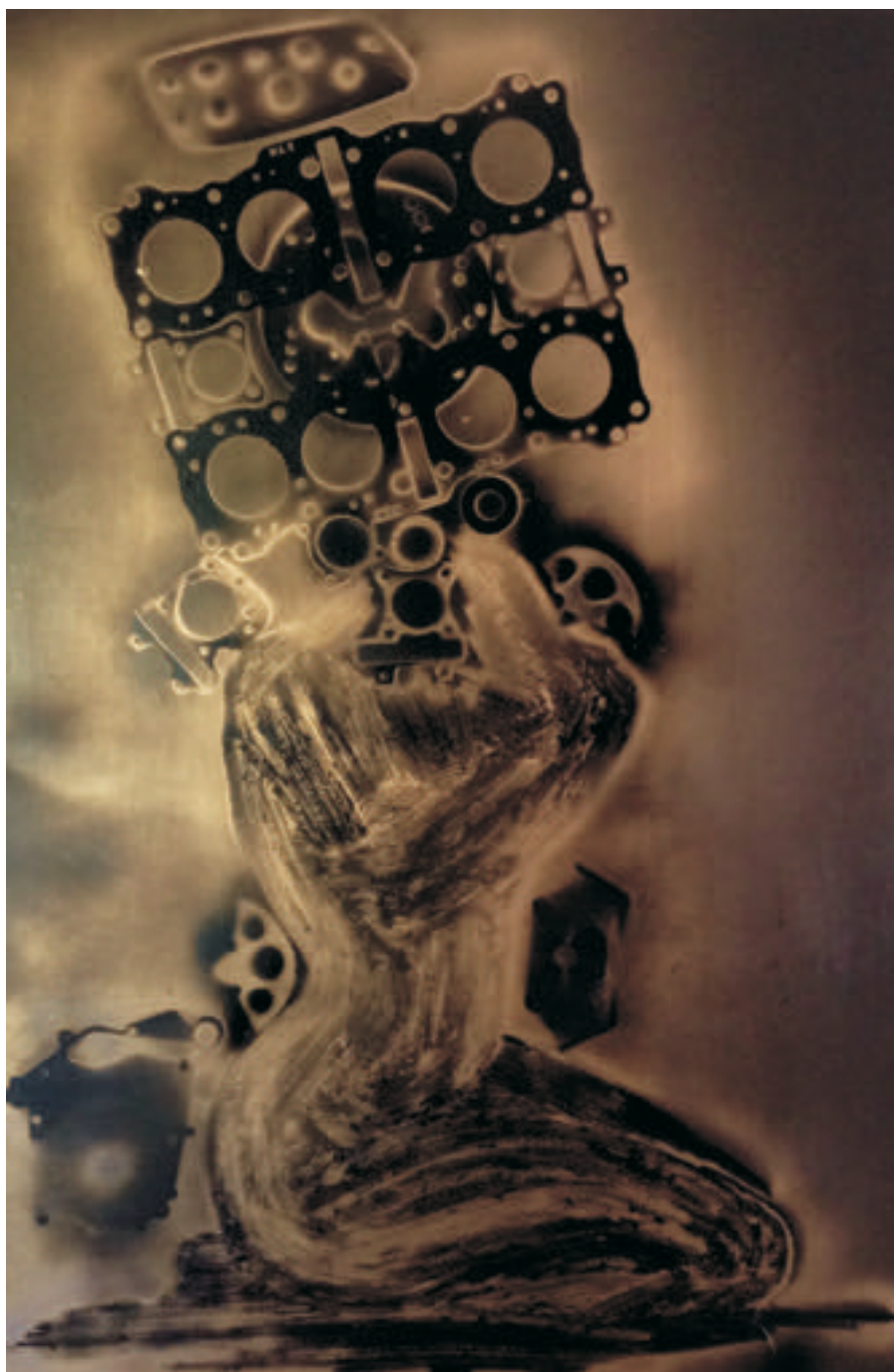
Autoportret, 80/120 cm., ulei/pânză, 2016 Self - portrait, 80/120 cm., oil/canvas, 2016