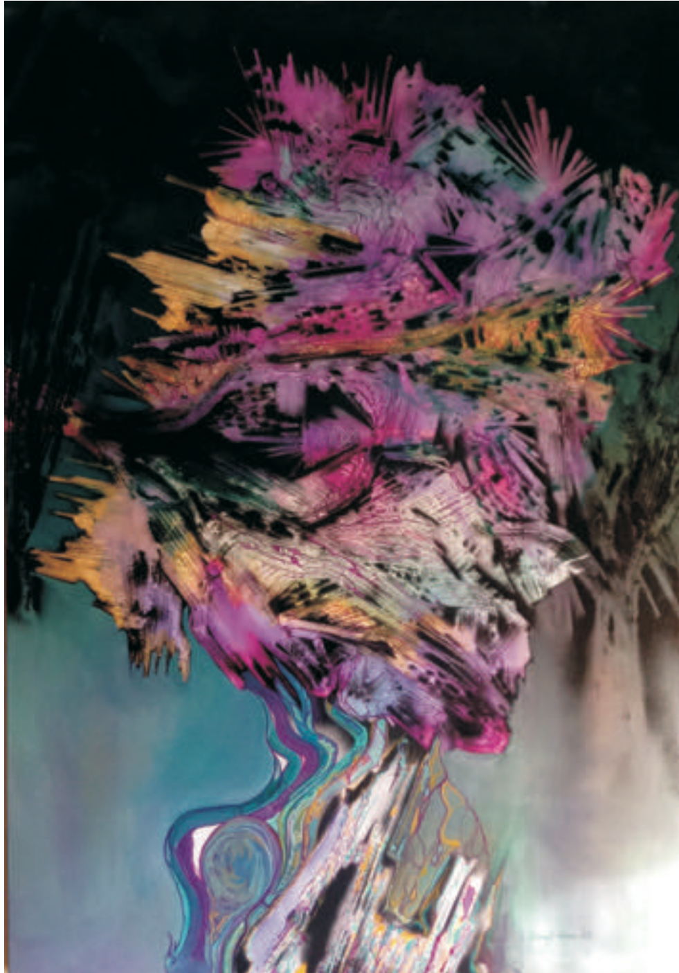
Electric Heart, 90/140 cm., tehnică mixtă/pânză , 2016 Electric Heart, 90/140 cm., mixt tehnică/canvas , 2016