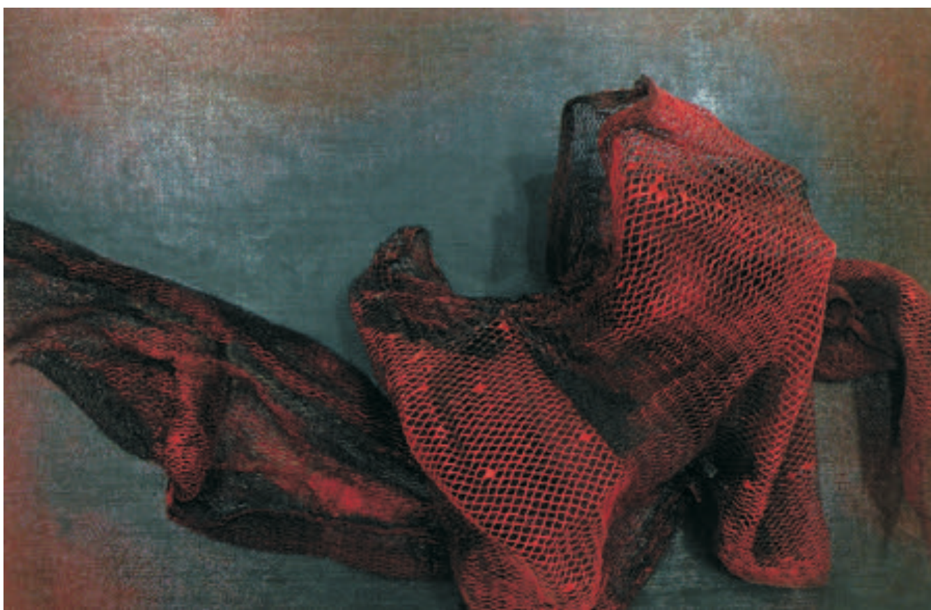
Foc de iubire, 80/50 cm., tehnică mixtă/pânză, 2016 Fire of love, 80/50 cm., mixed technique/canvas, 2016