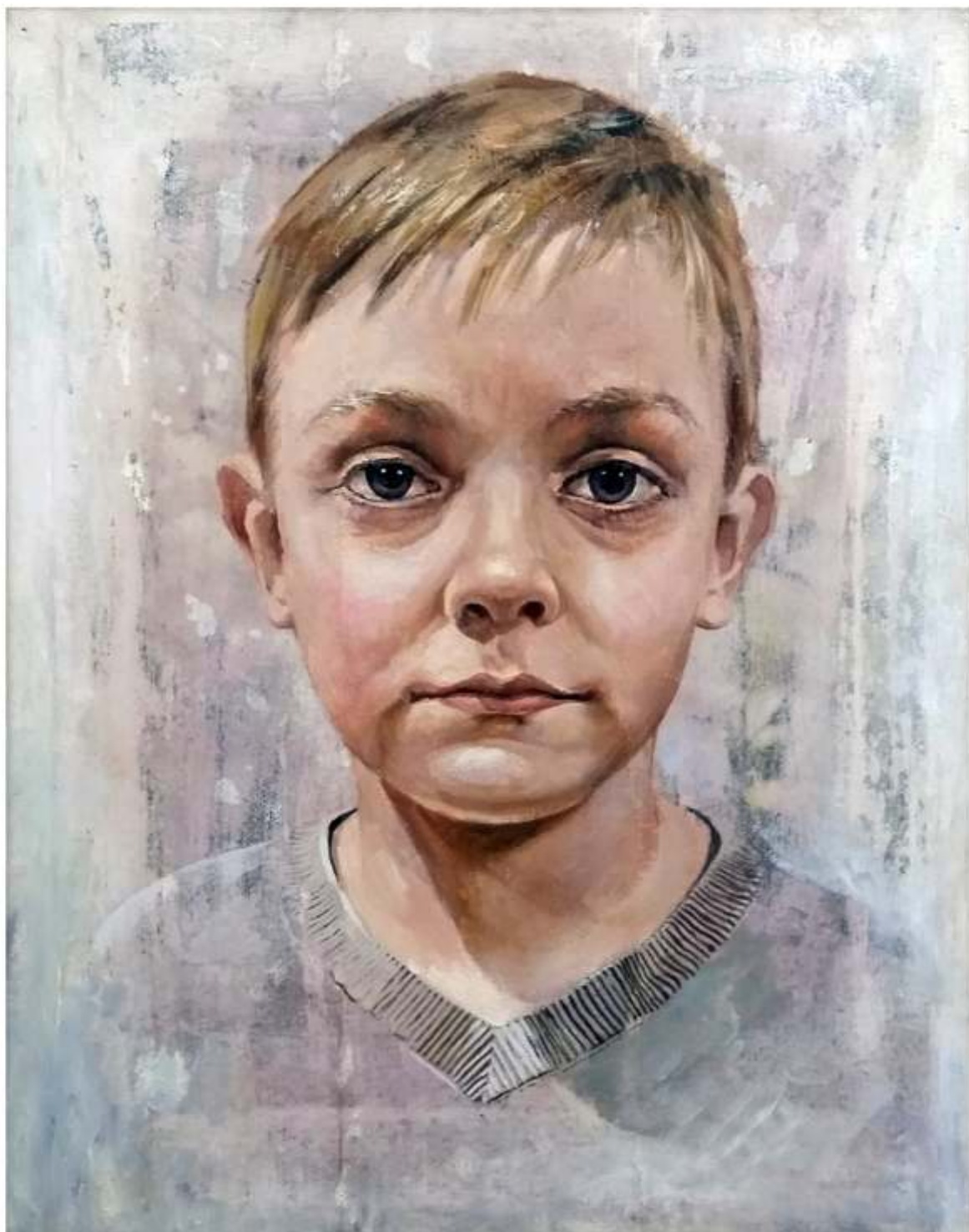
Saşa - ulei pe pânză