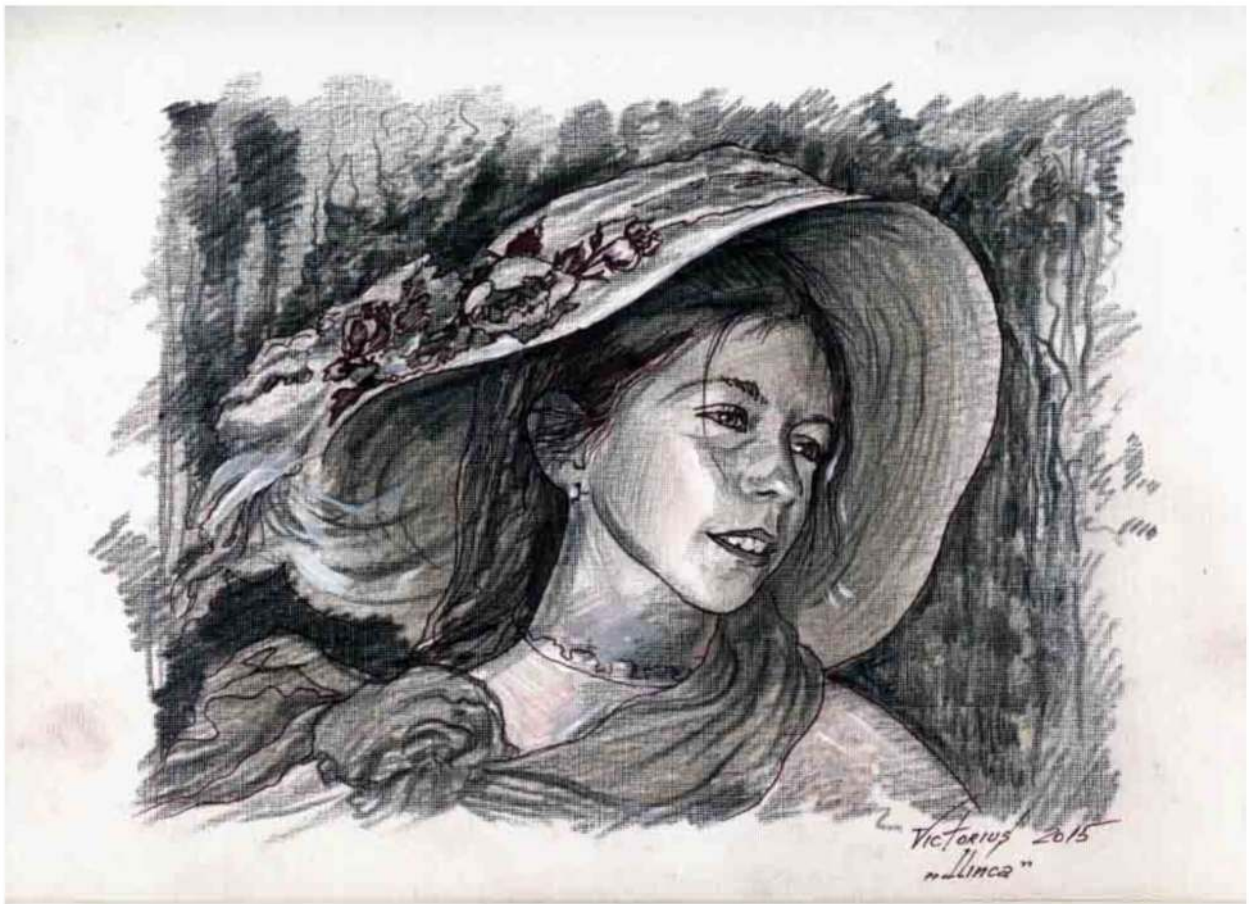
Ilinca (schiță), creion pe hârtie