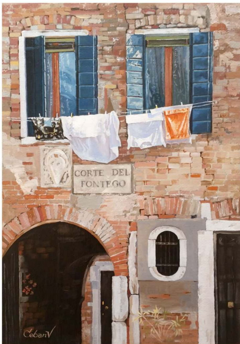
Corte del Fontego, ulei pe pânză