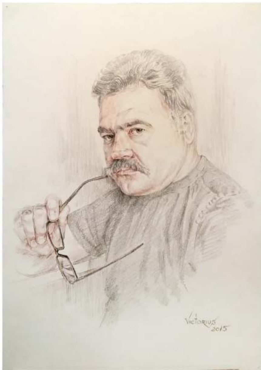
Autoportret, creion cerat pe hârtie