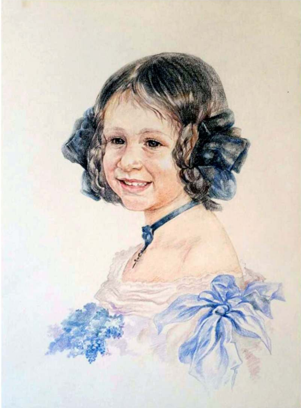
Portret de copil, creion cerat pe hârtie