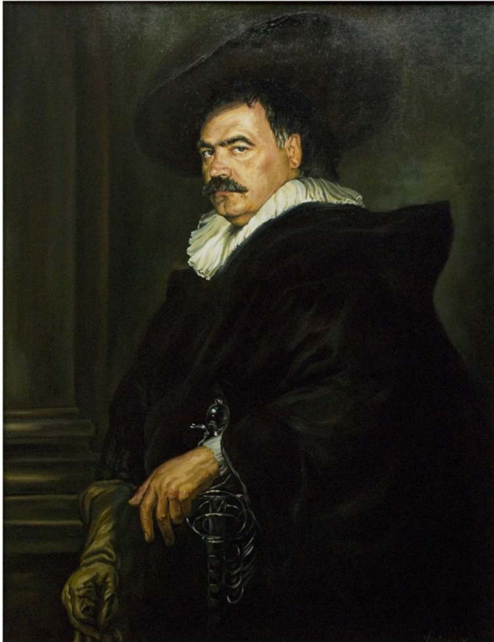
Autoportret - stil Rubens, ulei pe pânză