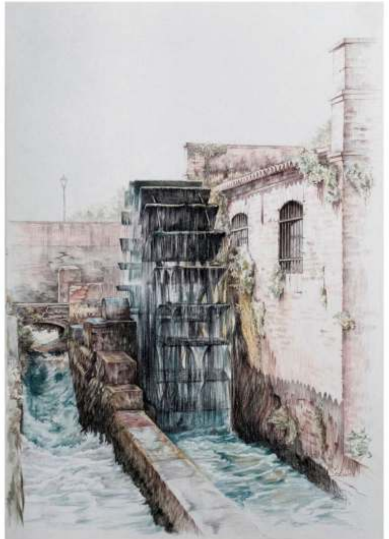
Molino Dolo, creion cerat pe hârtie