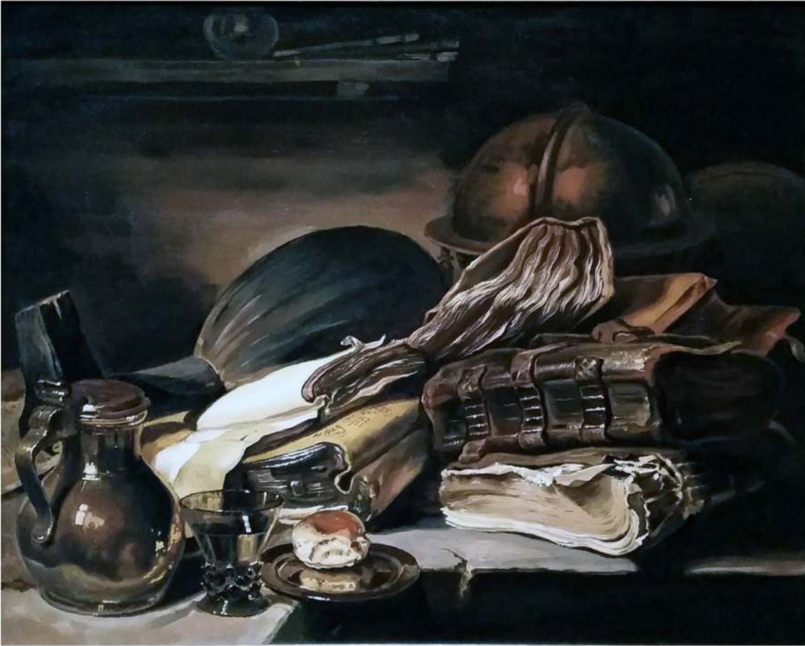
Natură statică , ulei pe pânză replică a picturii - Natură statică , ulei pe pânză (1627), semnată Jan Lievens (1607 - 1674), Olanda