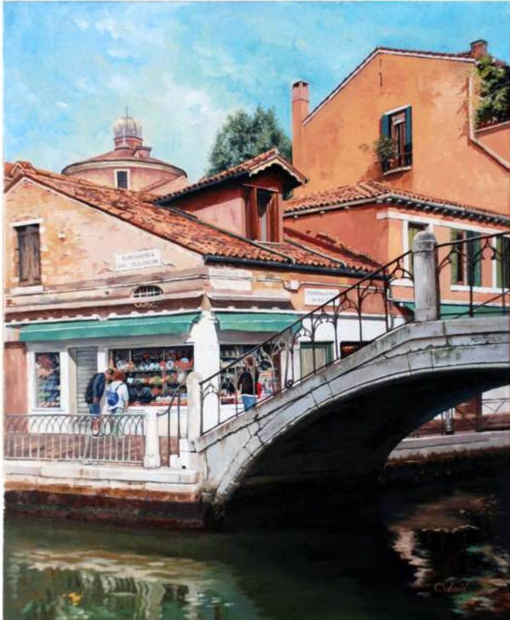
Ponte, ulei pe pânză