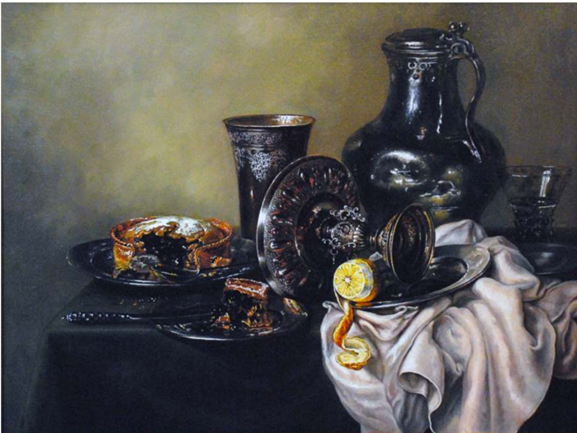
Natură statică , ulei pe pânză replică a picturii - Natură statică , ulei pe pânză (1634), semnată Willem Claesz Heda (1594 - 1680), Olanda