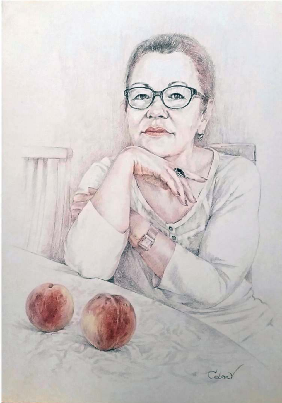
Katia, creion cerat pe hârtie