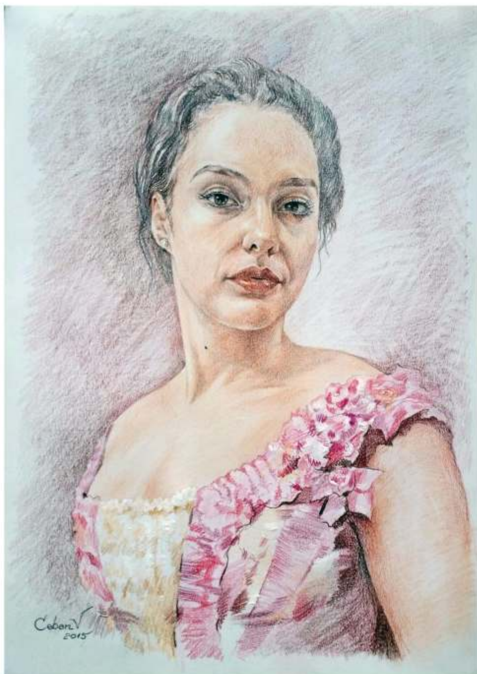
Mara, creion cerat pe hârtie