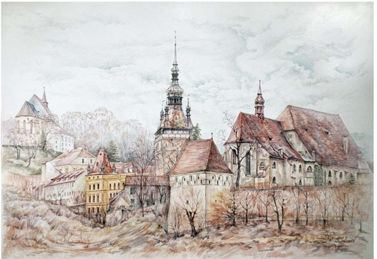
Sighișoara medievală, creion cerat pe hârtie