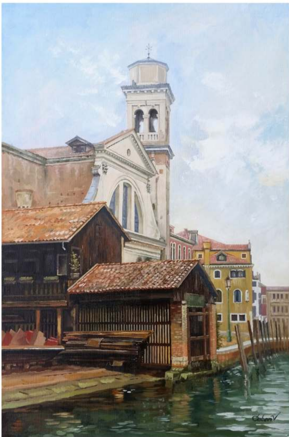
Chiesa di San Trovaso, Veneția, ulei pe pânză