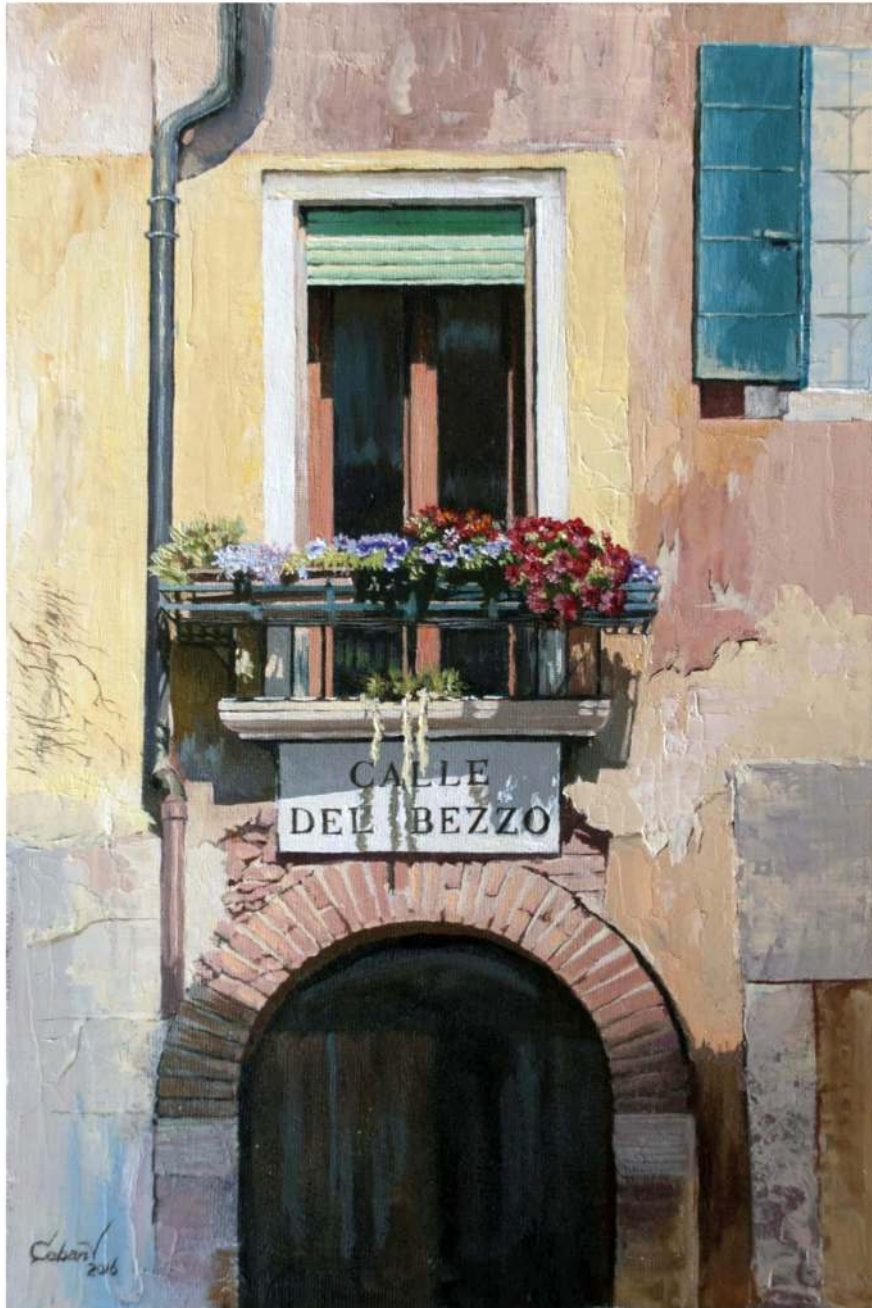
Calle del Bezzo, ulei pe pânză