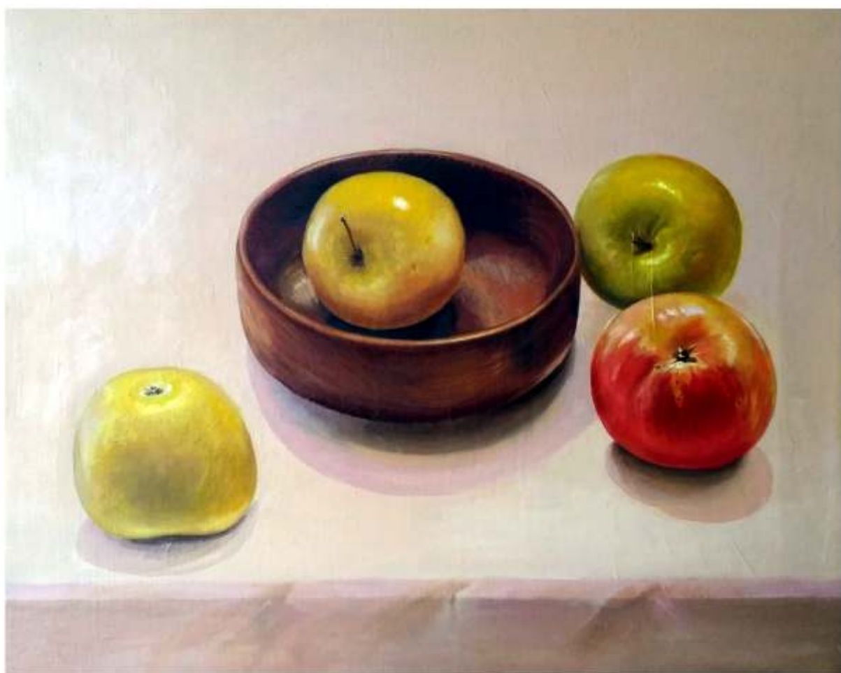
Mere, ulei pe pânză