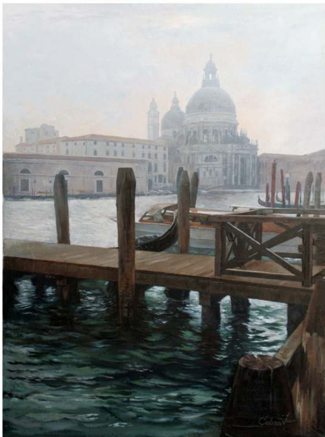
Santa Maria della Salute, ulei pe pânză