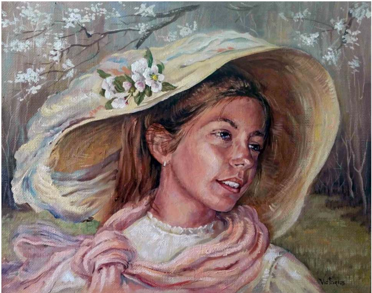
Ilinca, ulei pe pânză