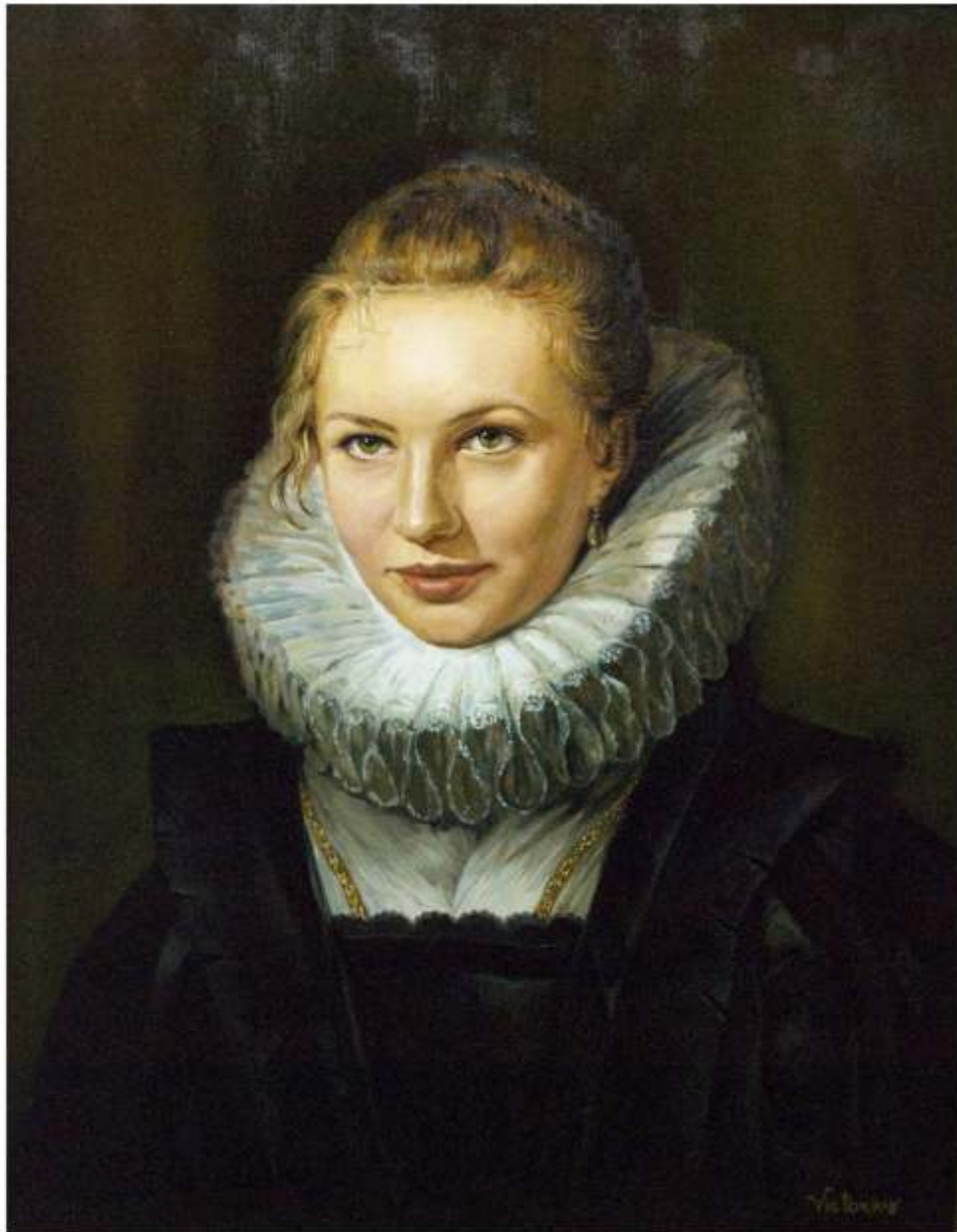
Tatiana, ulei pe pânză