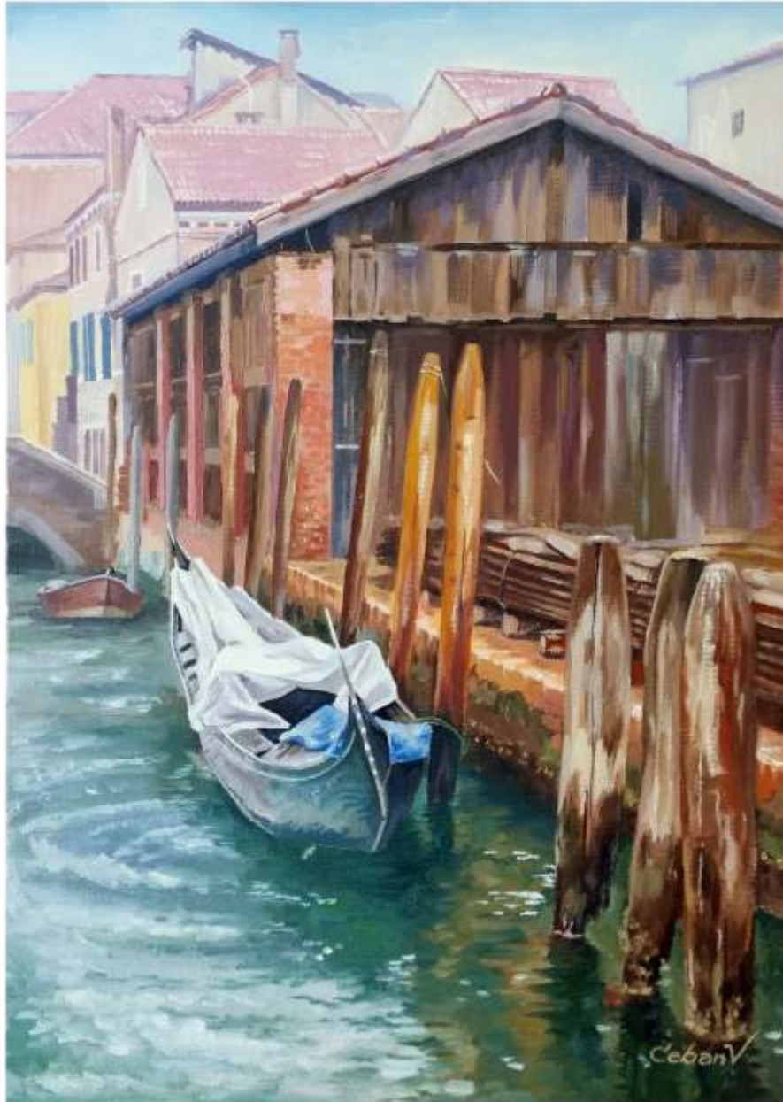
Gondola, ulei pe pânză