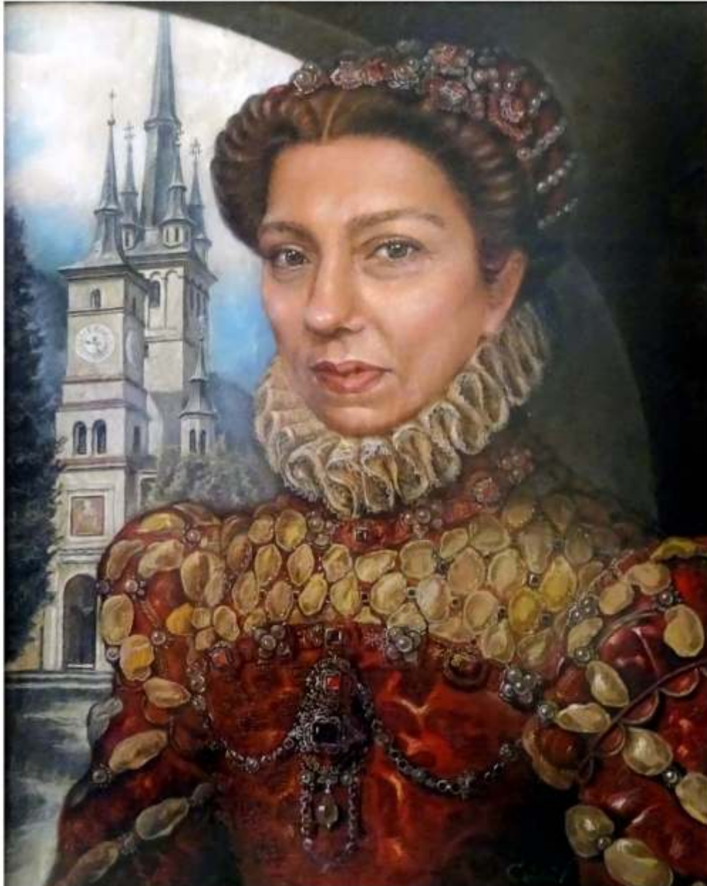
Carmen, pastel pe pânză