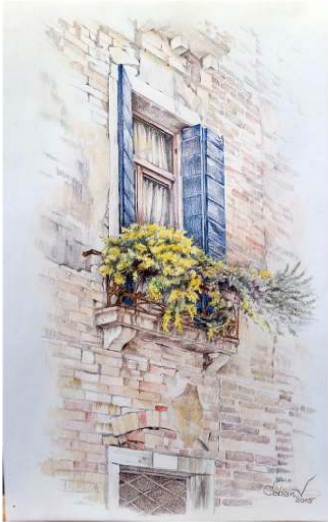
Balcon Venețian, creion cerat pe hârtie