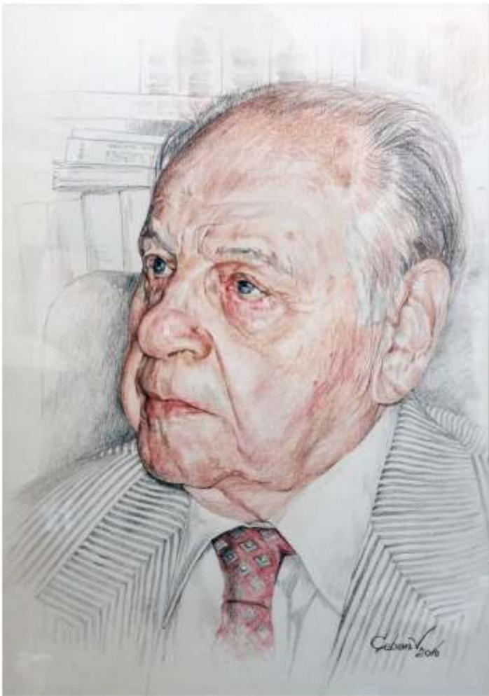
Academician Nicolae Cajal, creion cerat pe hârtie