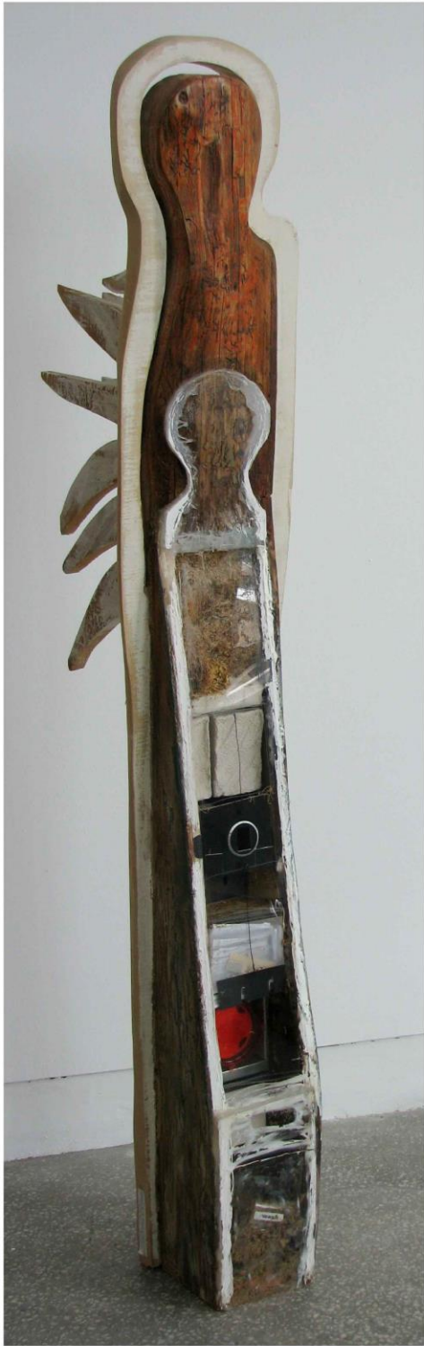
Gabriela Drinceanu, Înger roșu , tehnică mixtă, 165x37x20 cm, 2009