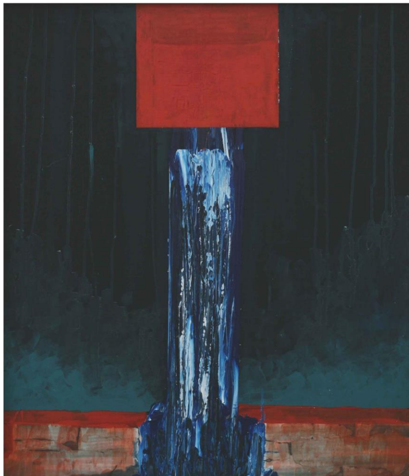
Sabin Drinceanu, Templul Iubirii , acril pe pânză, 100x100 cm, 2010

Concepție catalog și organizare expoziție: Alexandru Pamfil Tehnoredactare computerizată: Alexandru Pamfil