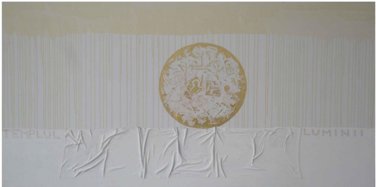
Sabin Drinceanu, Templul Luminii , tehnică mixtă, 200x100cm, 2009