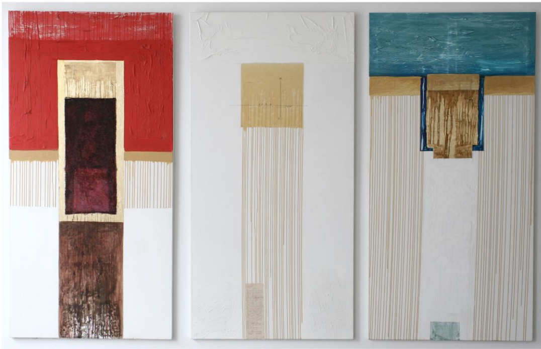
Sabin Drinceanu, Temple , tehnică mixtă, imagine de ansamblu