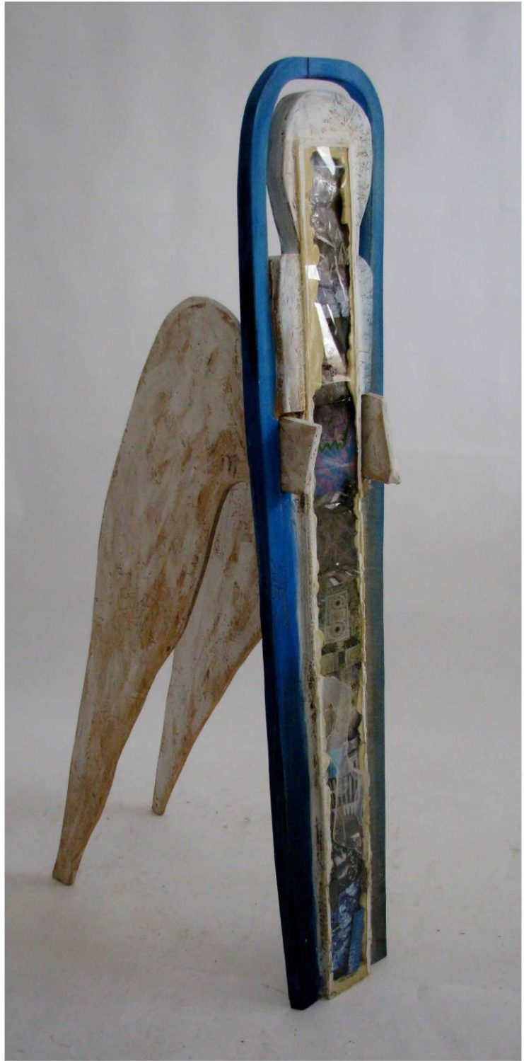
Gabriela Drinceanu, Îngerul apei , tehnică mixtă, 157x89x26 cm, 2009