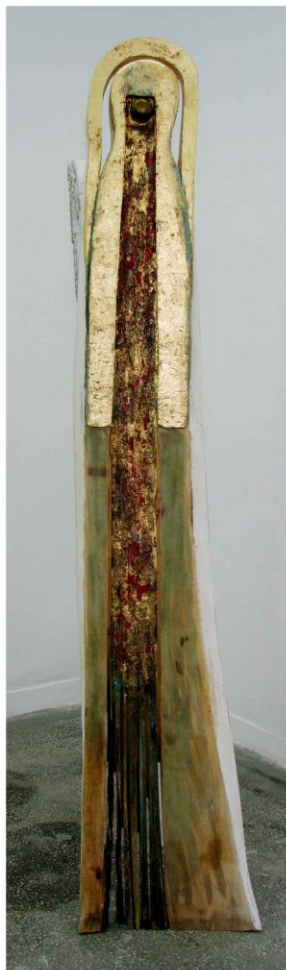
Gabriela Drinceanu, Înger de aur , tehnică mixtă, 210x55x36 cm, 2010