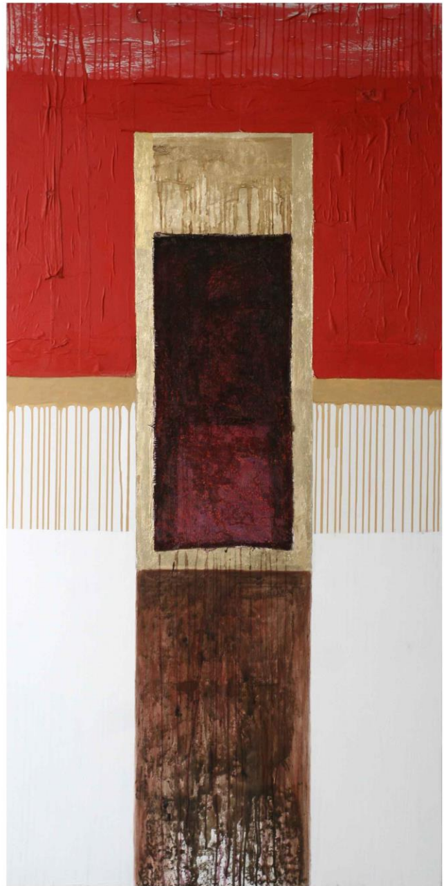
Sabin Drinceanu, Templul focului , tehnică mixtă, 200x100 cm, 2009

EXPOZIȚIA "ATEMPORAL" (PICTURĂ - SCULPTURĂ)