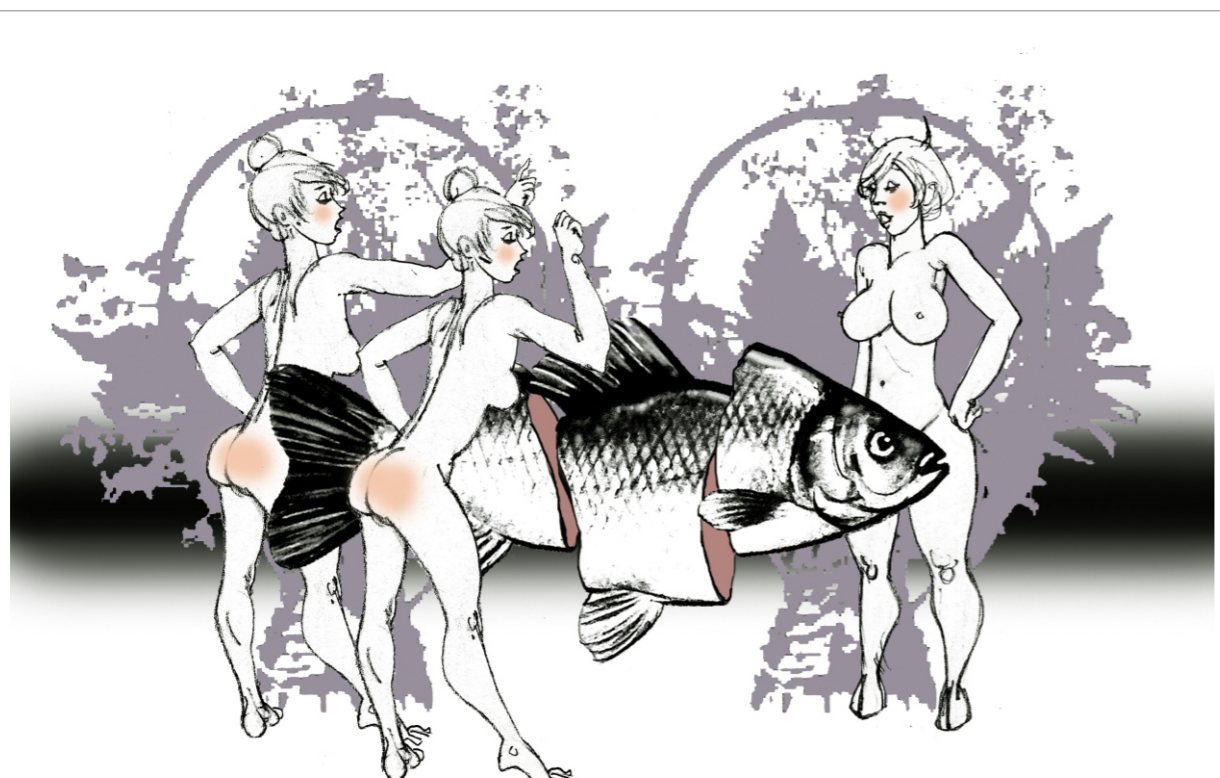
LA MAUVAISE ANNIVERSAIRE