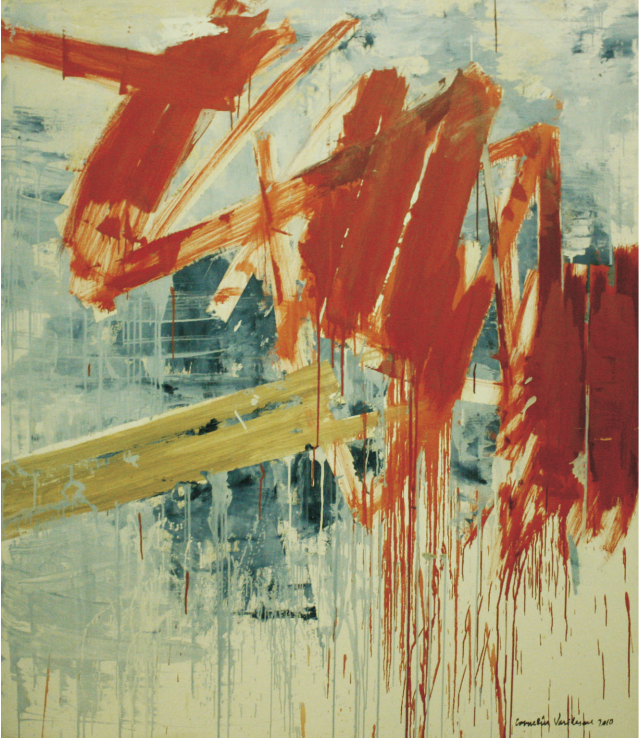
ulei pe pânză 130x150 cm