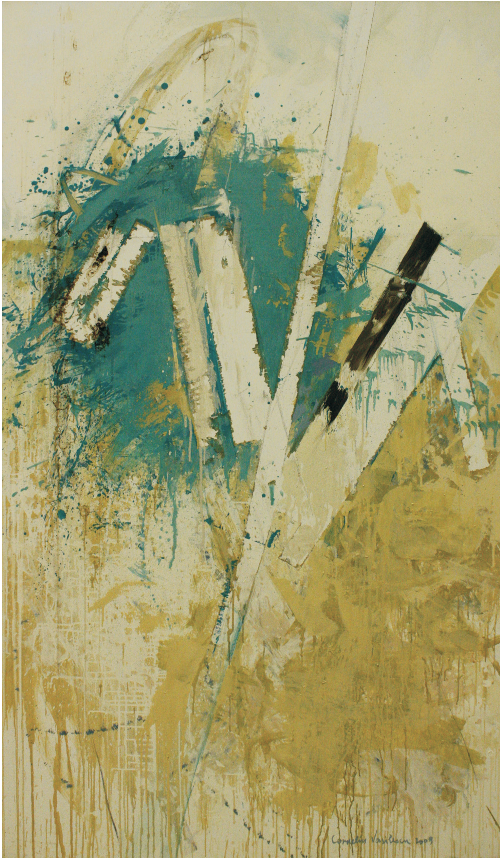
ulei pe pânză 170 x 100 cm