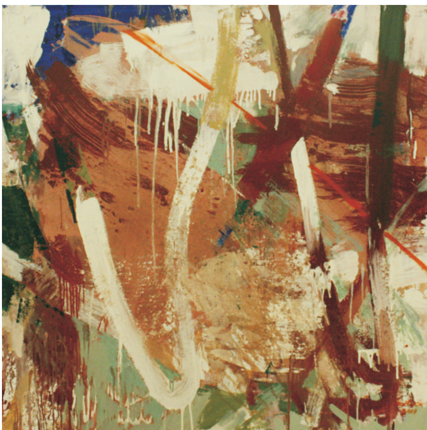
ulei pe pânză 100 x 100 cm