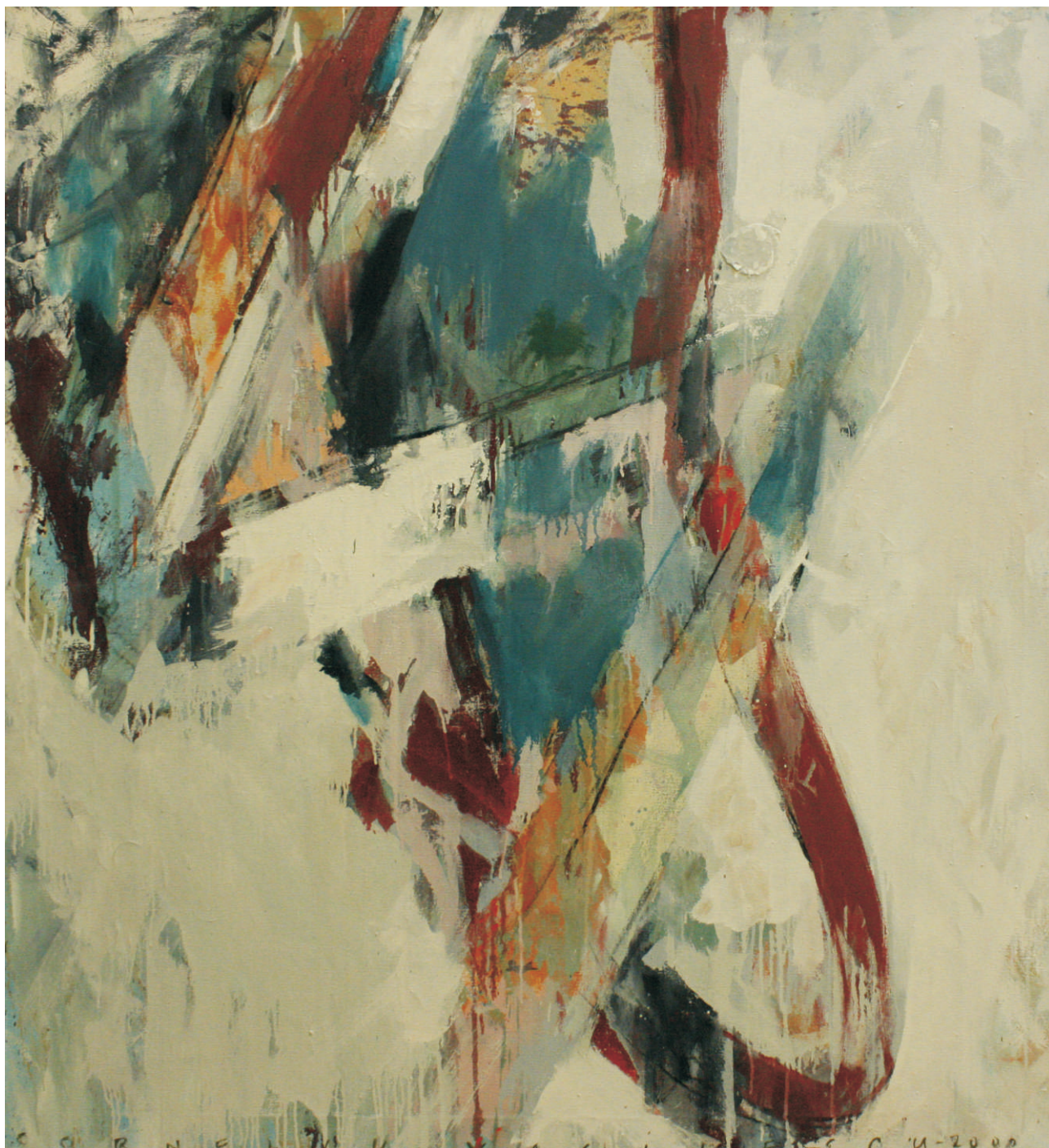
ulei pe pânză 120 x 130 cm