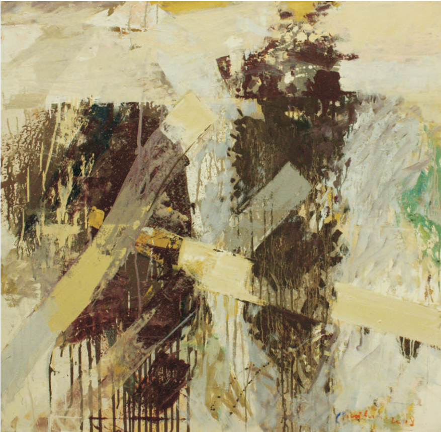
ulei pe pânză 1,00x1,00 m