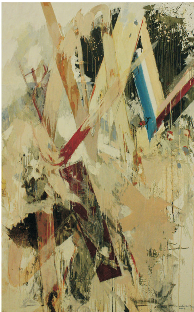
ulei pe pânză 170 x 120 cm