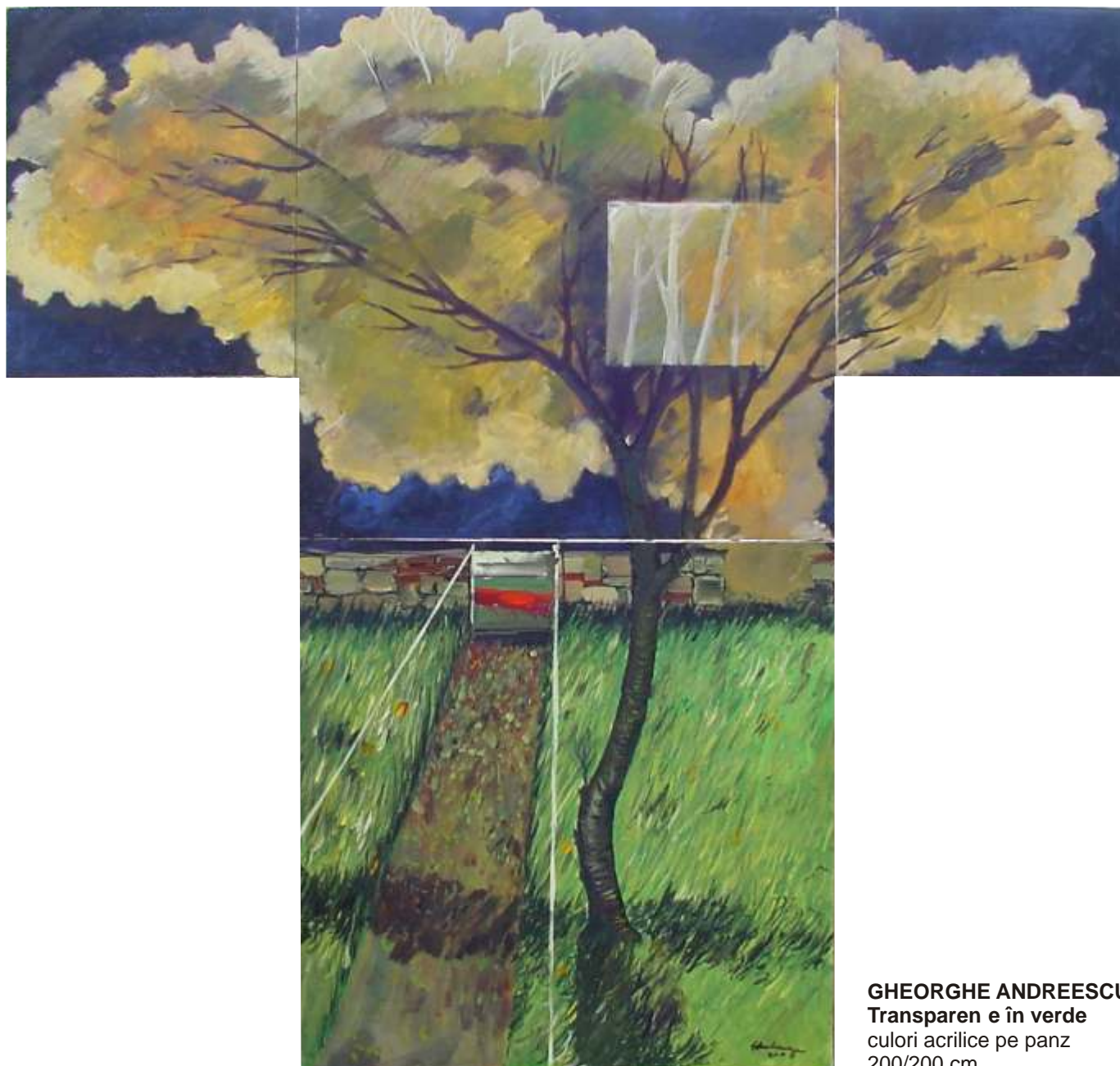
GHEORGHE ANDREESCU Transparen e în verde culori acrilice pe panz 200/200 cm