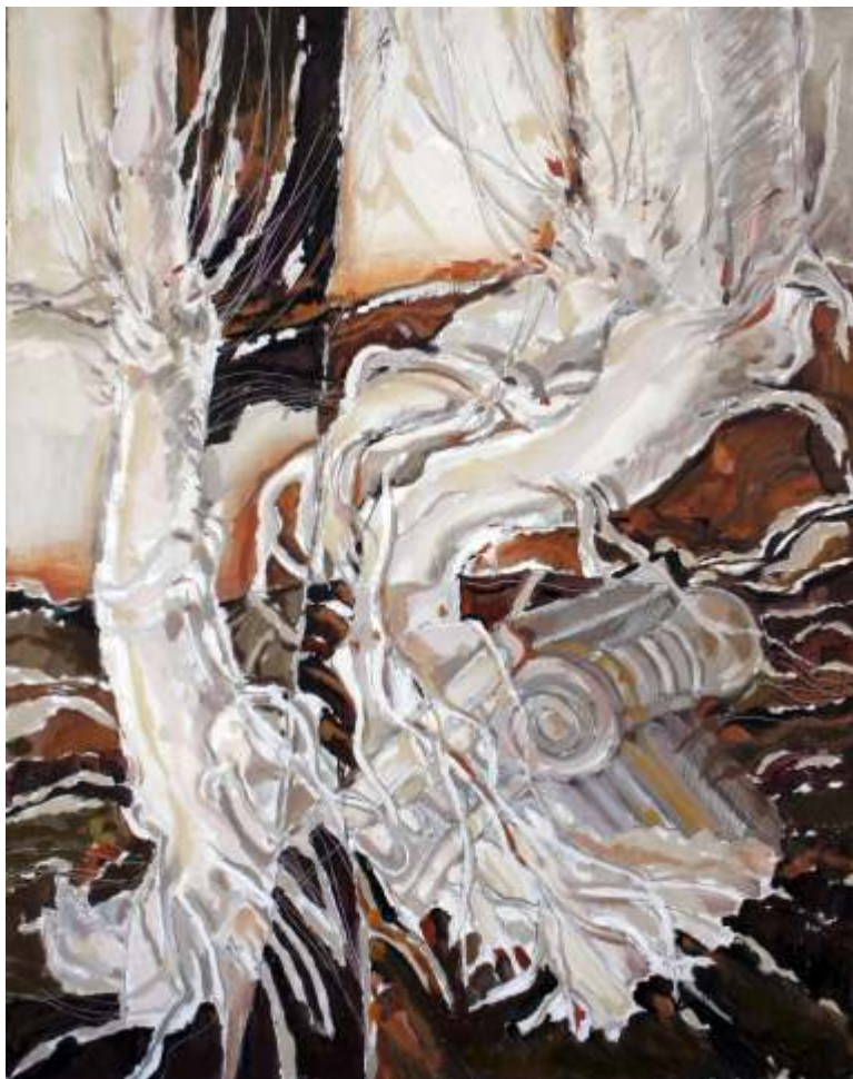
JANA ANDREESCU Semnele pamântului II ulei pe carton 86/70 cm;