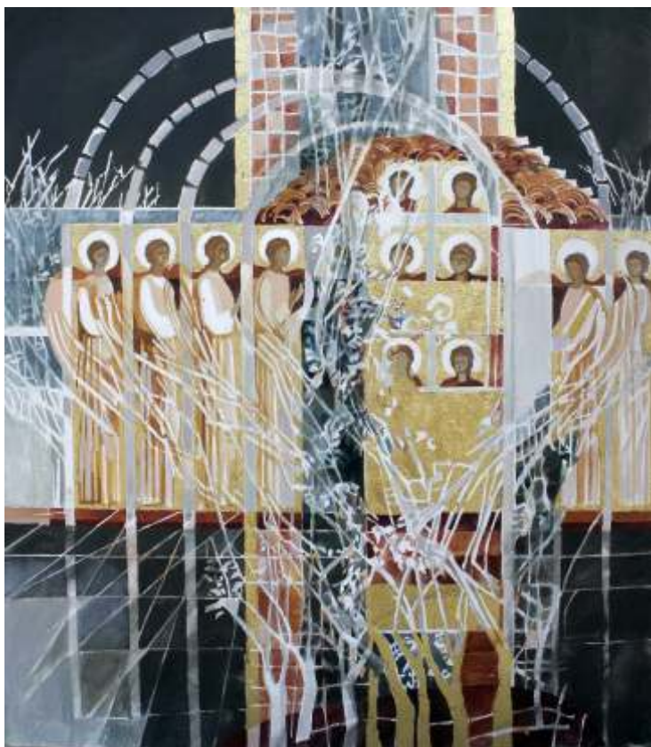
LILIANA JORICA NEGOESCU Casa cu îngeri tempera cu ou pe pânză 80/70 cm