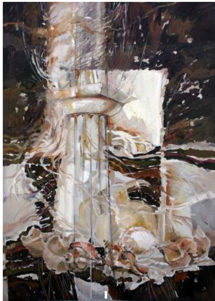
JANA ANDREESCU Semnele pamântului I ulei pe carton 100/70 cm;