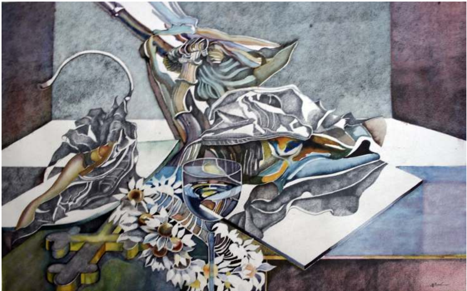
CORNELIA BURLACU Natur i spirit tehnica mixt 34/64 cm