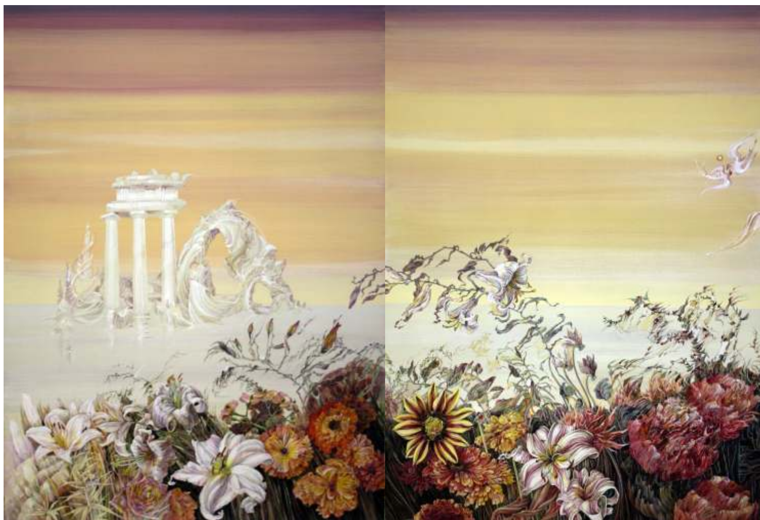
GABRIELA GEORGESCU Gr din pe rm culori acrilice pe pânz 87/130 cm