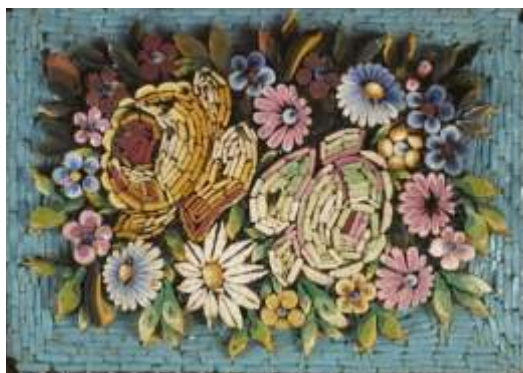
PLACHET - sticl MILLEFIORRI ,cca. 1900 MURANO VENE IA