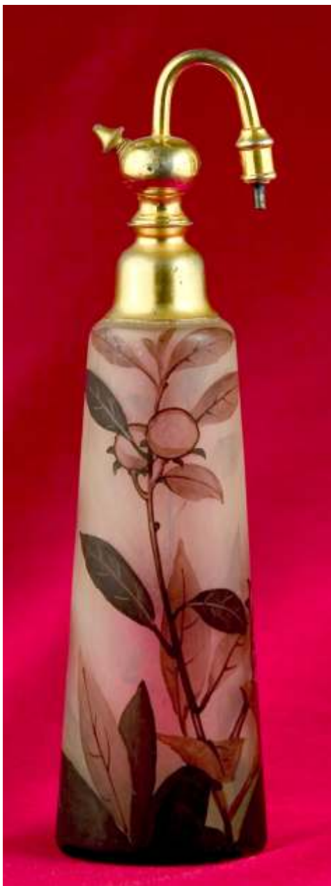
FLACON PARFUM - sticl stratificat , pictat PEYNAUD FRAN A