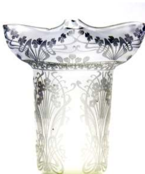
ABAJUR - sticl gravat începutul secolului XX