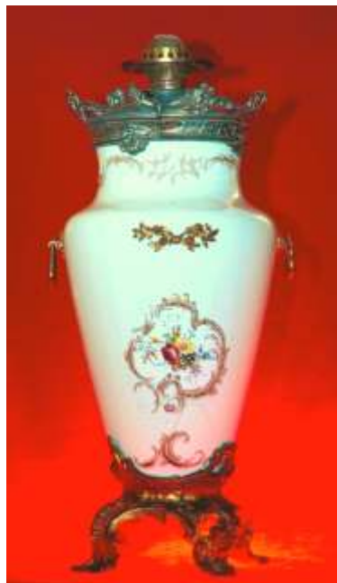
SUPPORT LAMPA - caolin și antimoniu, cca. 1920