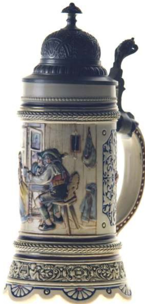
BOCK - faian pictat început de secol XX GERMANIA