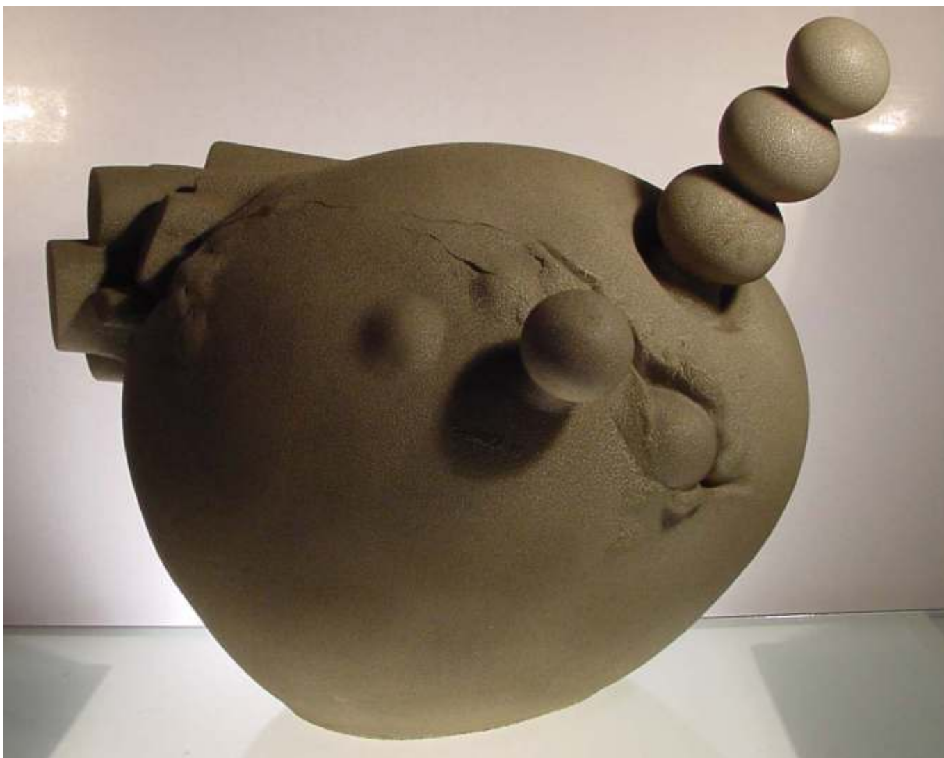
Costel Badea CORP SELENAR - faian