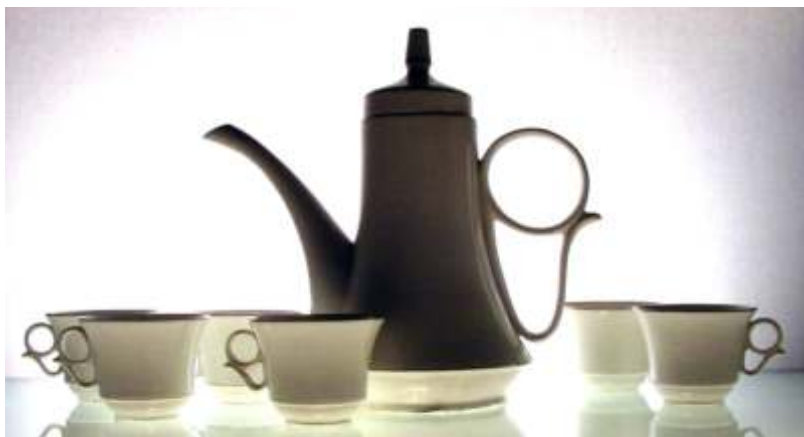
Ieremia Hinat SERVICIU DE CAFEA - por elan