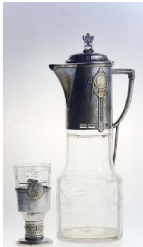
SET UZUAL - cristal ART DECO