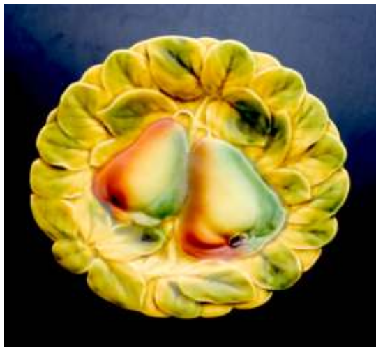
PLATOU - caolin, decor în relief, pictat SARREGHUEMINES