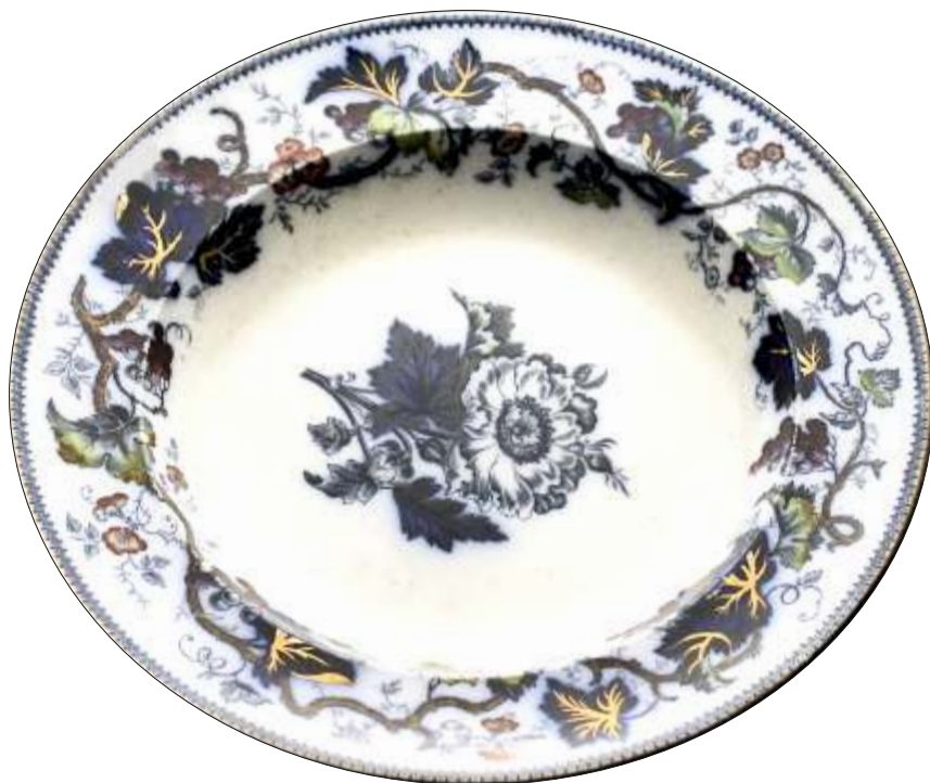
PLATOU - faianta , fir it de secol XIX WEDWOOD ANGLIA