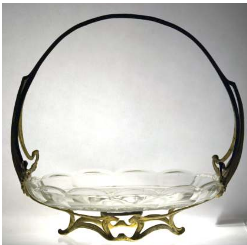
FRUCTIERA bronz aurit i platou din cristal BOHEMIA - ART NOUVEAU