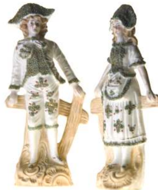
STATUETE - por elan , început de secol XX MEISSEN