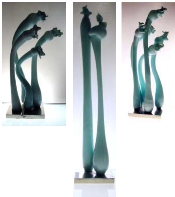
Dan B nci OMAGIU - sticl opal