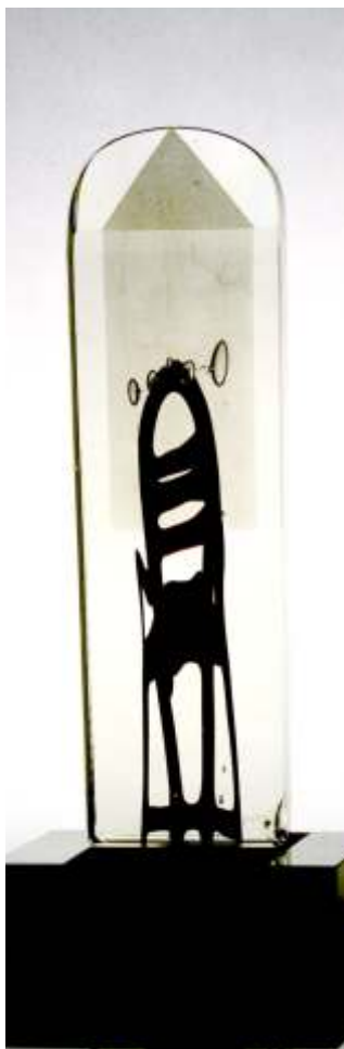
Valeriu Neag FOTOLIUL DIN FEREAȘTRA - sticla