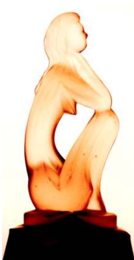
STATUET - sticl masiv m tuit perioada interbelic MURANO