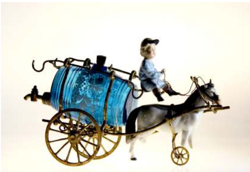
PIESA SERVICIU BAUTURI - sticlă și portelan sfârșit de secol XIX MEISSEN