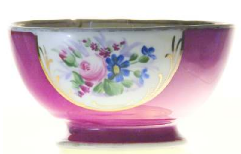
Kusnetzova BOL - portelan cca.1900 RUSIA