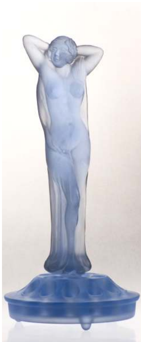
STATUET - sticl masiv m tuit inceput de secol XX MURANO