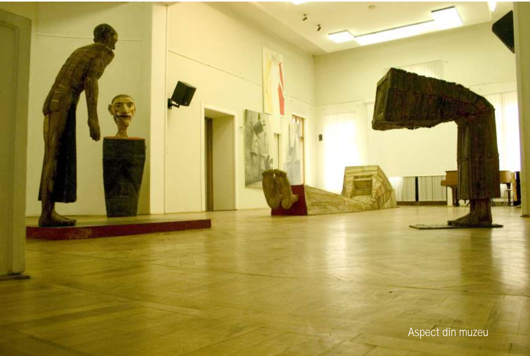
Aspect din muzeu