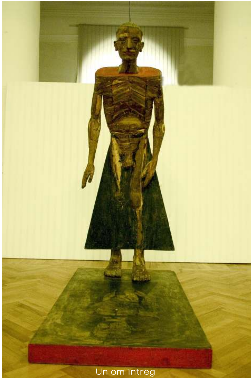
Un om întreg