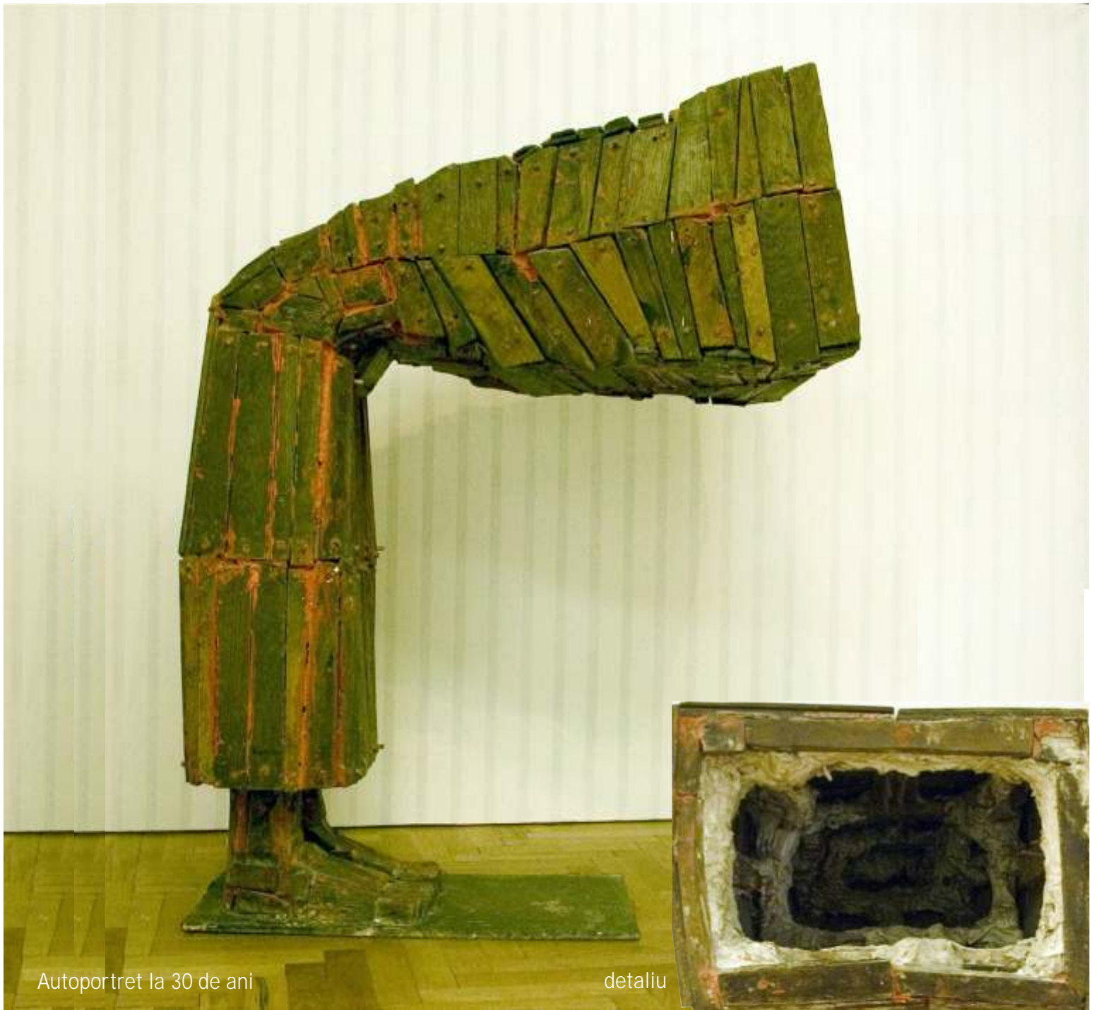
Autoportret la 30 de ani