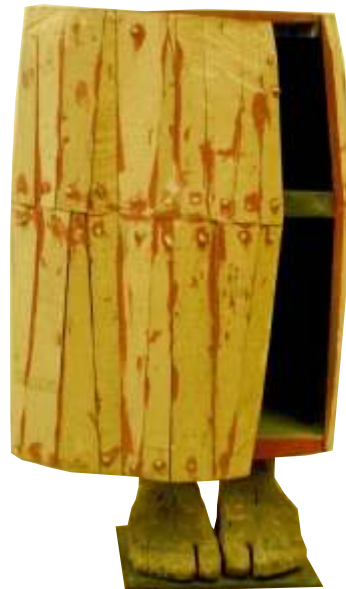
Picioare și mână de om