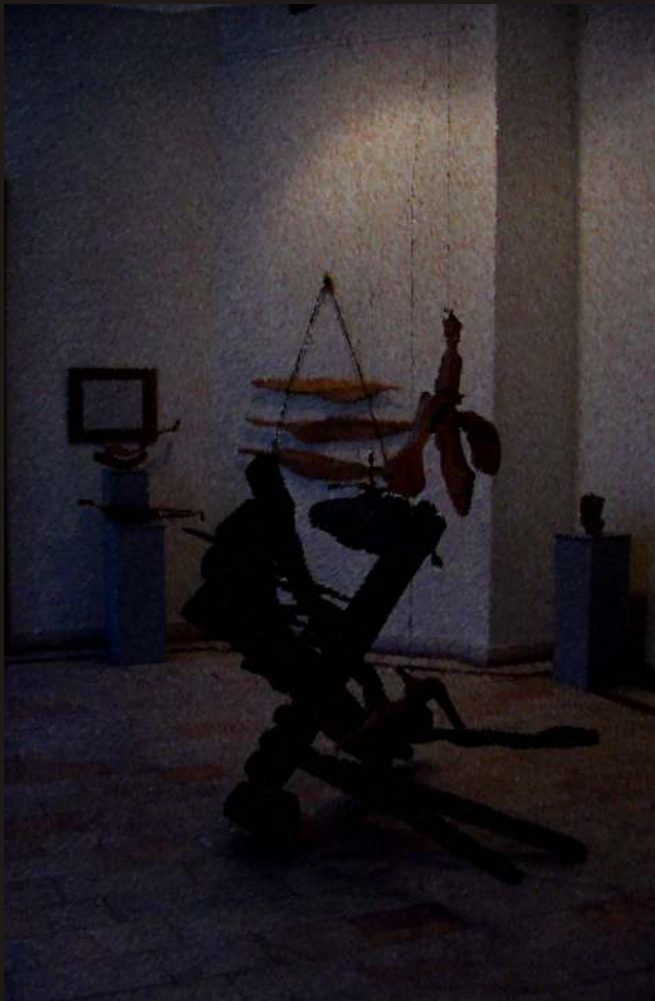
final - ambient