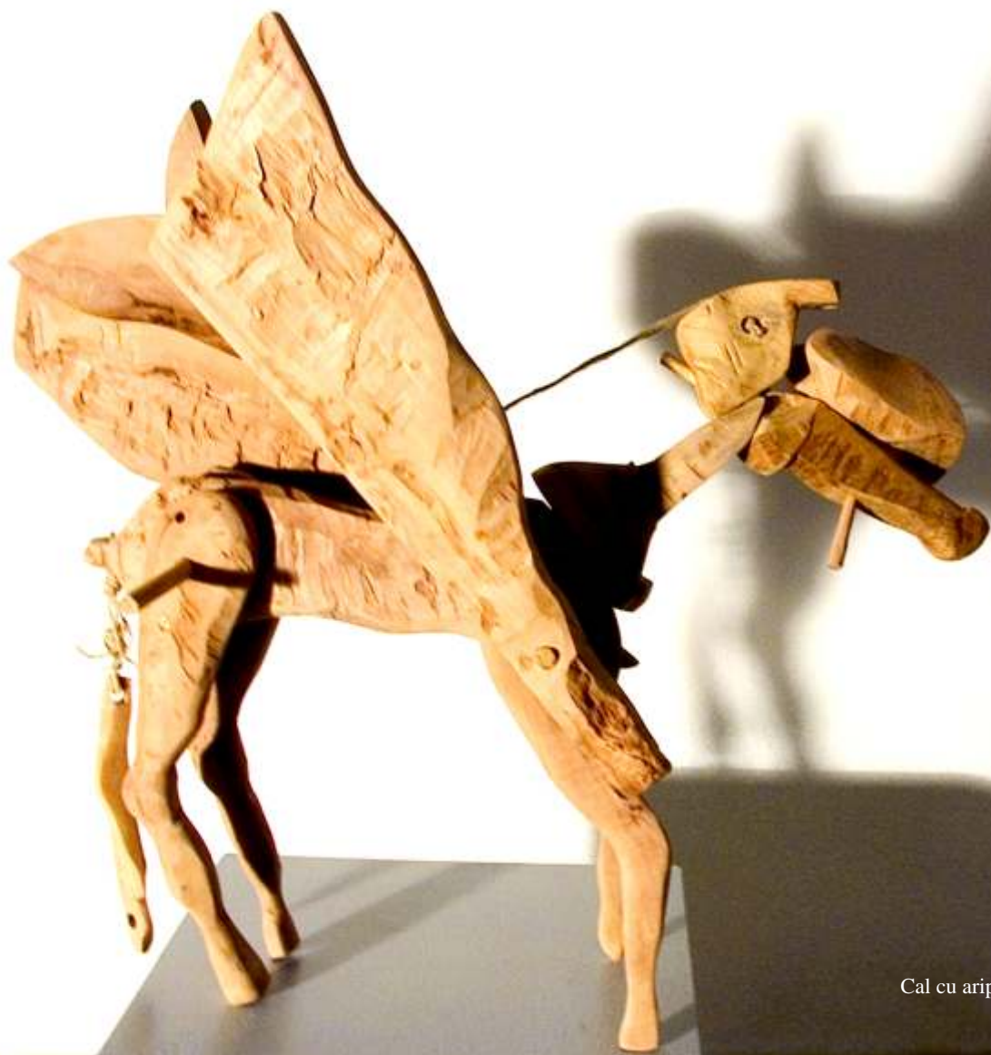
Cal cu aripi