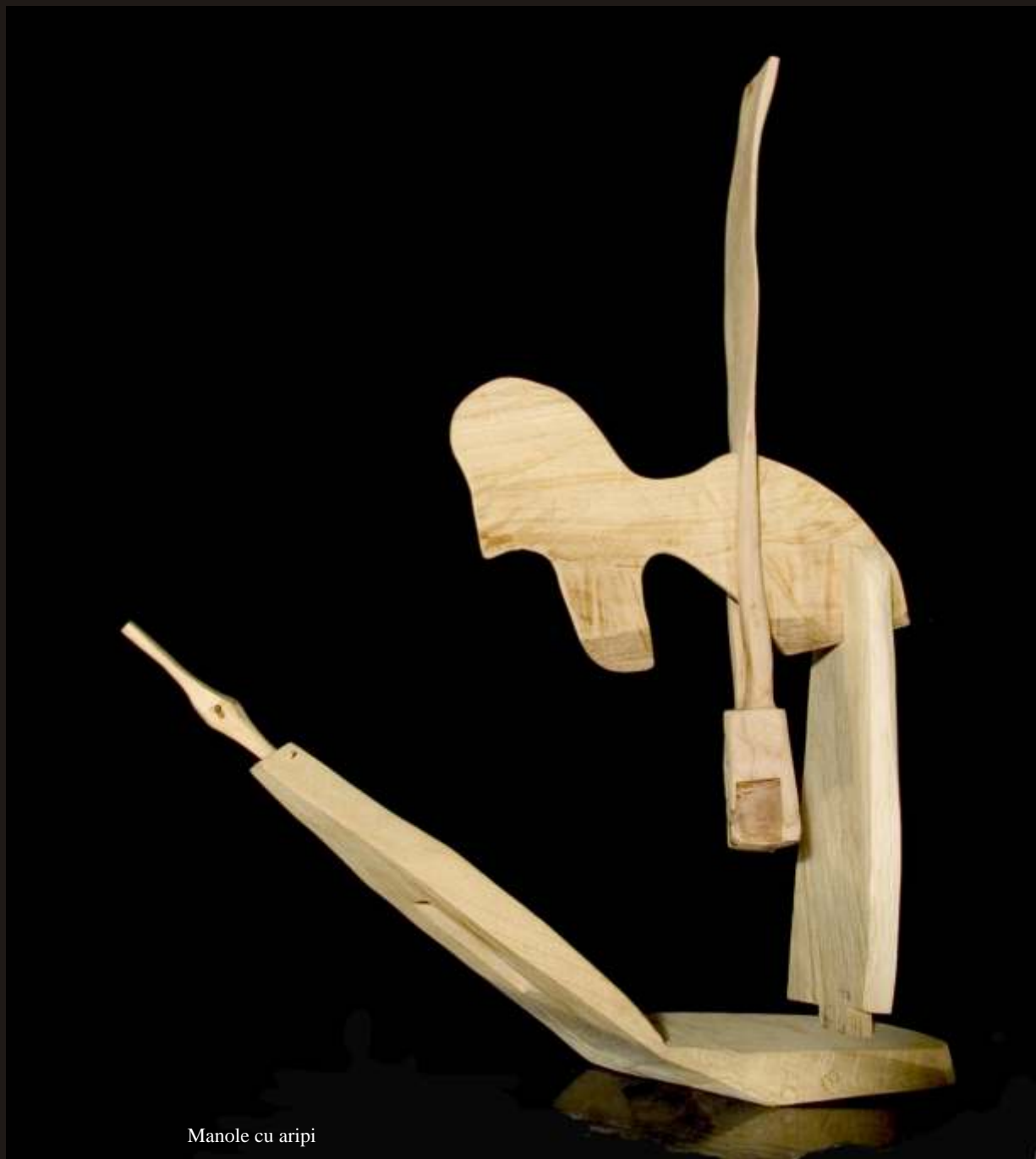
Manole cu aripi