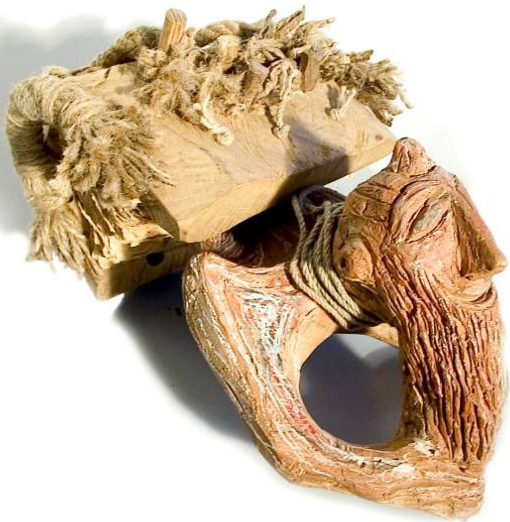
Negustorul de vise