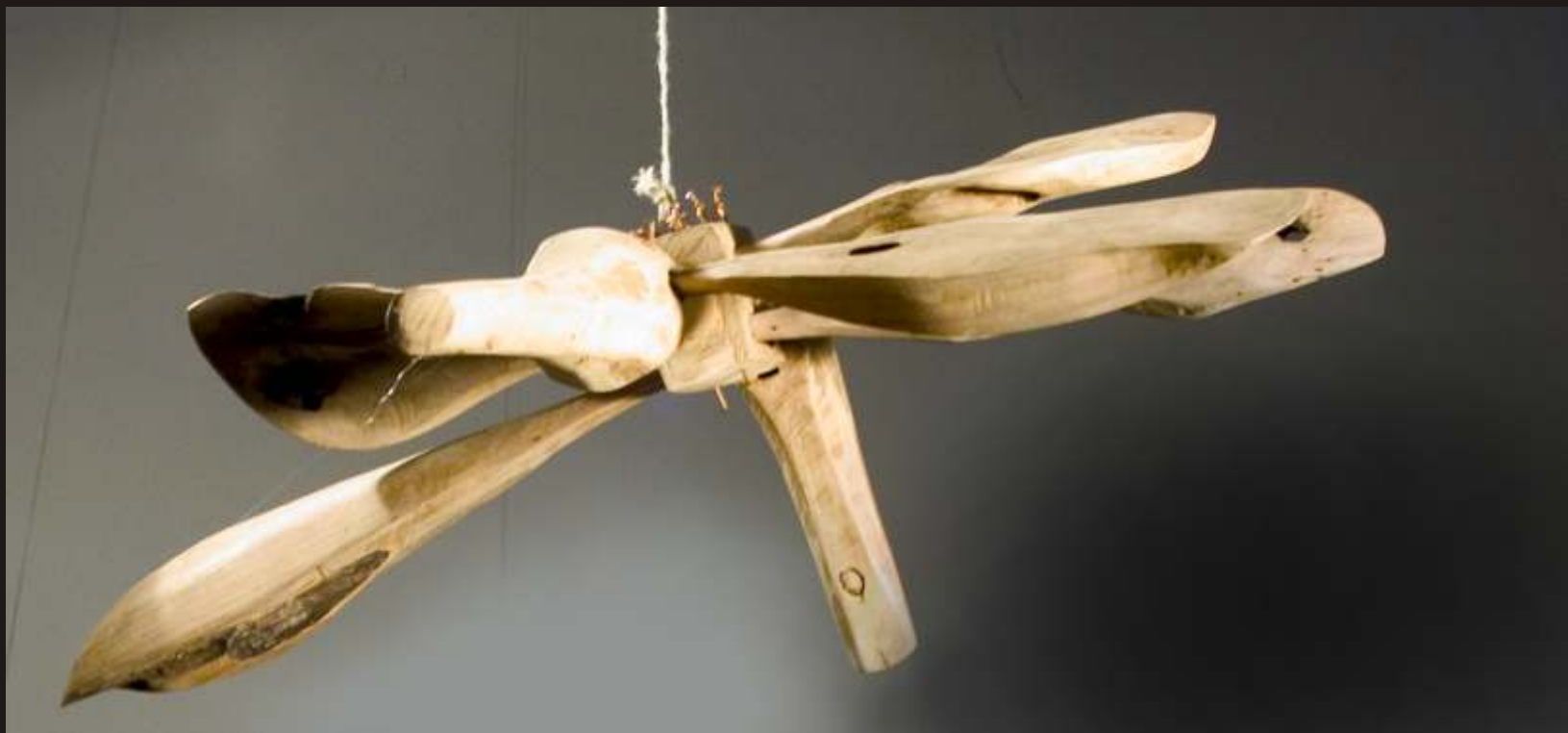
Cinci insecte care decurg firesc din cea mare (detaliu I)