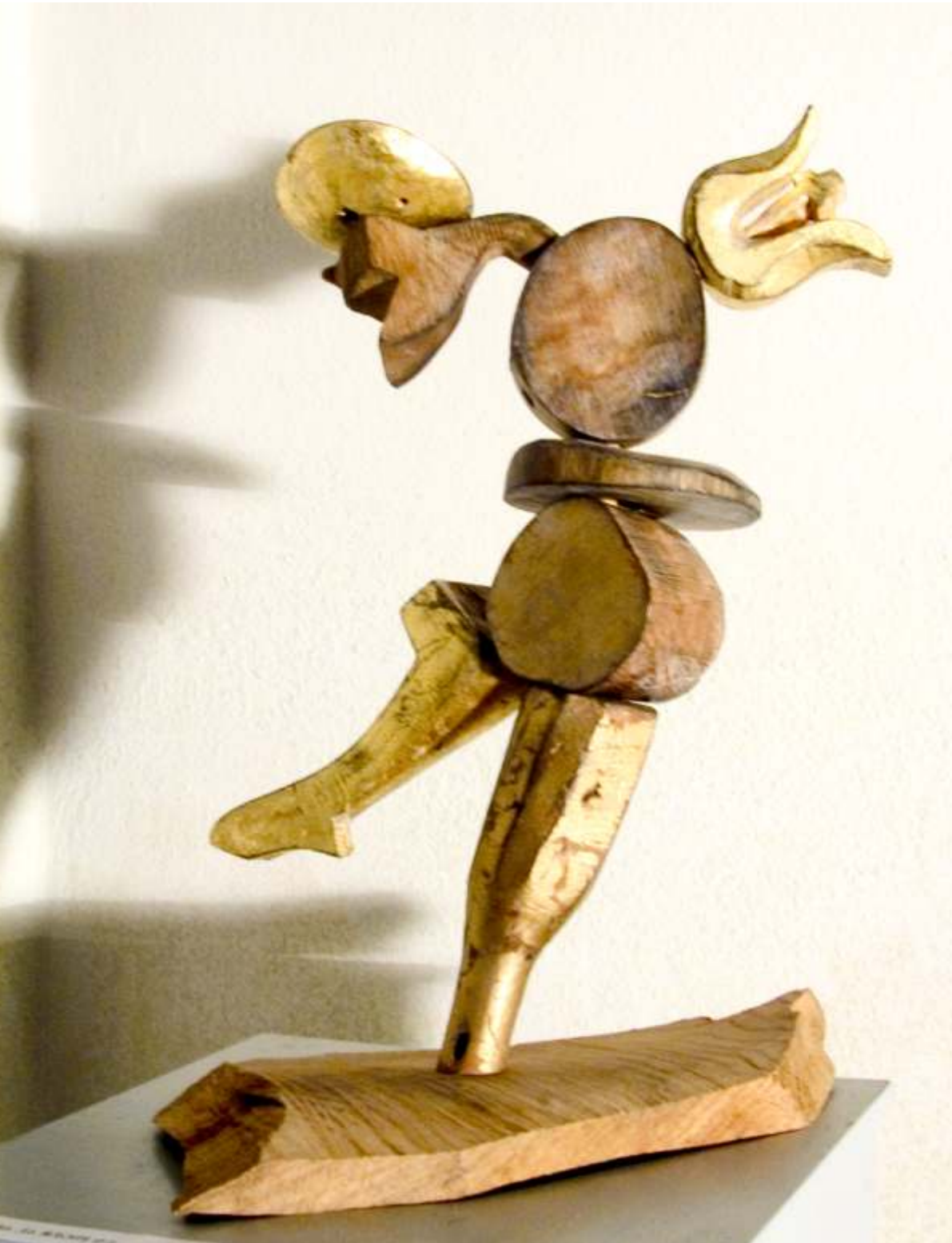
Un înger al apocalipsei