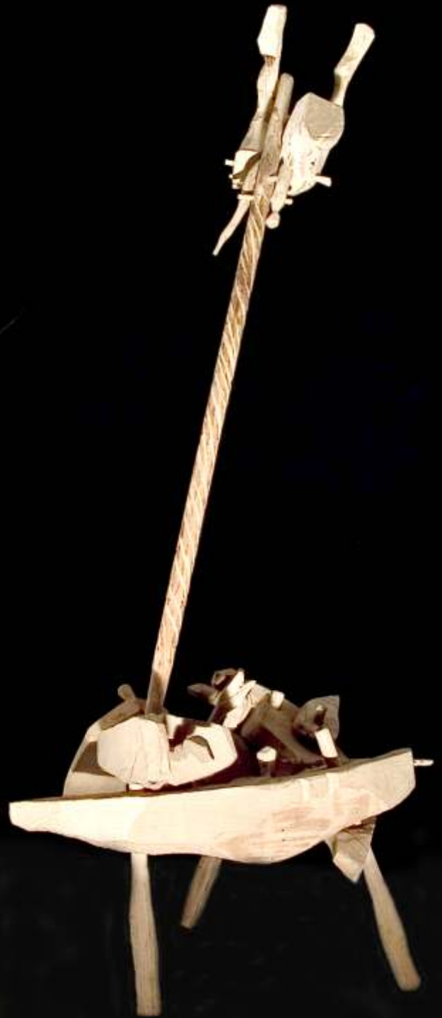
Vân torul de vârcolaci