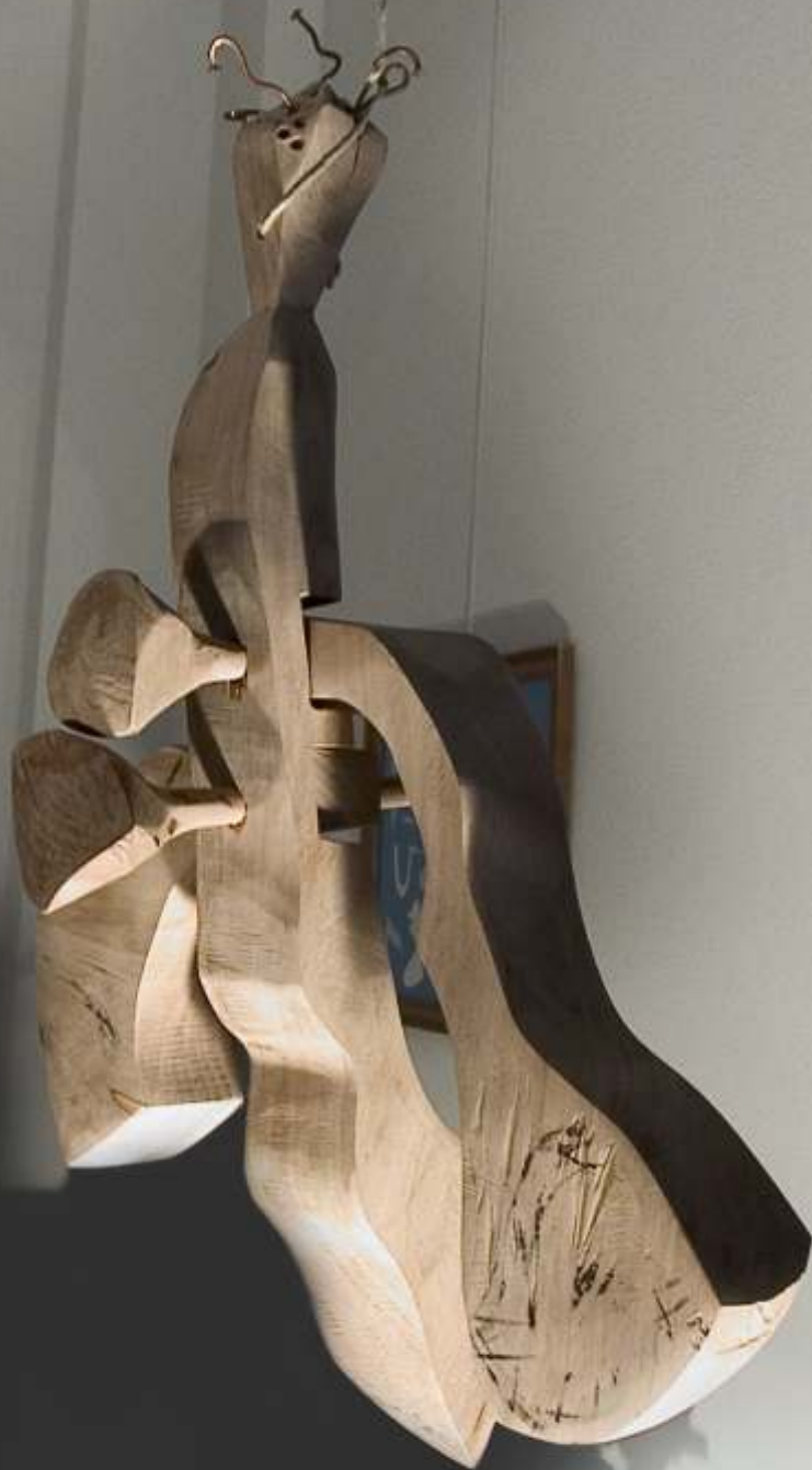
Cinci insecte care decurg firească din cea mare (detaliu II)