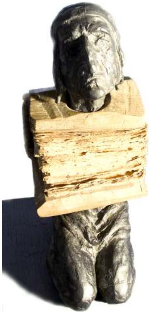
P zitorul c r ilor