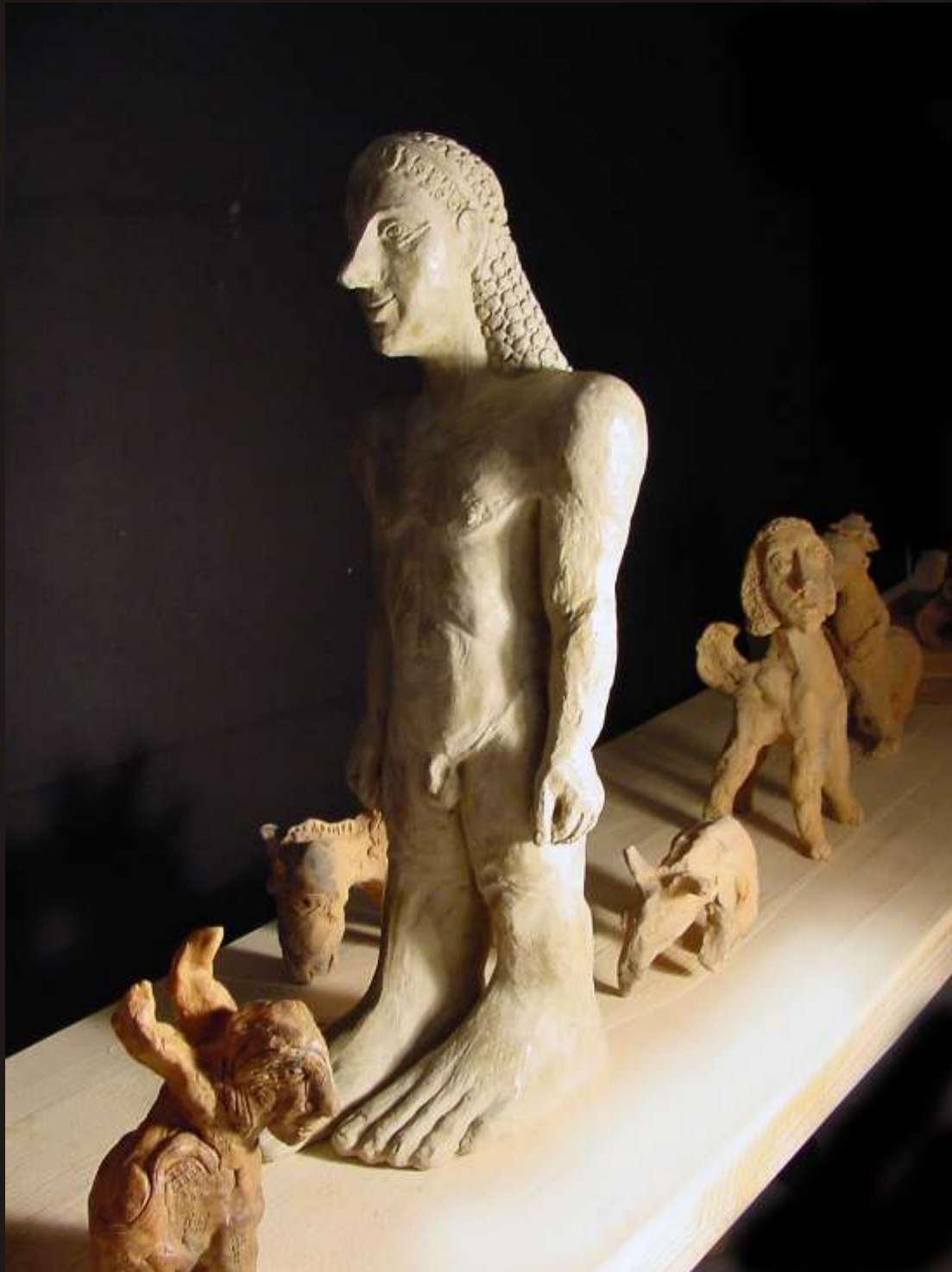
P storul i cele 16 vedenii i închipuiri